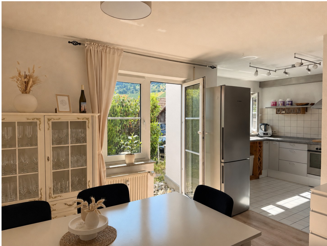
Essbereich vor der Küche mit k