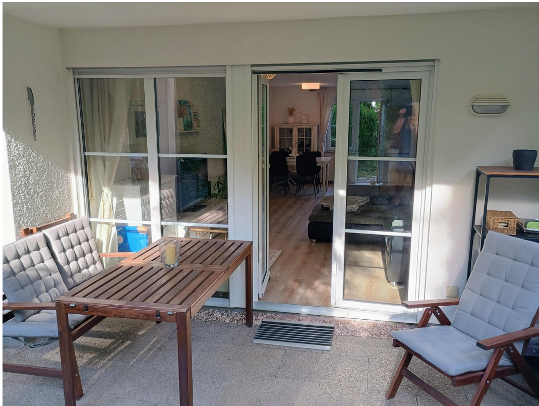
Überdachte Terrasse Nord