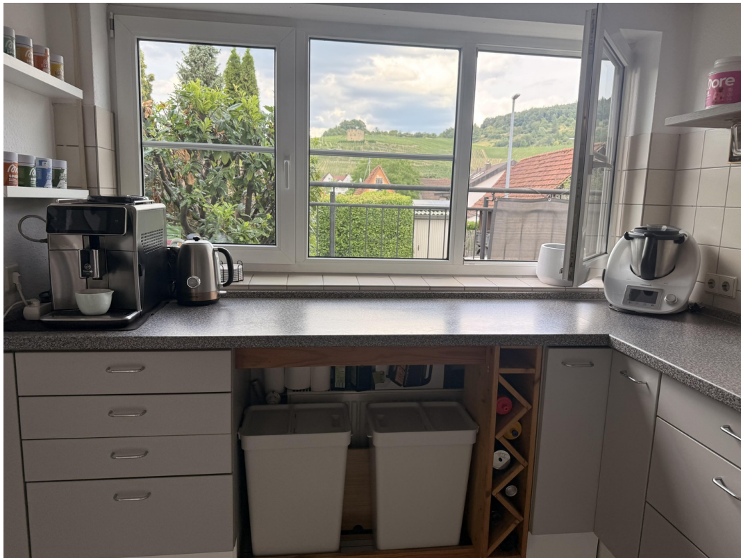
Küchenfenster mit Arbeitsplatt