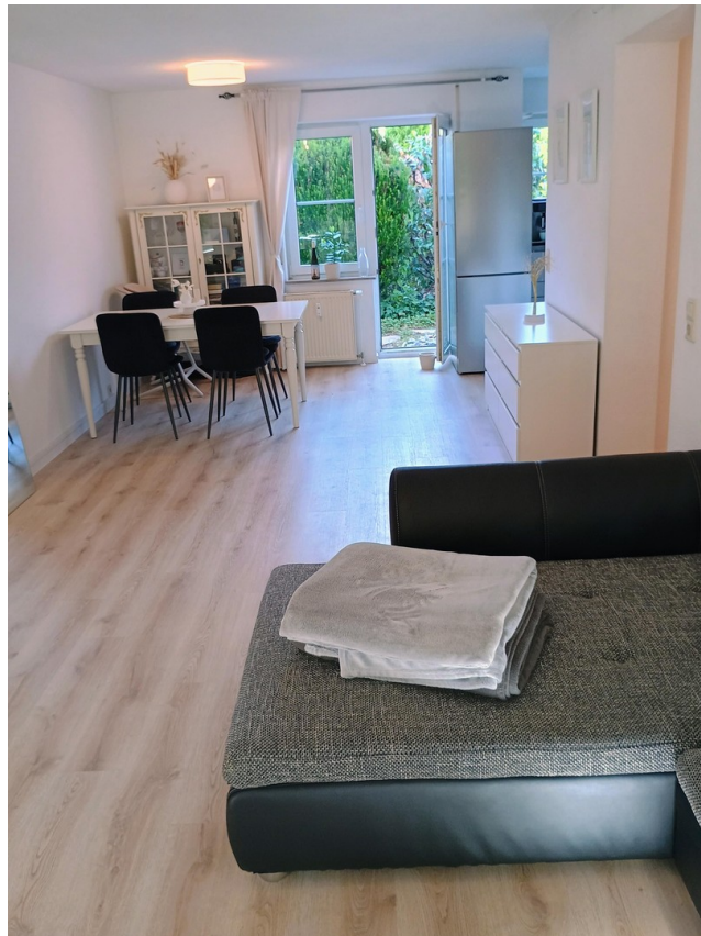
Wohnzimmer mit Essbereich und