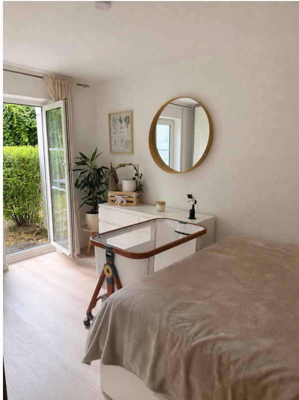
Schlafzimmer mit Ausgang zum G