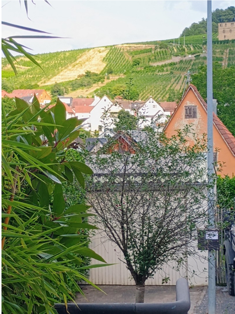
Blick von Terrasse4 Süd