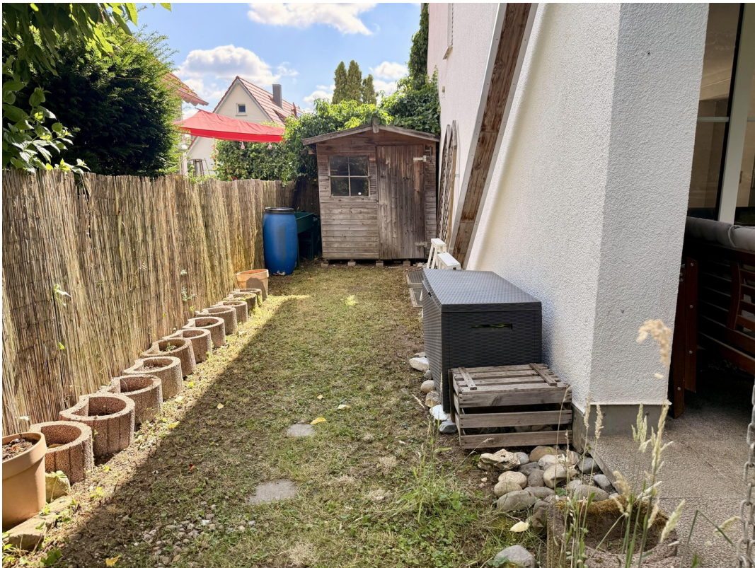
Garten Ost mit Gerätehütte