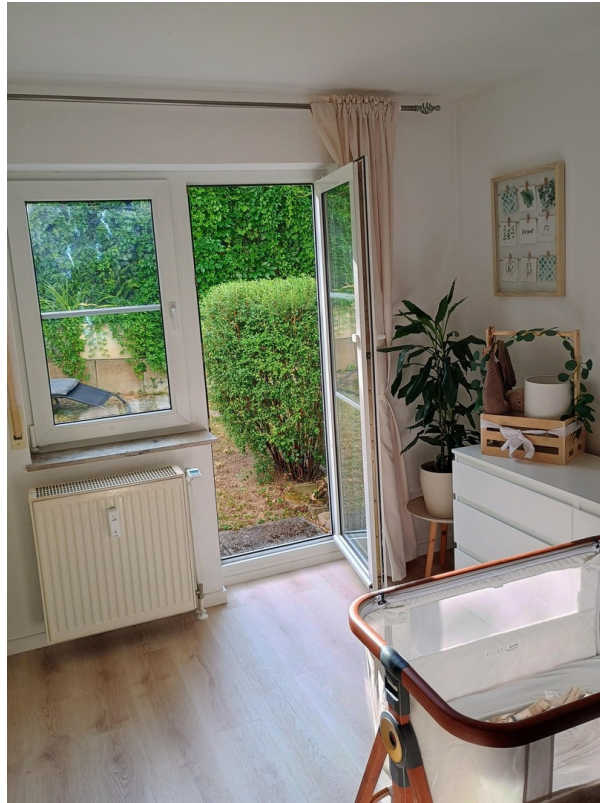
Ausgang Schlafzimmer zum Garten