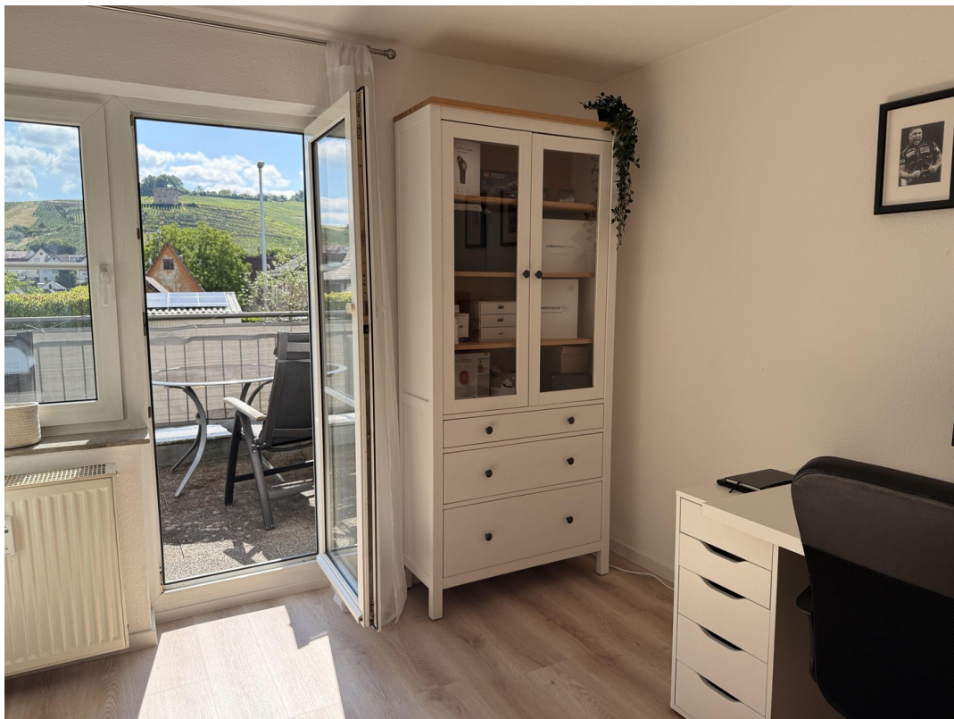
Arbeitszimmer mit Aüdtterasse