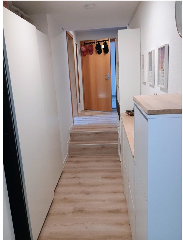
Flur mit Eingangstüre