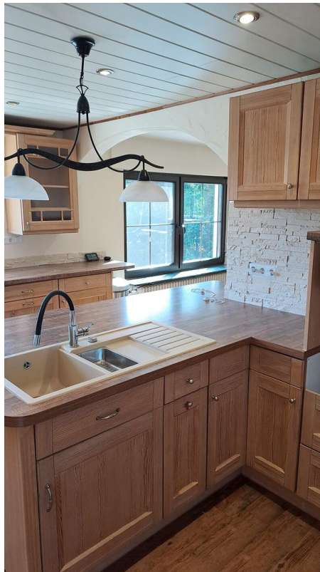
1. Etage - Küche