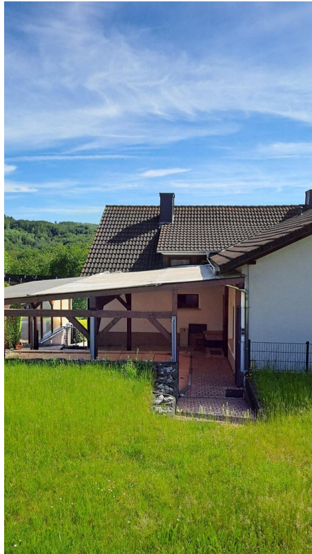
Blick auf Rückseite vom Garten