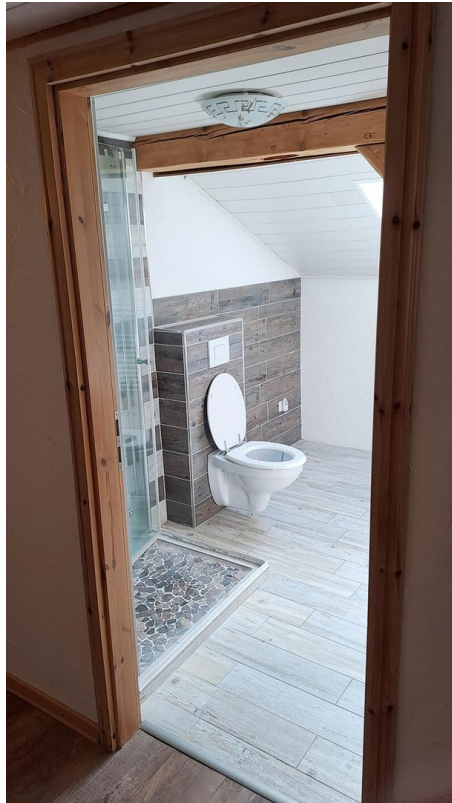
2. Etasche Duschbadezimmer