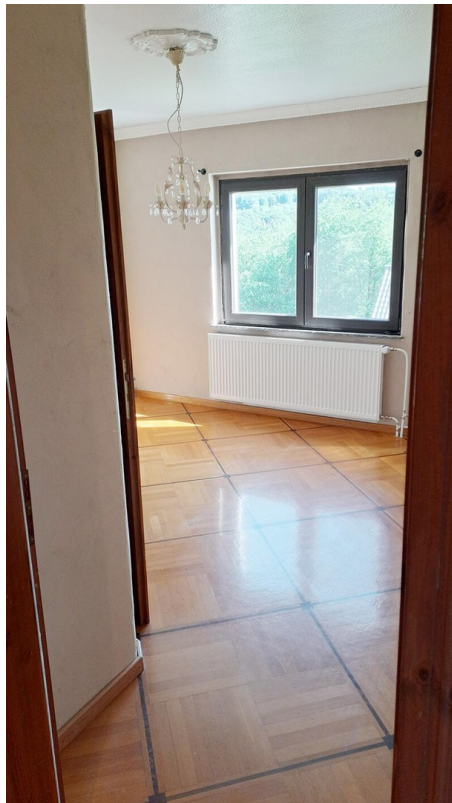
1. Etage Zimmer mit Bad