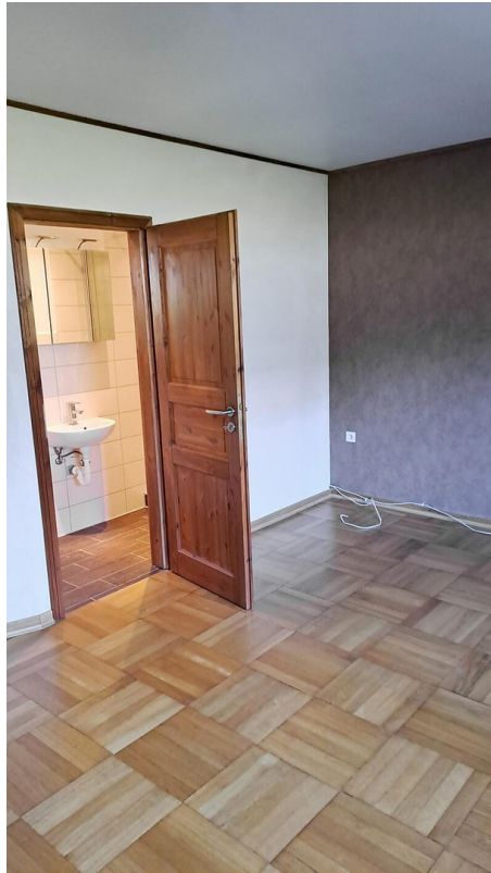
1. Etage Zimmer mit Bad