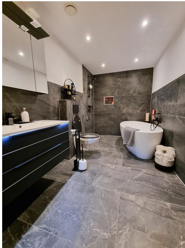
1. Etage - Bad mit Wanne