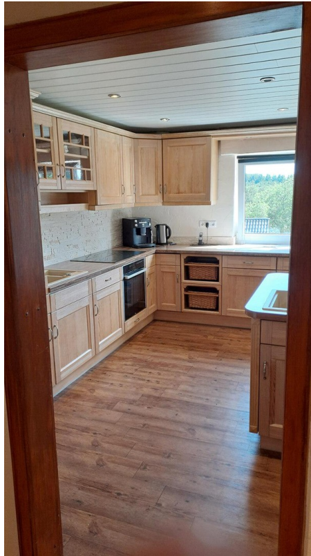
1. Etage - Küche