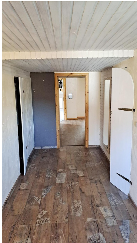
2. Etage Flur