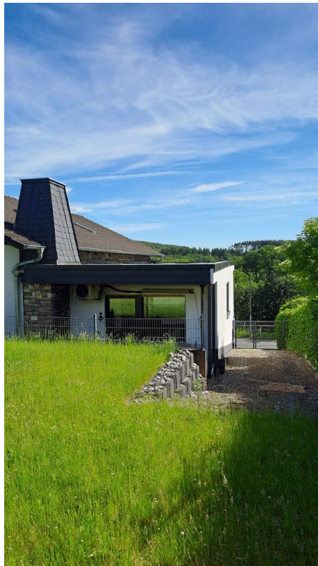
Blick auf Rückseite aus Garten