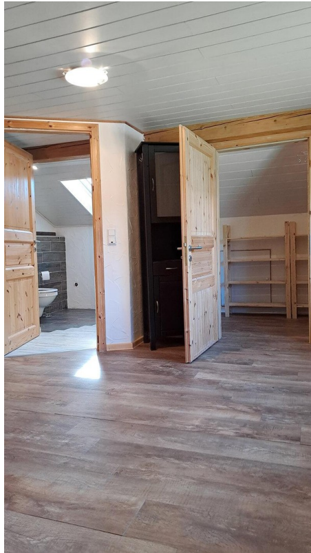
2. Etage Zimmer mit Bad