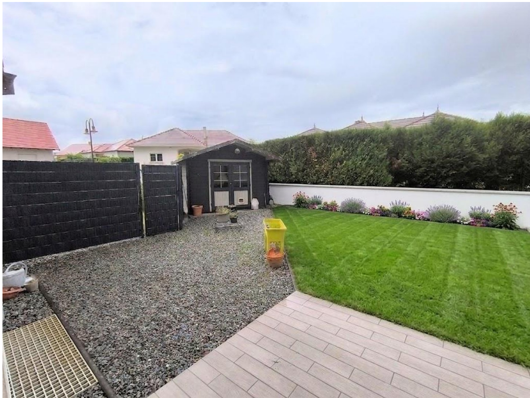
Garten mit Gartenhaus