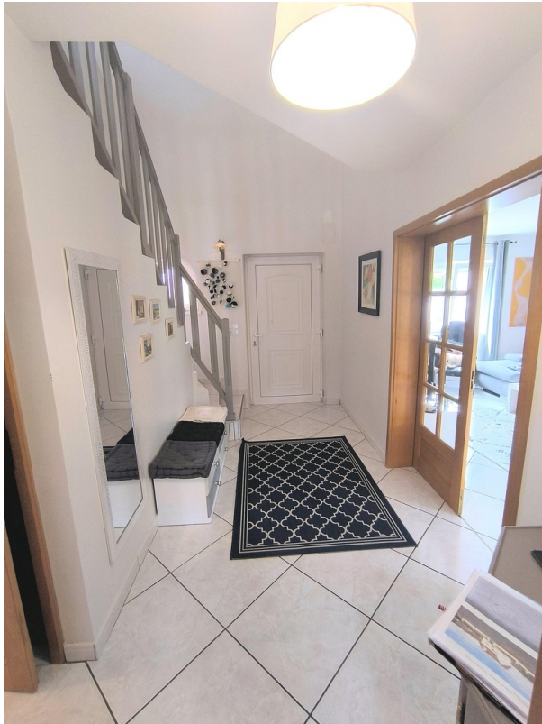
Eingang / Flur