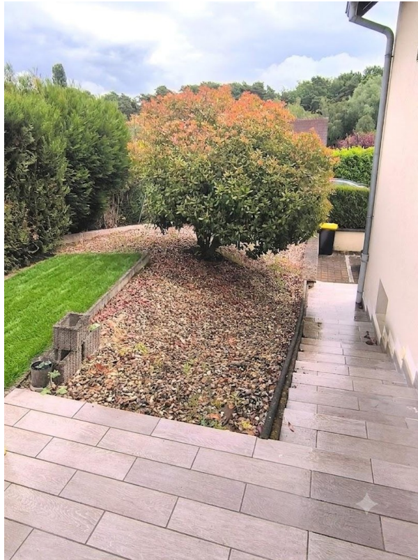
Hinter dem Haus