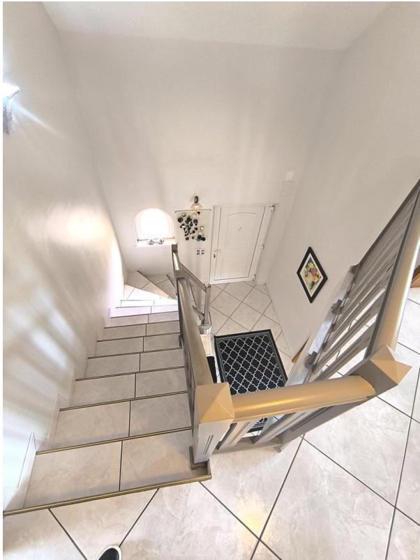
Treppe zum OG