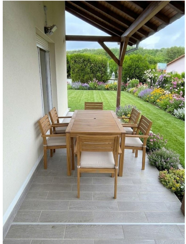
Terrasse - Garten