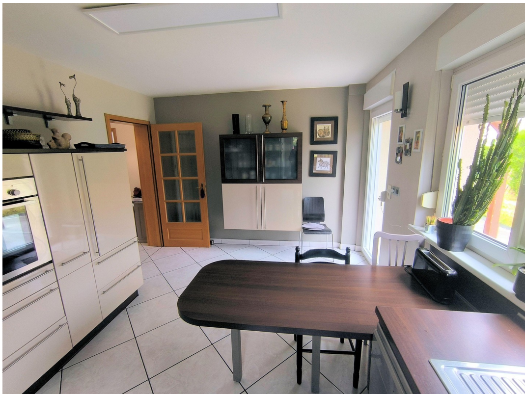
Küche - Essbereich