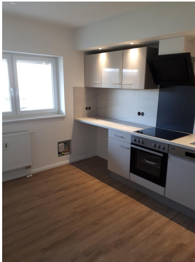
Küche linke Seite