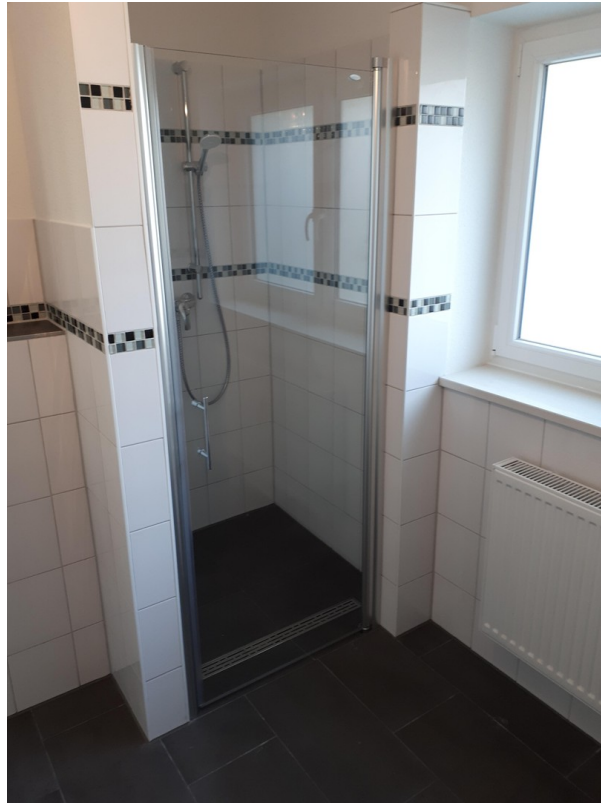
großes Bad mit Fenster