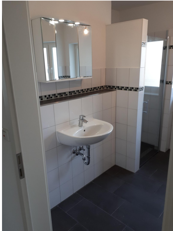
großes Bad - neuer Waschtisch