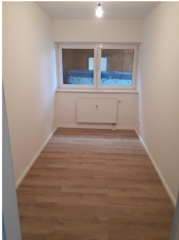
halbes Zimmer zum Carport hin