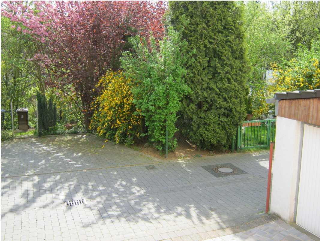
Ausblick zum Parkplatz