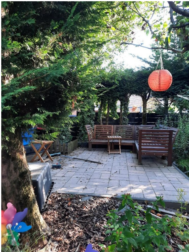
Sitzplatz am Haus