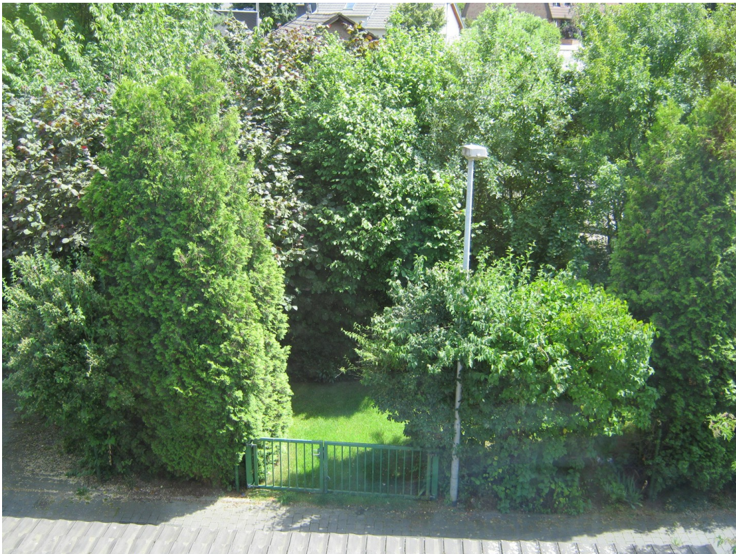
Ausblick zum Garten