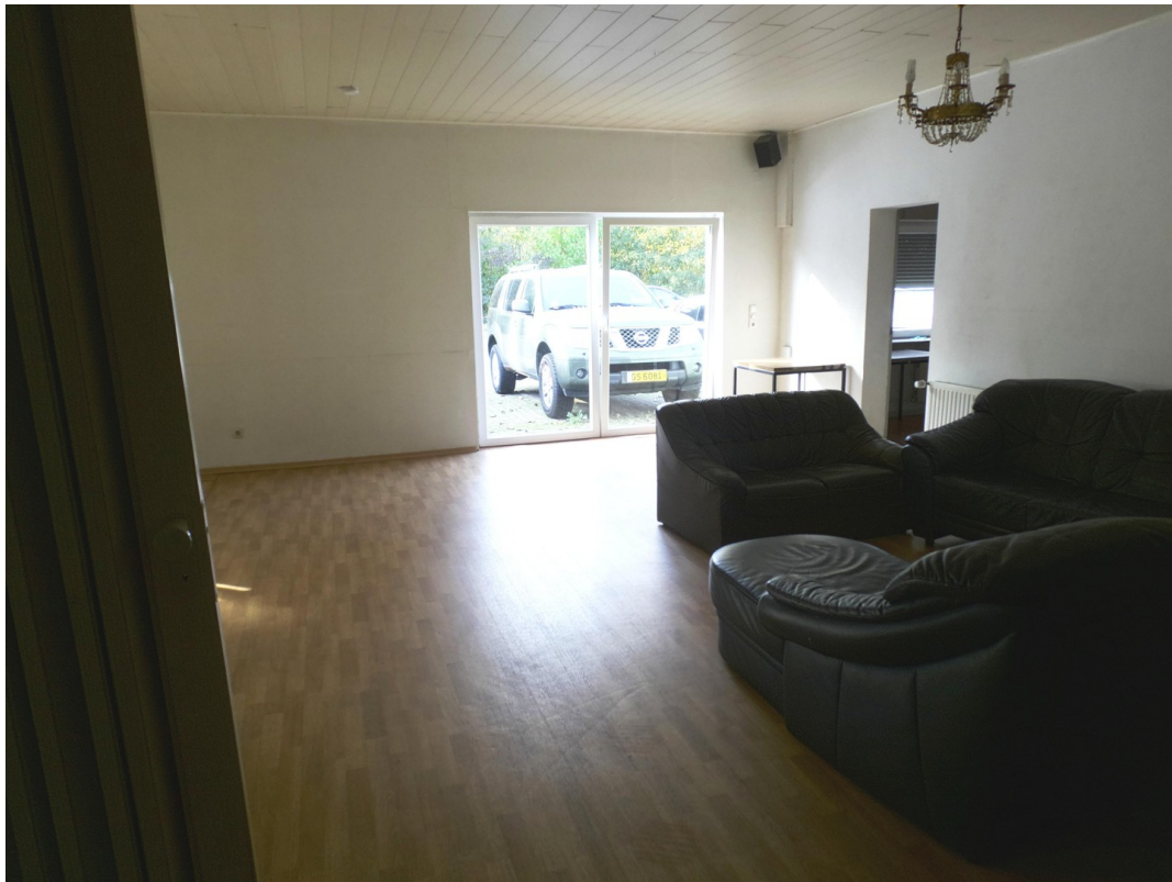
Haupt Raum 60 m 2