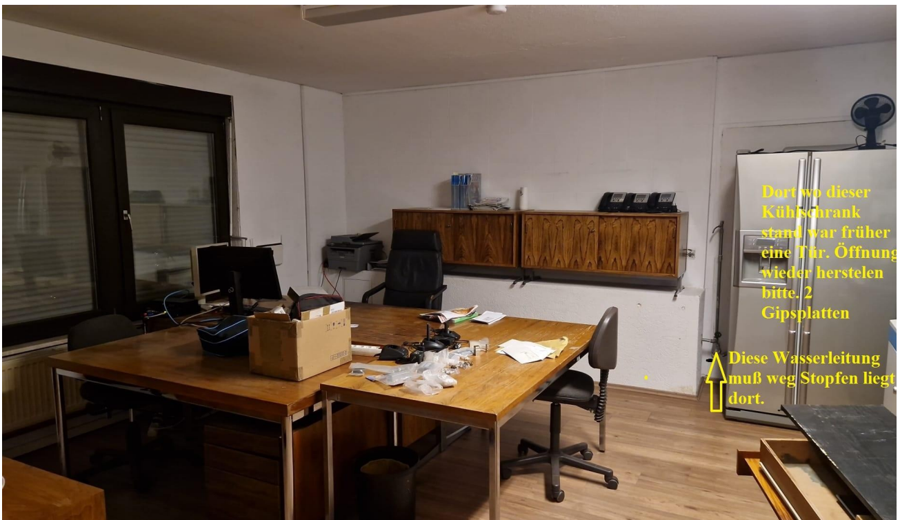
Haupt Büro a