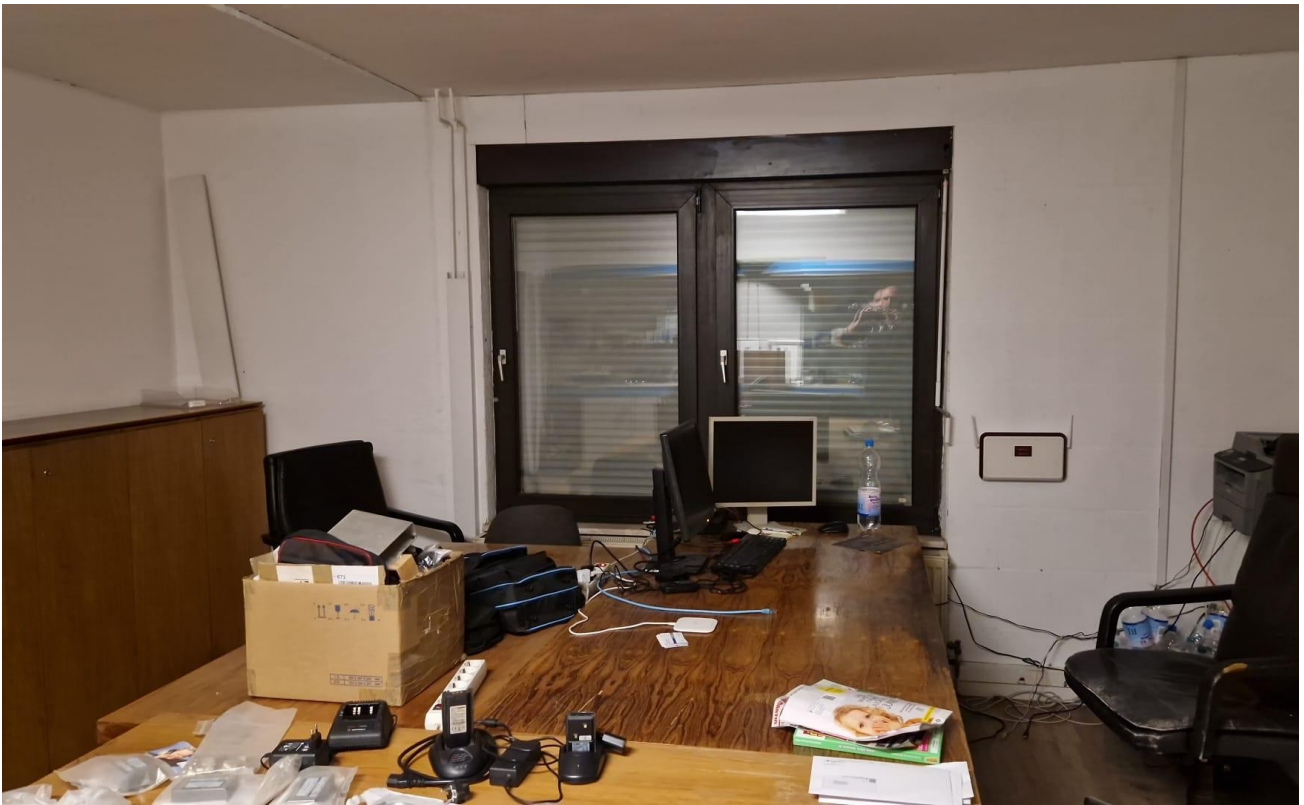
Haupt Büro b