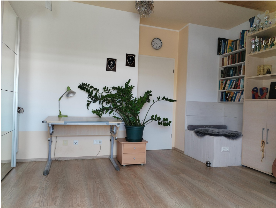
DG Zimmer 4 - 15 qm