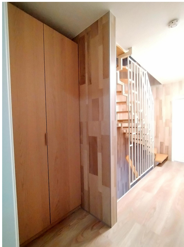
OG Nischenschrank und Flur