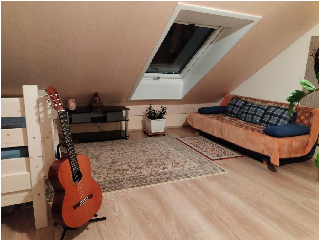
DG Zimmer 4