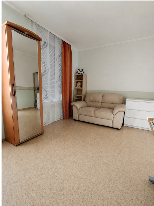
OG Zimmer 1 - 14,7 qm