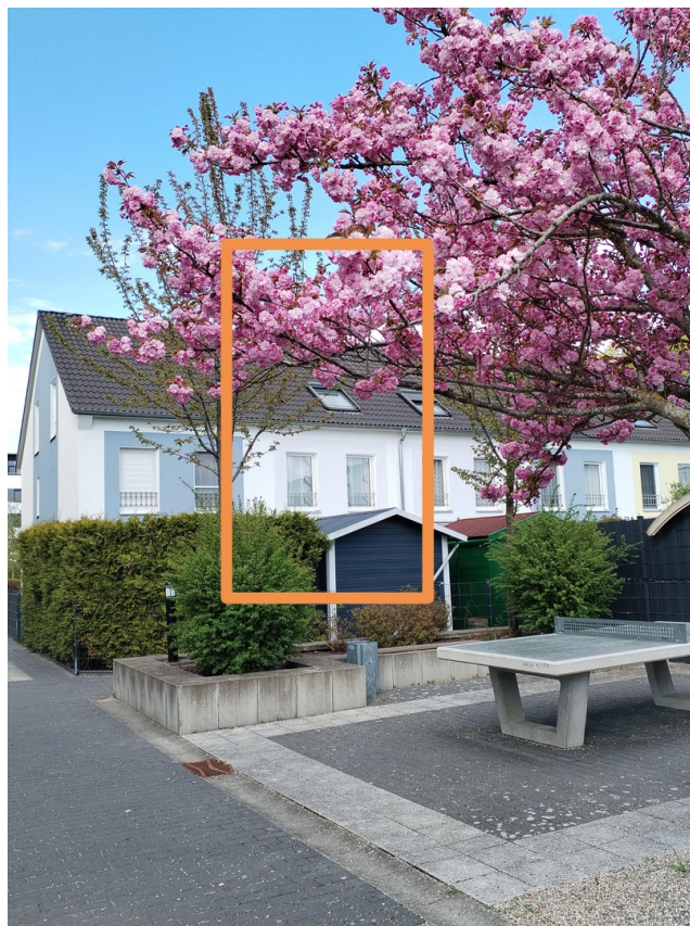
Blick vom Innenhof