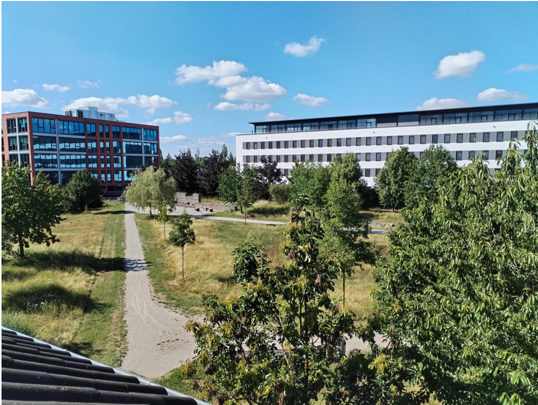
Blick vom Zimmer 4 aus