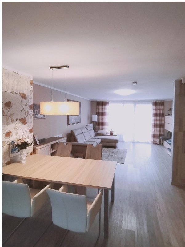
Wohn-/Essbereich - 35,4 qm