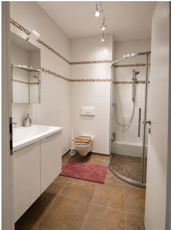
Bad DG - 4,4 qm