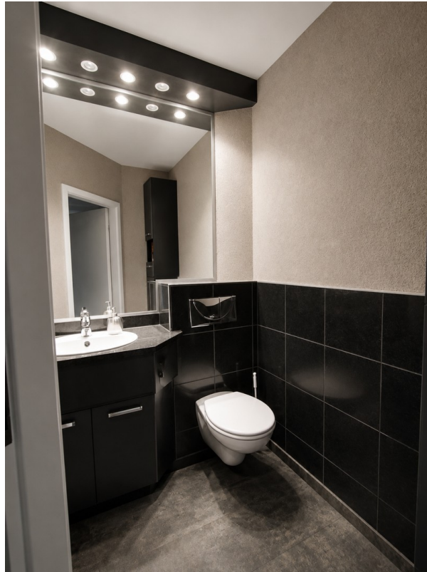
Gäste WC - 2 qm