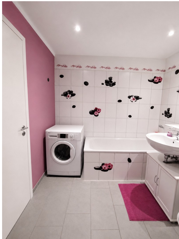
OG Bad - 7,6 qm