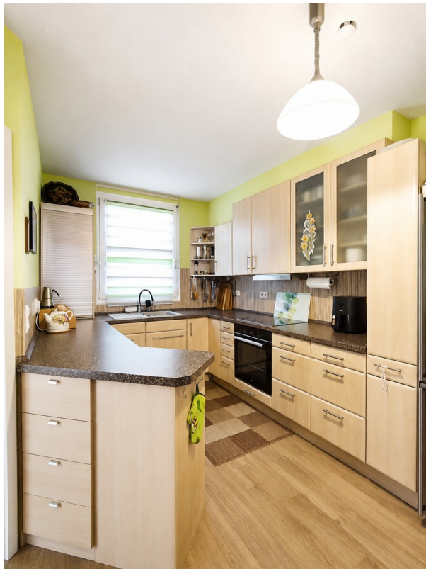
Küche - 8 qm