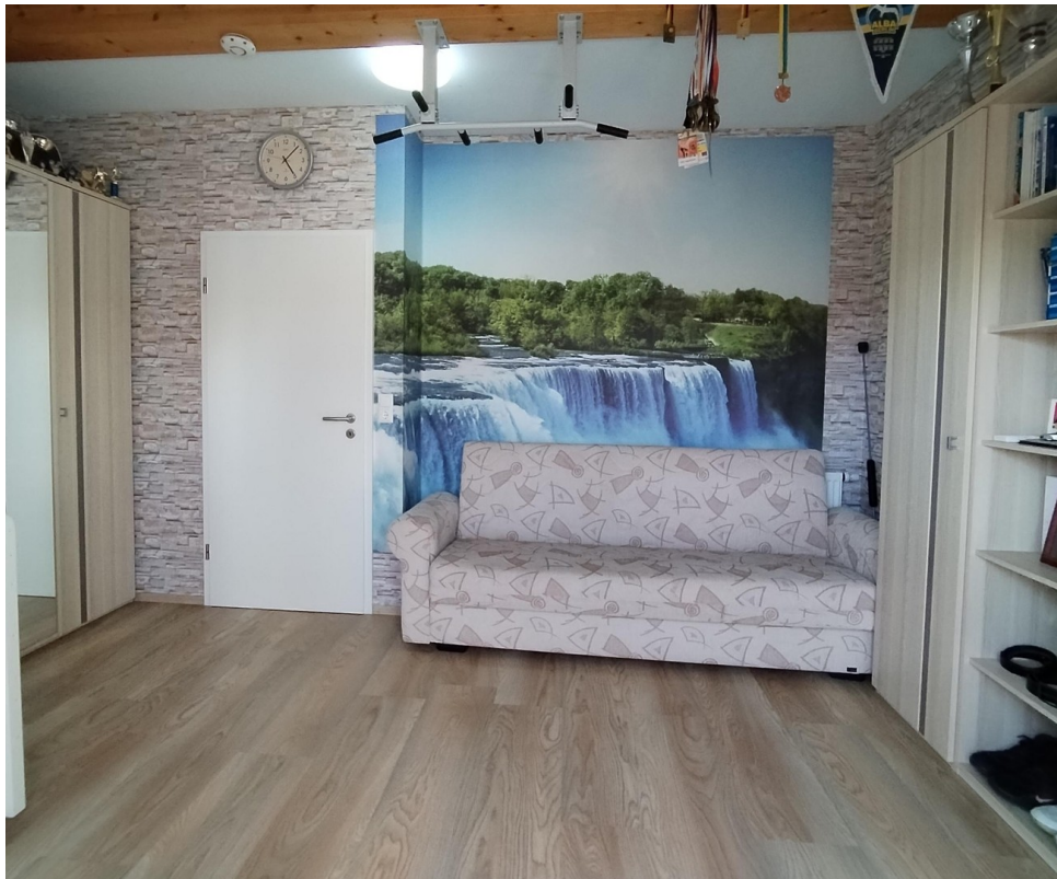
DG Zimmer 3 - 14,6 qm