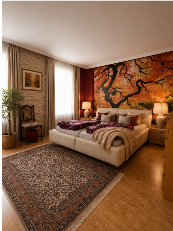
OG Zimmer 2 - 17,5 qm