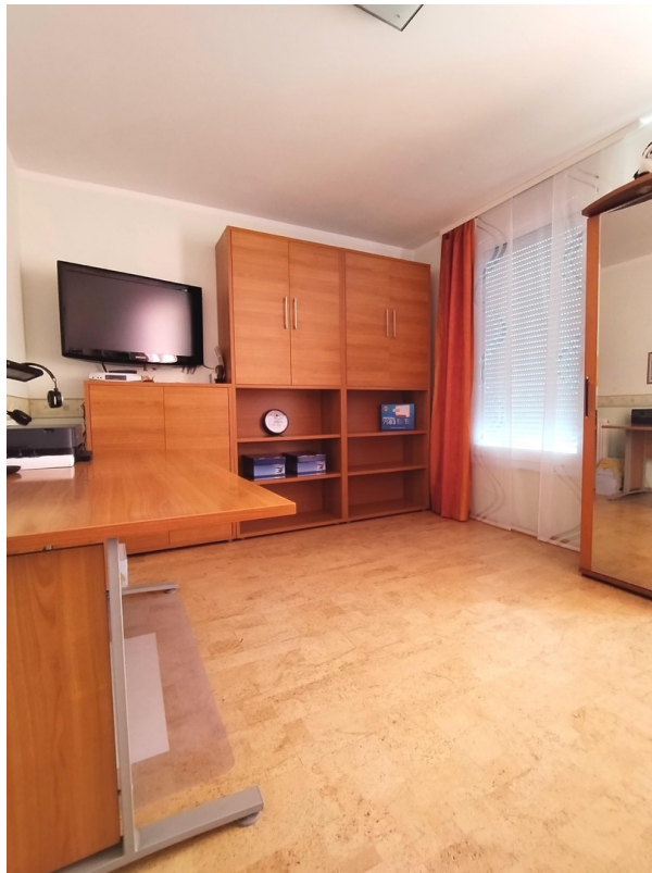
OG Zimmer 1 (Arbeitszimmer)