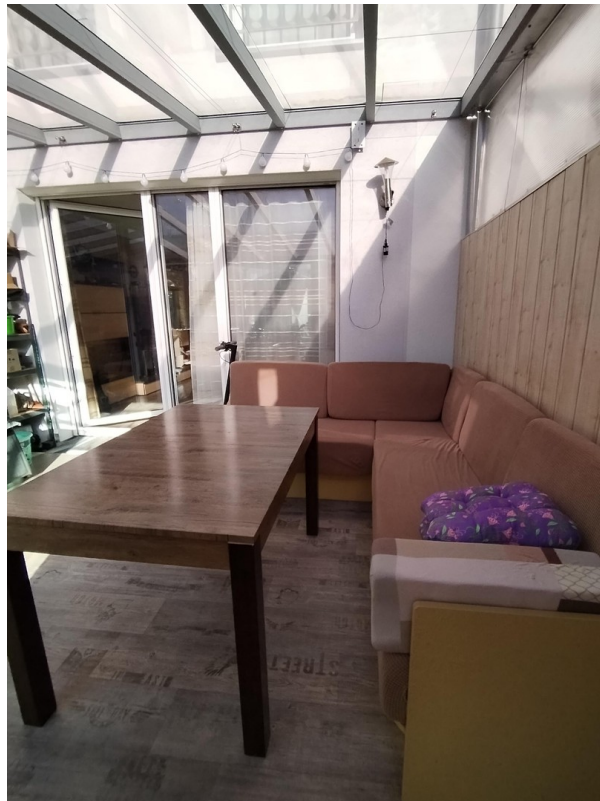
Wintergarten - 20 qm