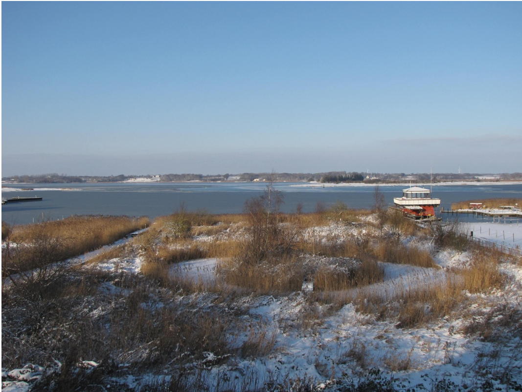
Winterimpression vom Balkon