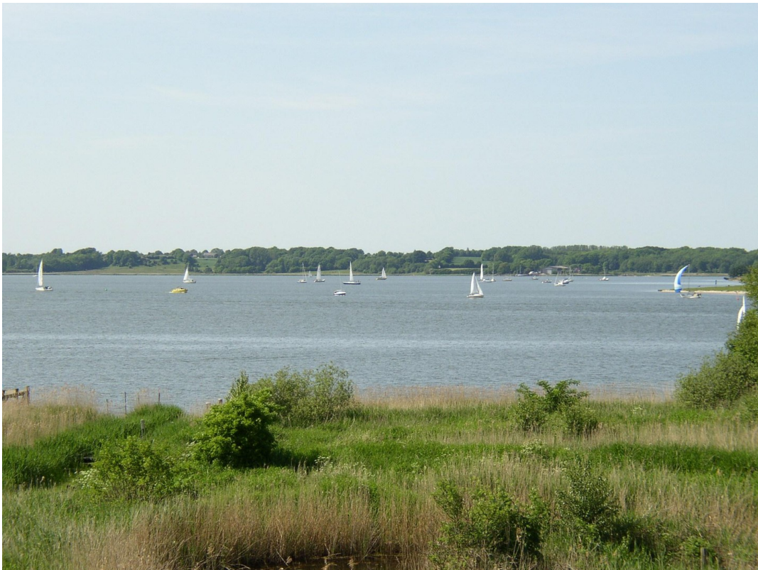
Sommerblick vom Balkon