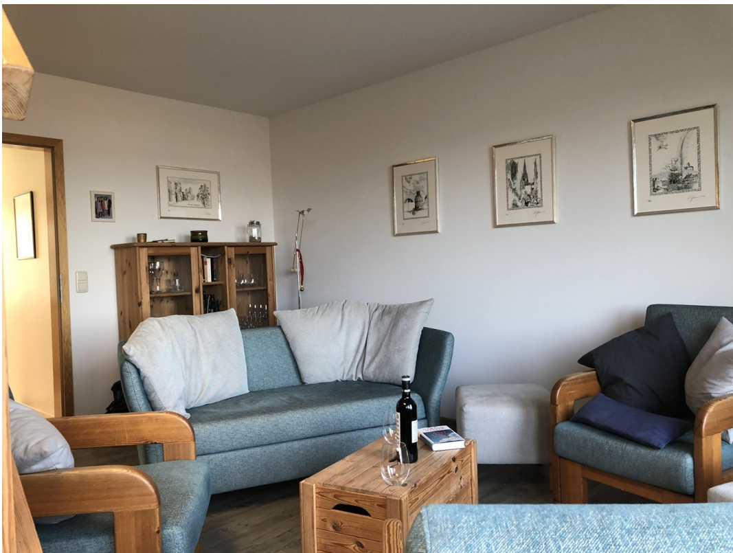
Sofa im Wohnraum