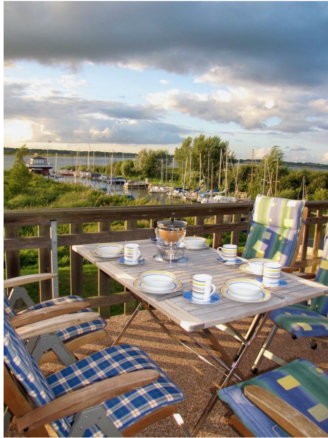
Bereit für Genießer*innen