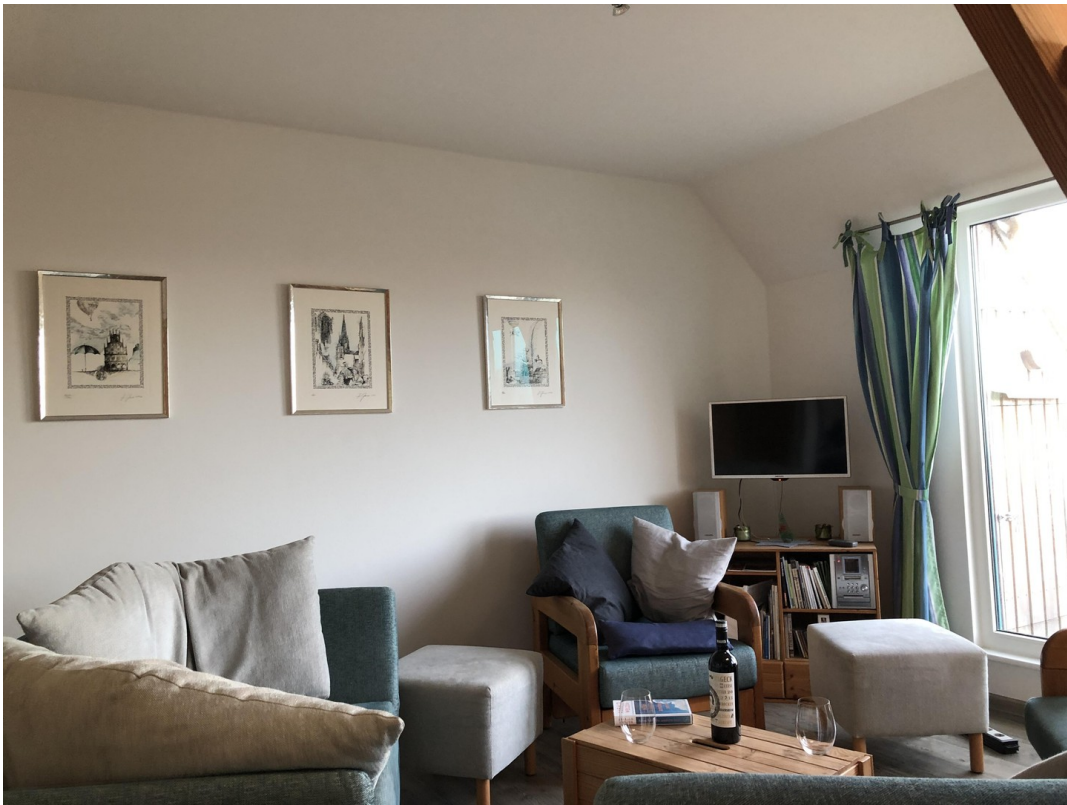
Sitzecke im Wohnraum