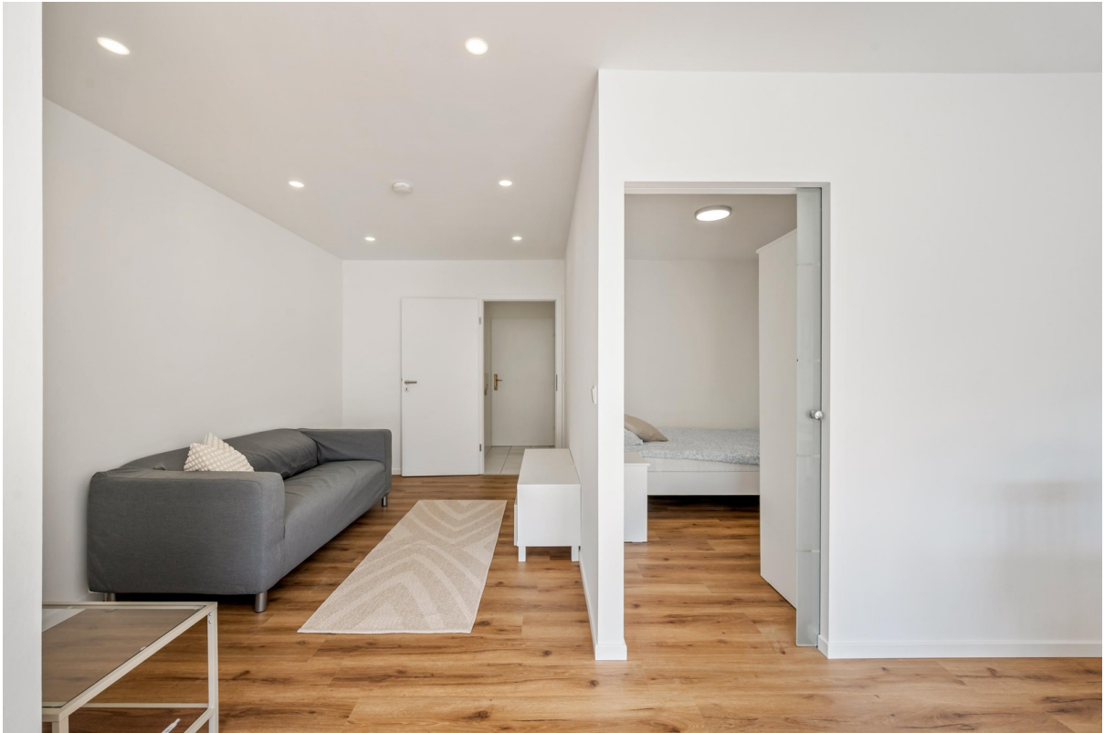
Wohn- und Schlafzimmer