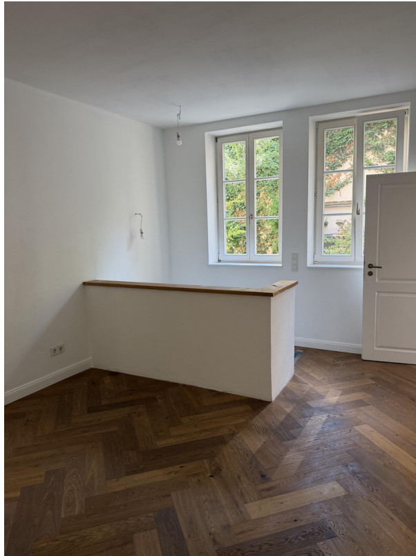
Erdgeschoss / Schlafzimmer