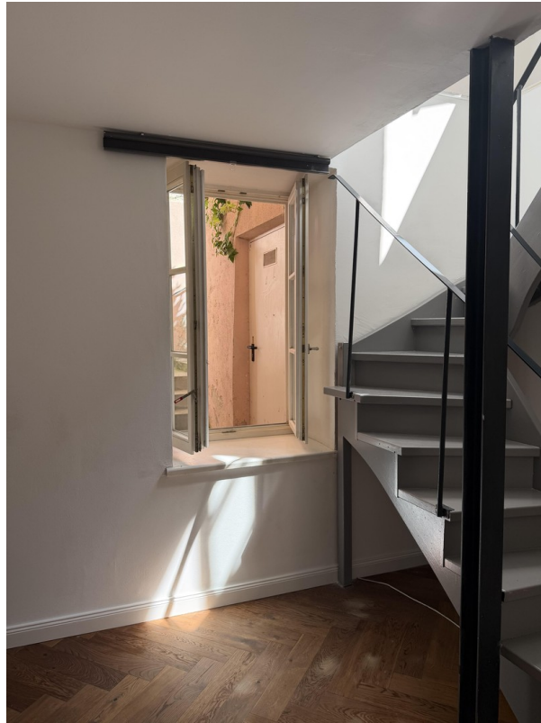
Treppe & Fenster Untergeschoss