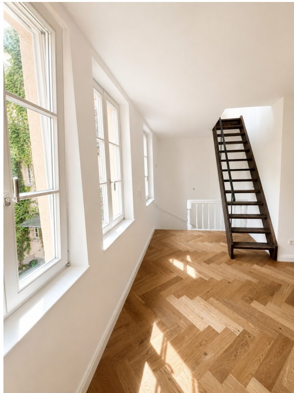
Blick Treppenhaus Küche