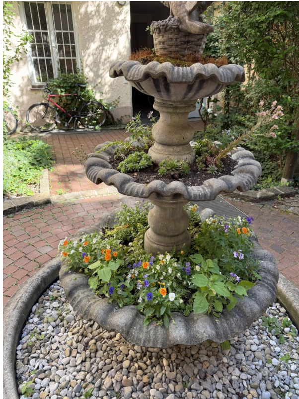
Begrünter Brunnen im Innenhof