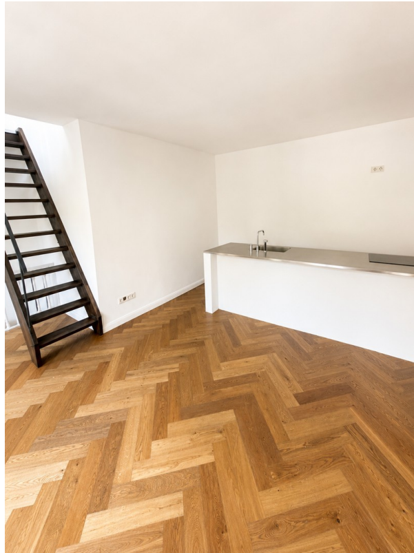
Wohnbereich mit offener Küche