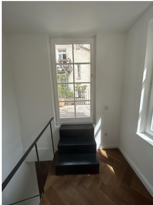
Blick auf Terrasse