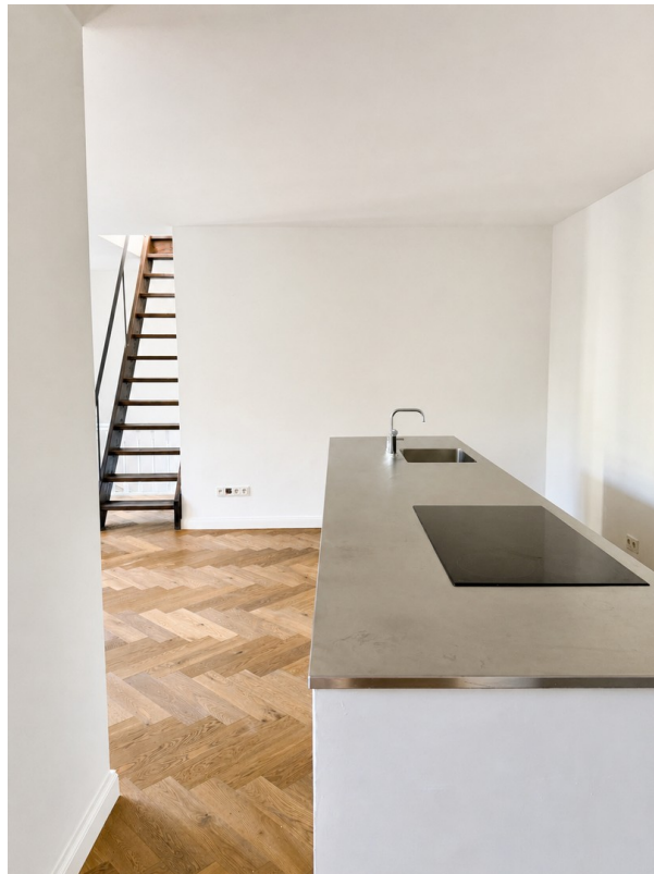
Wohn / Essbereich