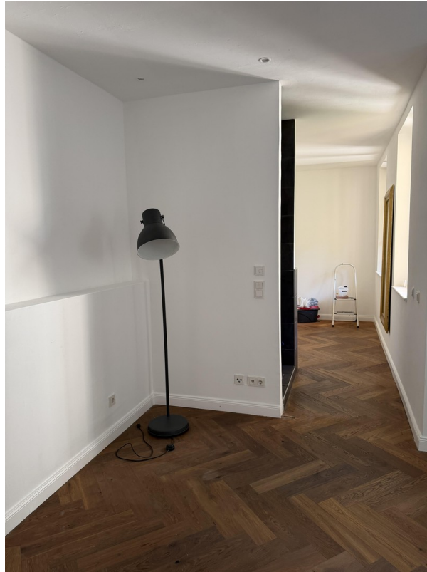
Blick ins Badezimmer