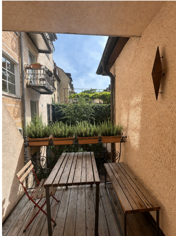
Balkon mit Blick in den Süden