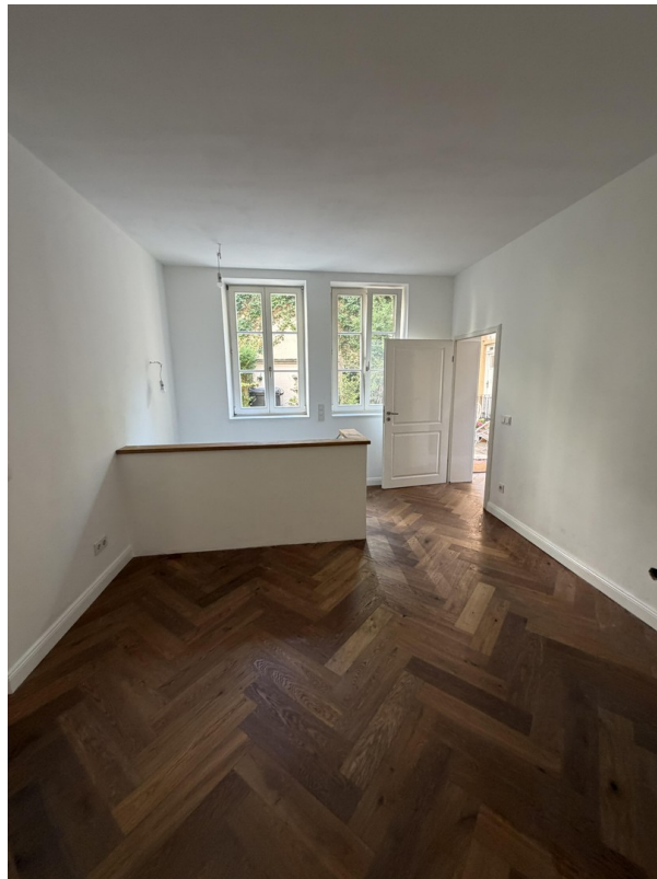
Erdgeschoss / Schlafzimmer