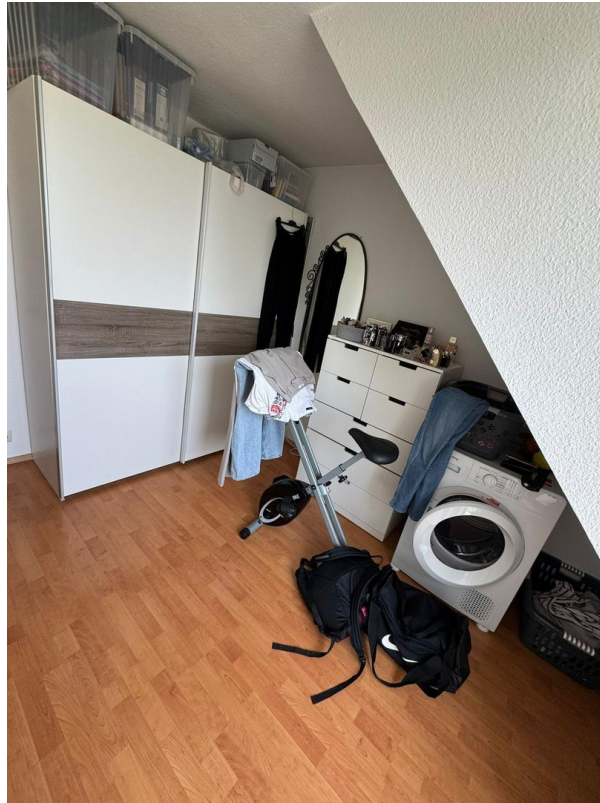
Weiteres Zimmer 2