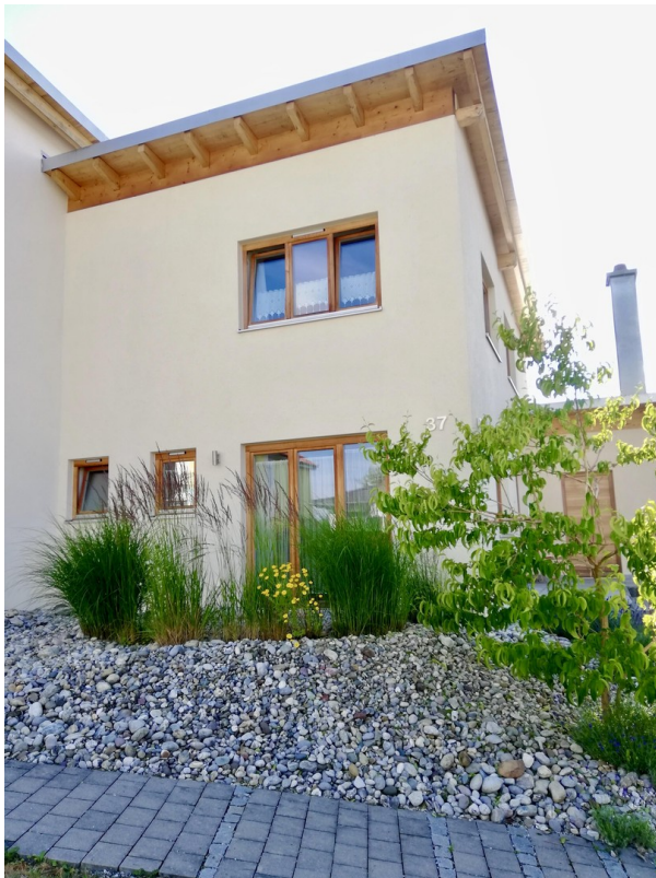
Terrasse Ost (Küche)