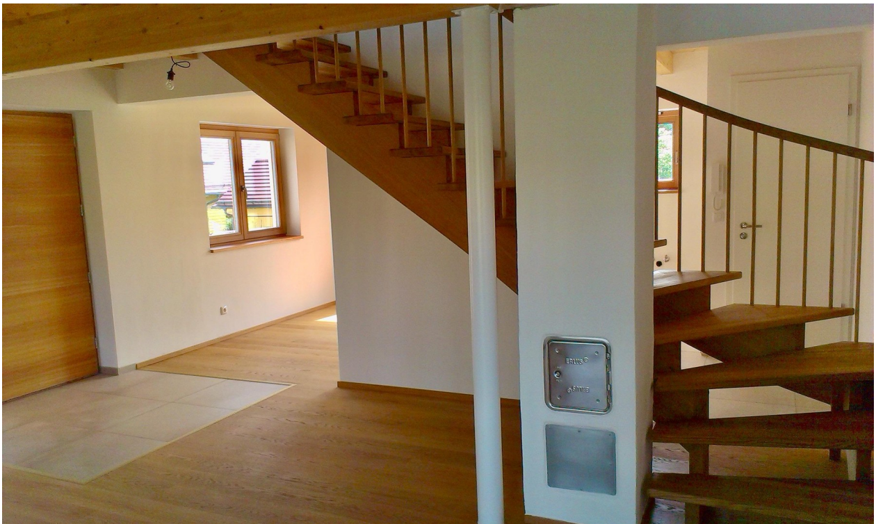
offener Innenbereich unmöbliert