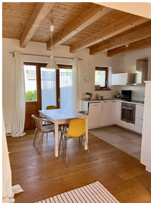
links Essbereich, Küche