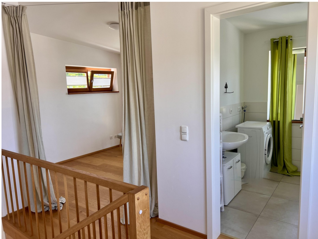
Galerie / Eingang Bad