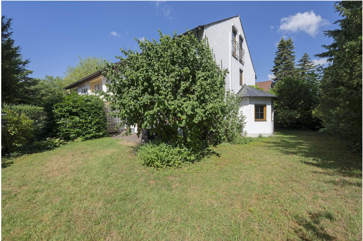
Ansicht Haus mit Erker