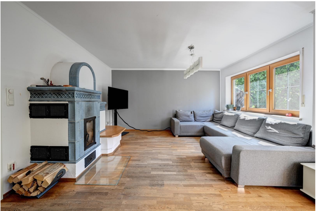
Wohnzimmer mit Kachelofen