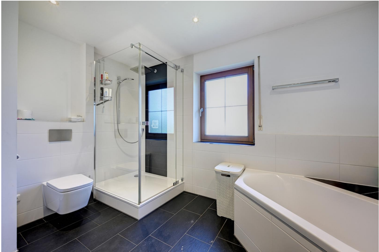
Bad mit Blick auf Dusche