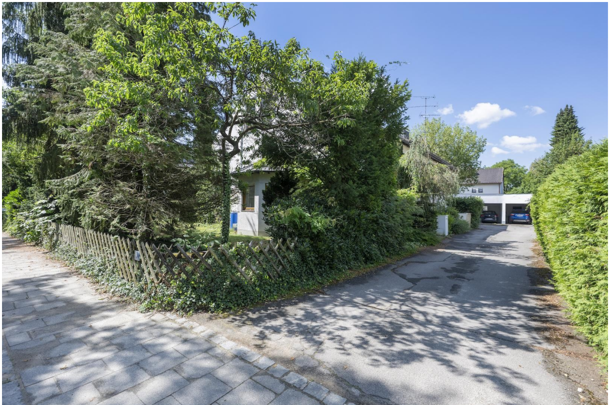
Blick auf Garagenhof