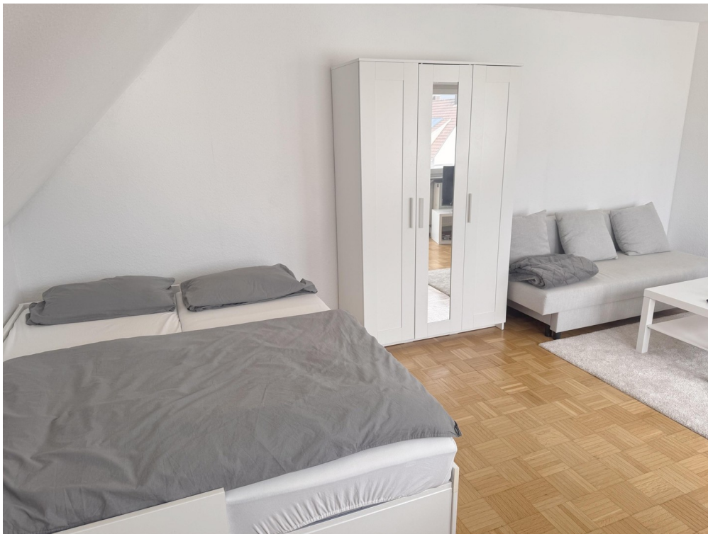
Möbel können abgekauft werden