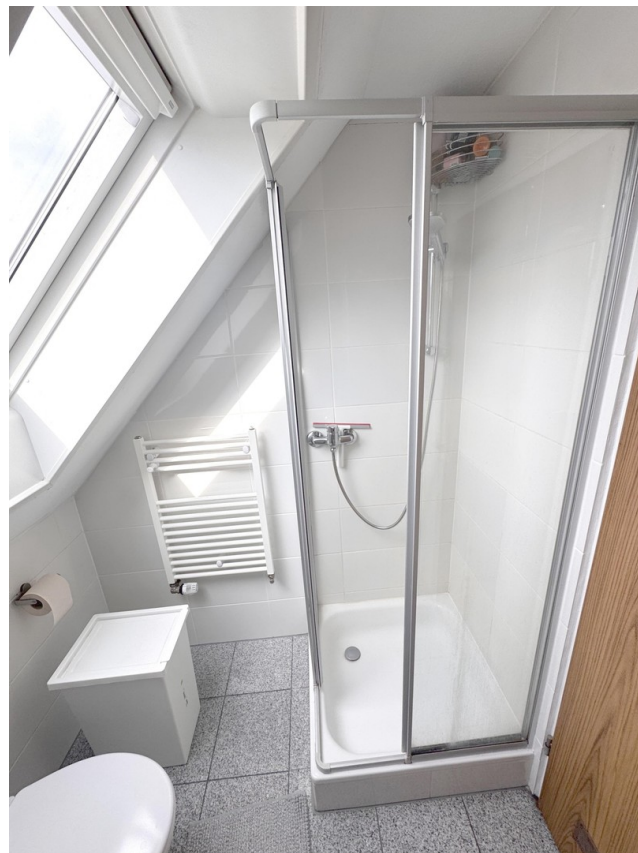
Tageslicht Bad mit Dusche