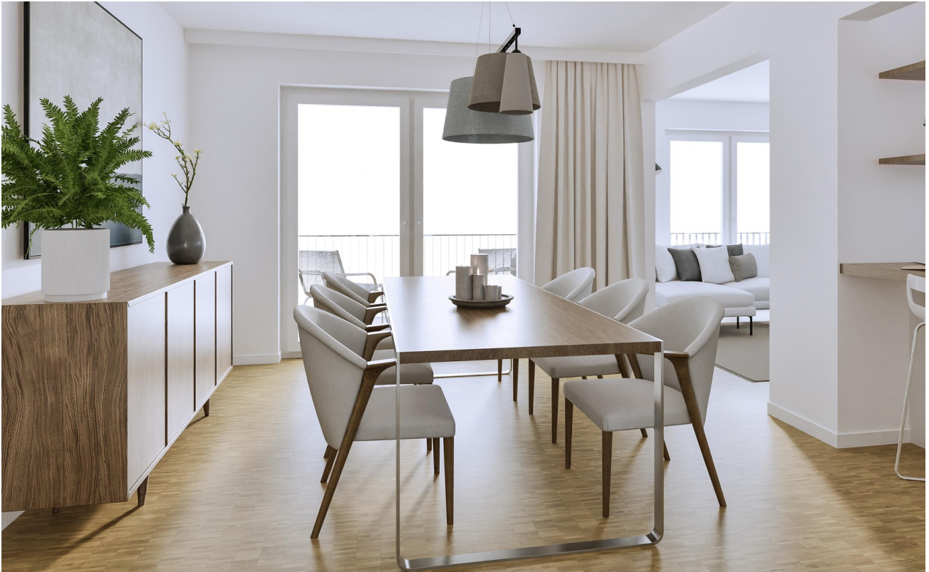
Große Küche/ Esszimmer