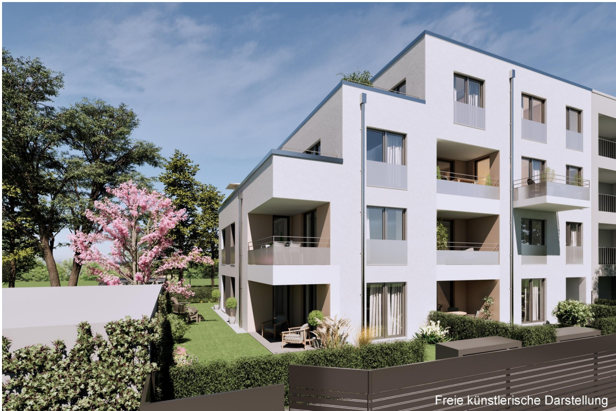
Freie künstlerische Darstellung