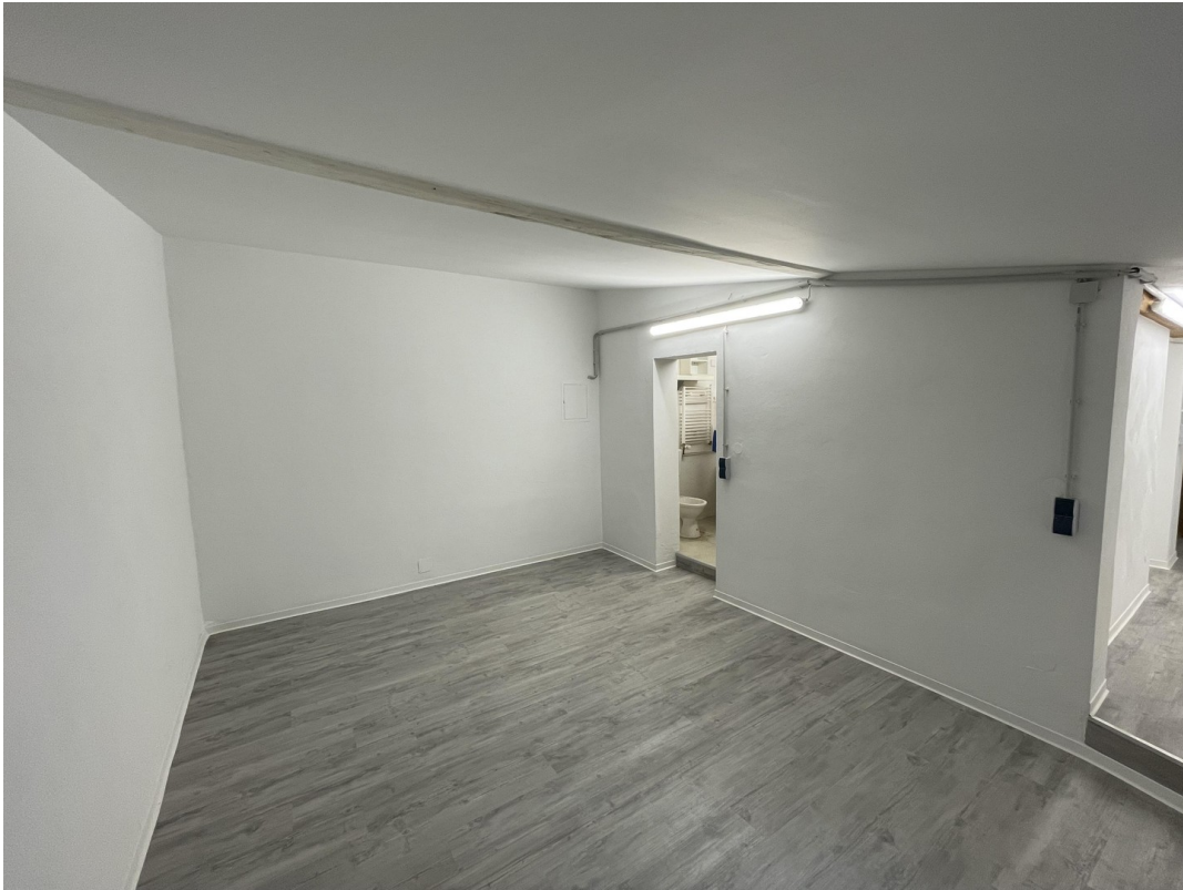
1. OG - Nebenraum