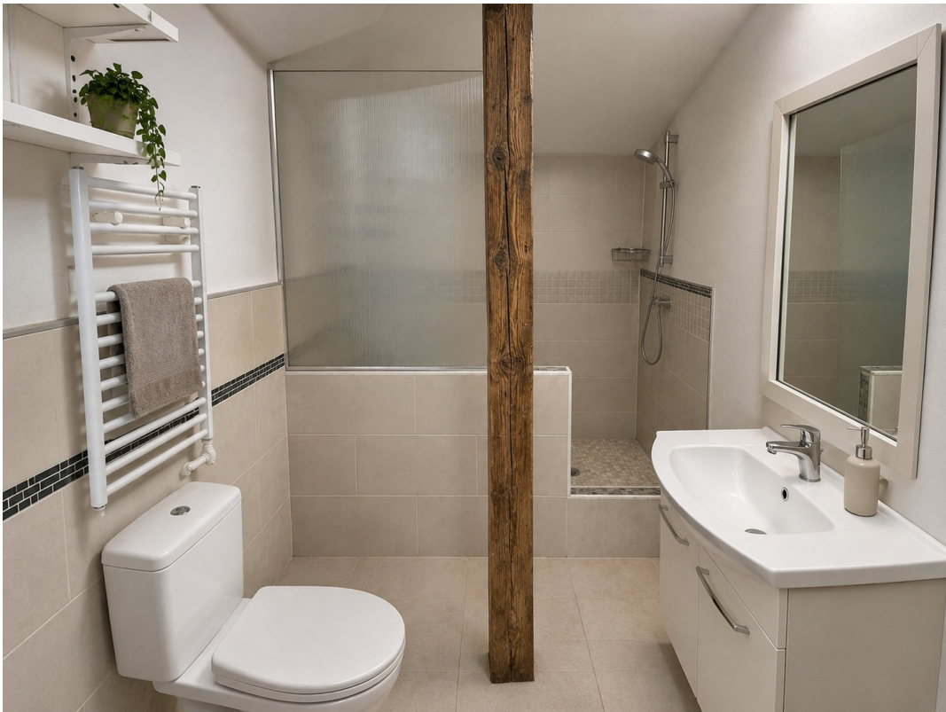
Bad - nach Renov. (Animation)