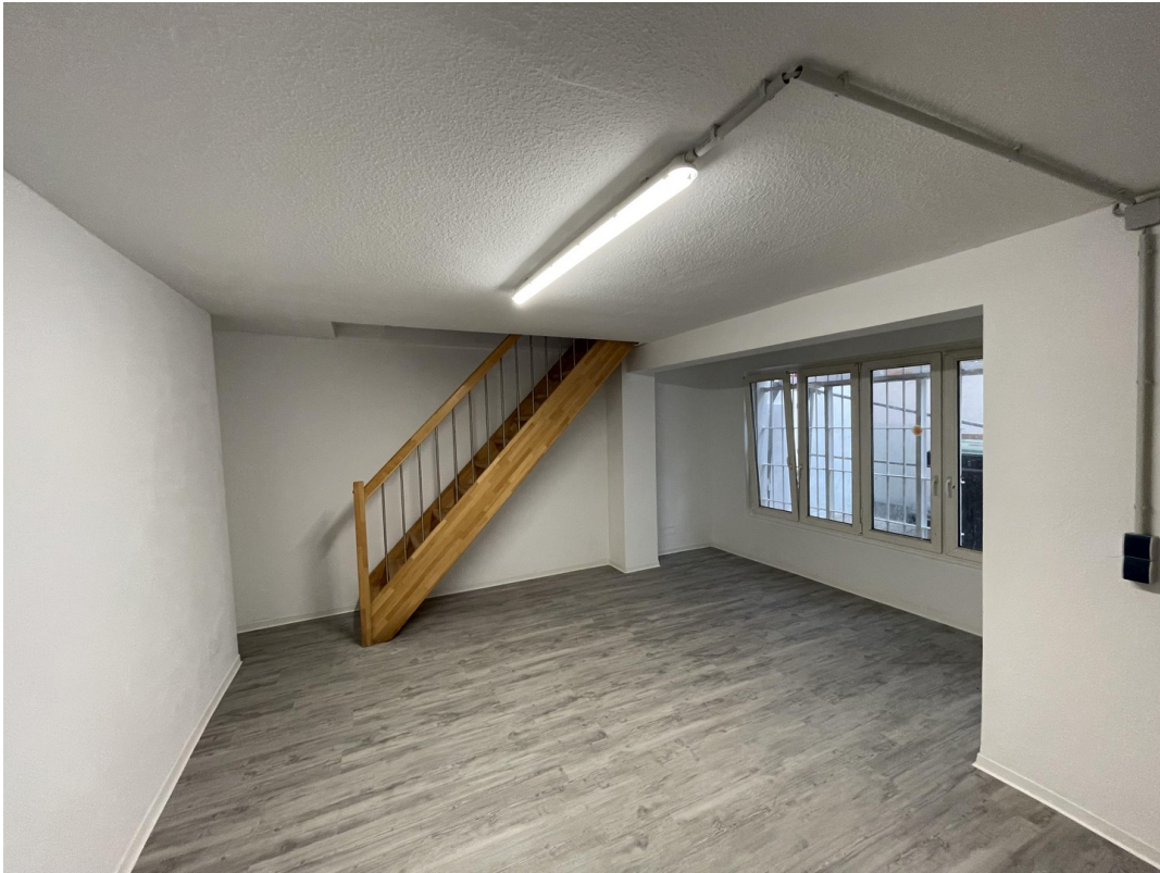
EG - Hauptraum