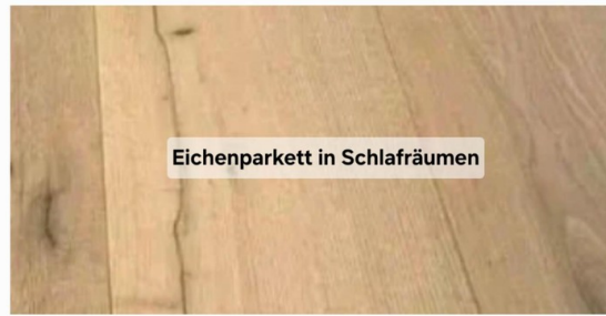
Eichenparkett in Schlafräumen