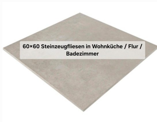
60×60 Steinzeugfliesen in Wohnküche / Flur / Badezimmer