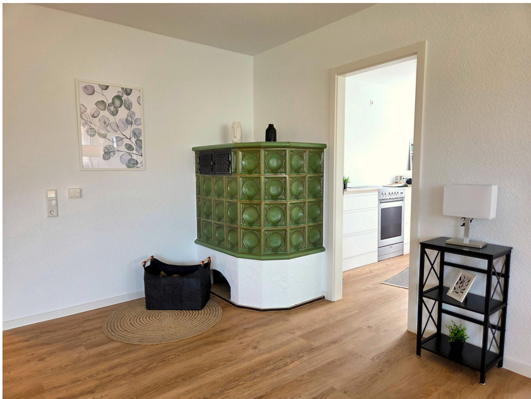
Kamin im Wohn- / Esszimmer