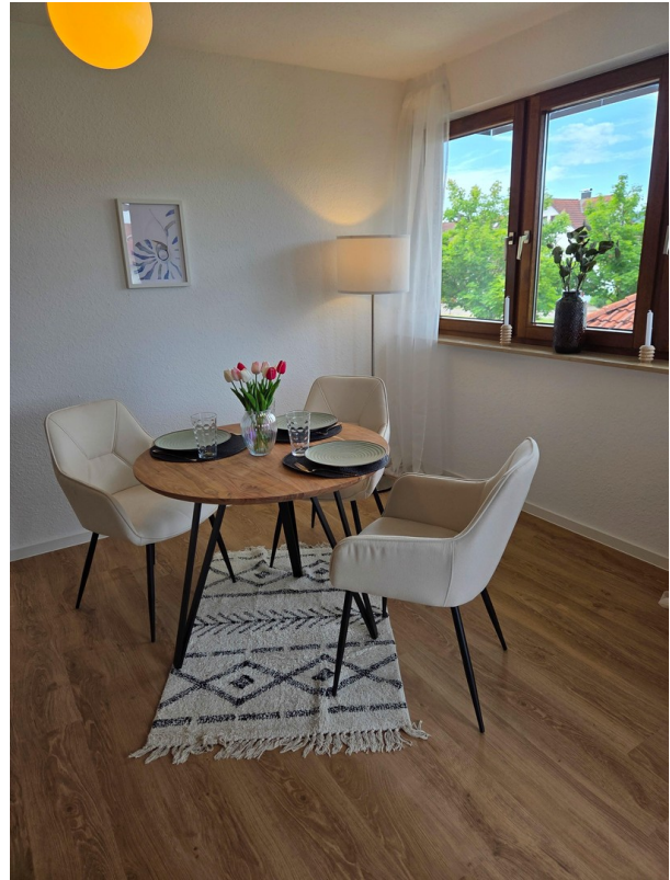
Wohn- / Esszimmer