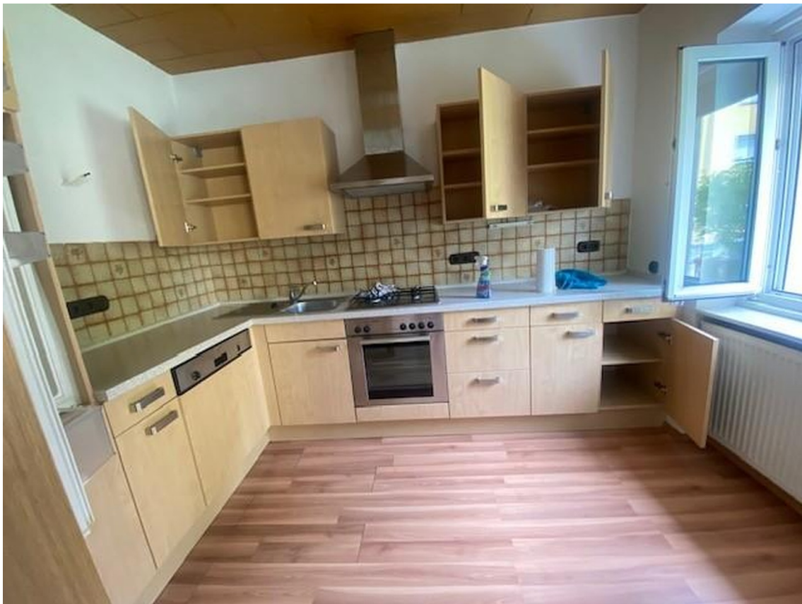
Küche mit Fenster