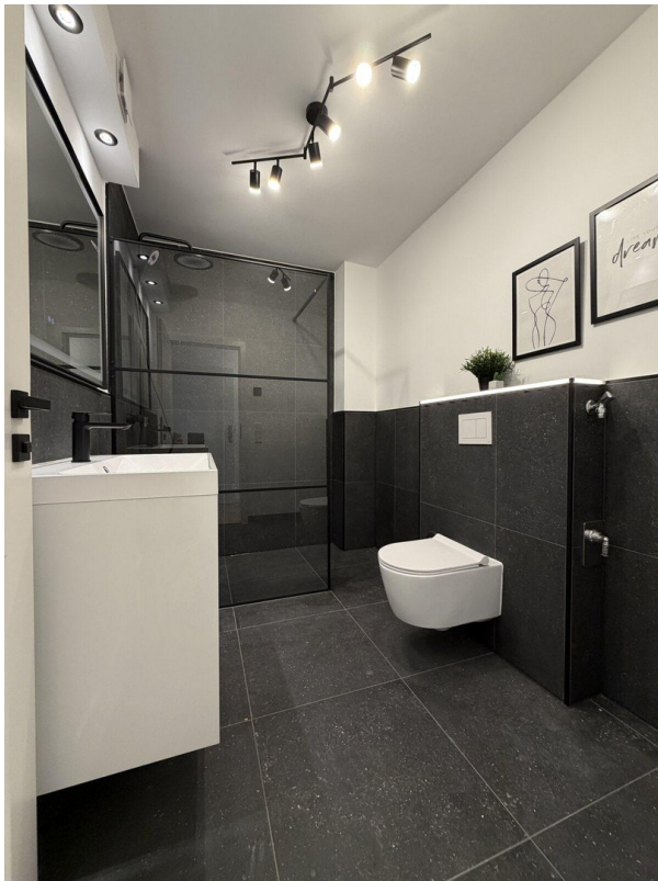
06 hochwertiges Bad