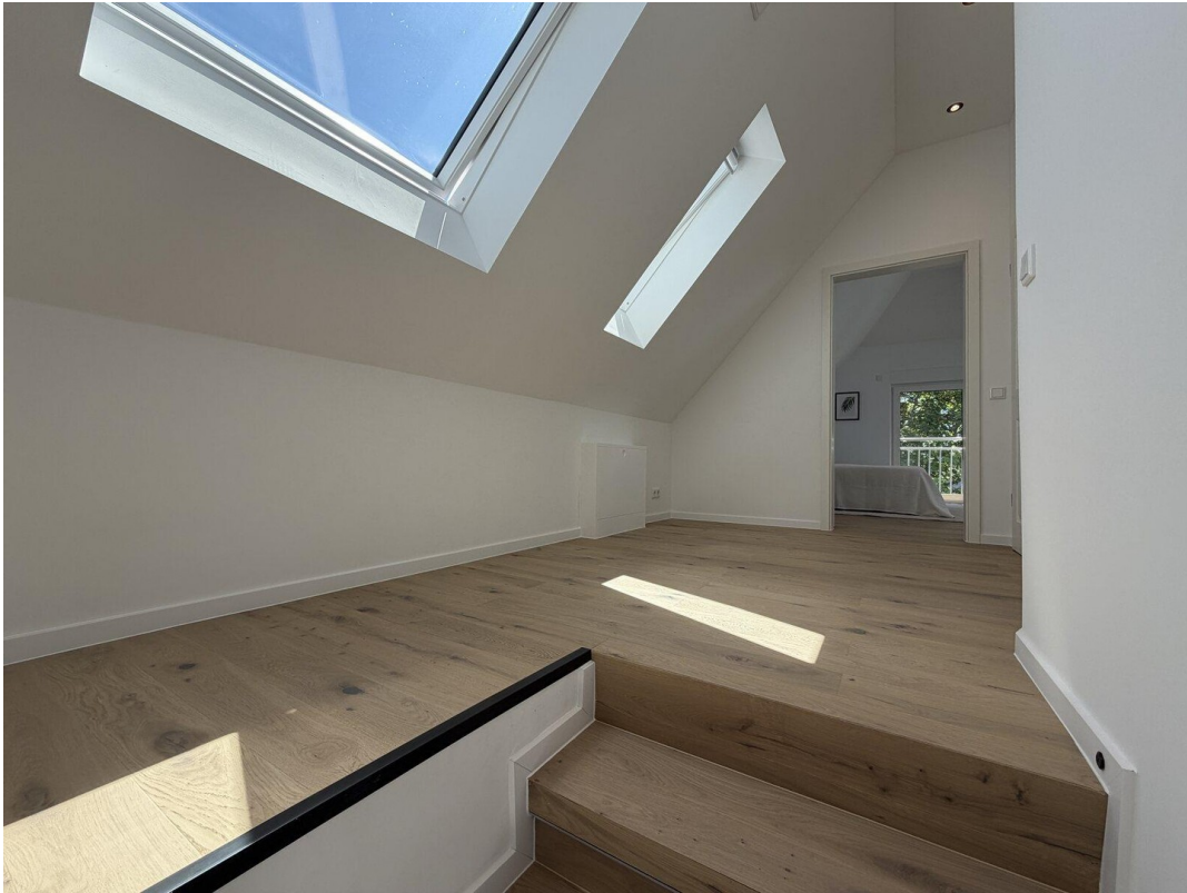
10 klimatisierte Schlafbereich