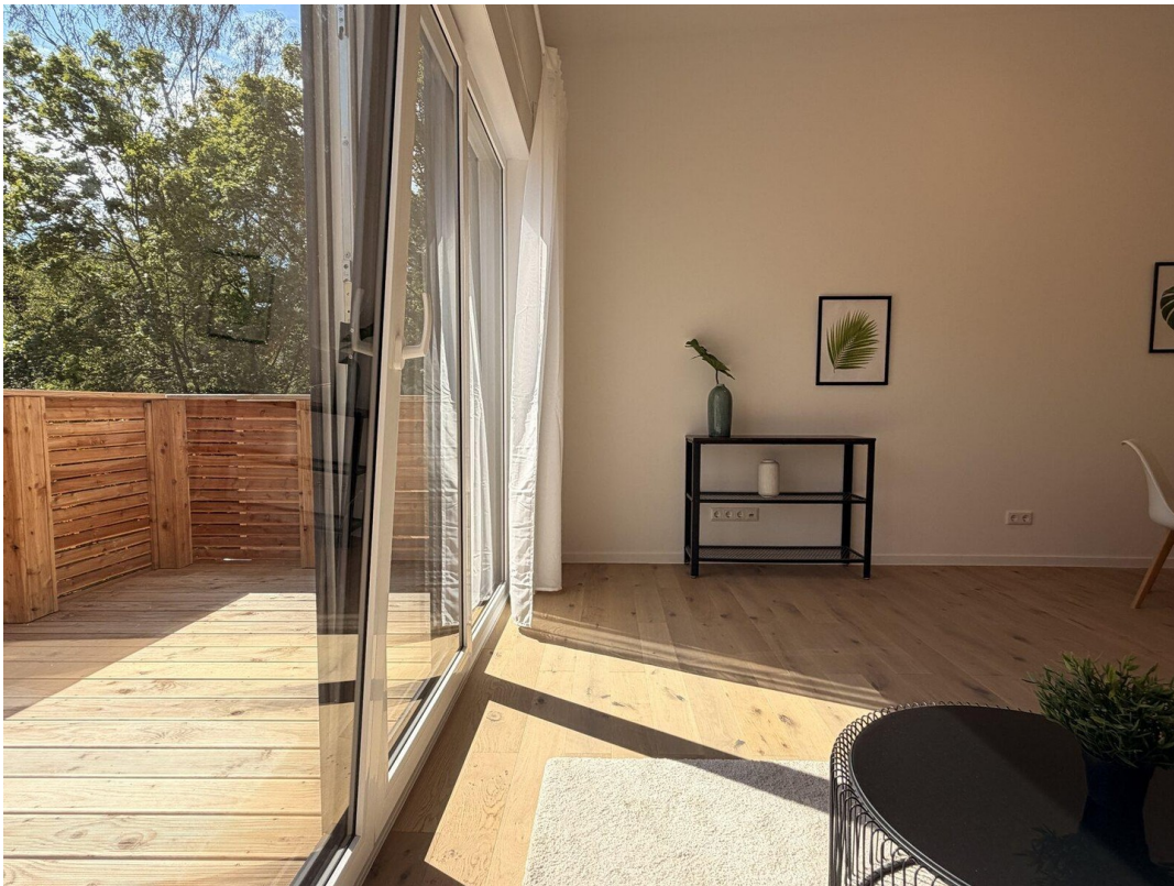
24 Wohnen mit Balkon