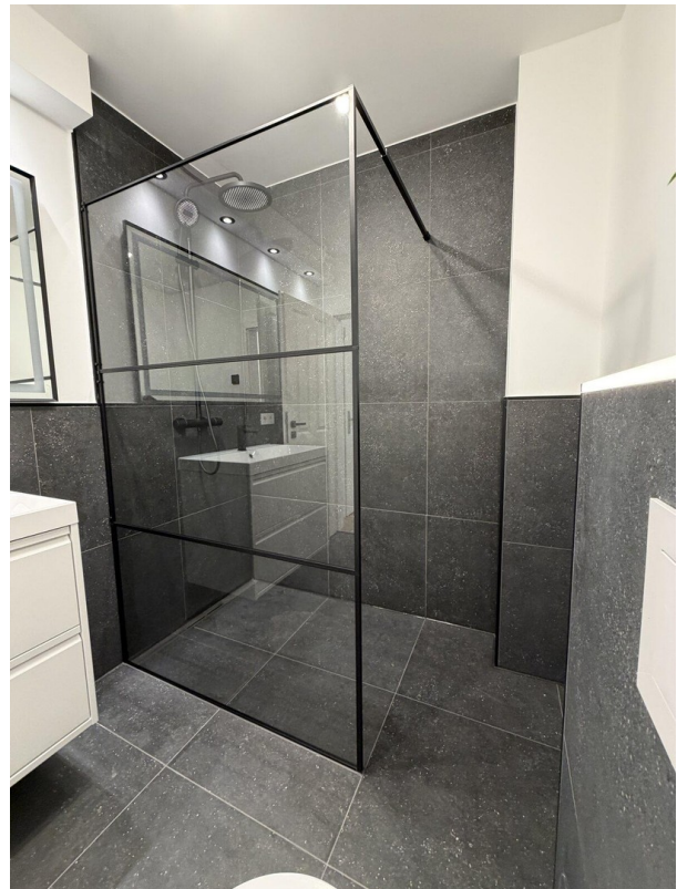
07 begehbare Dusche