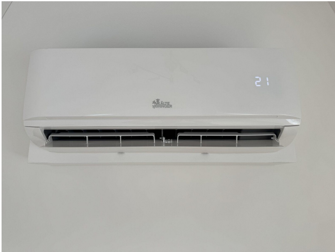
05 Klimaanlage festinstalliert