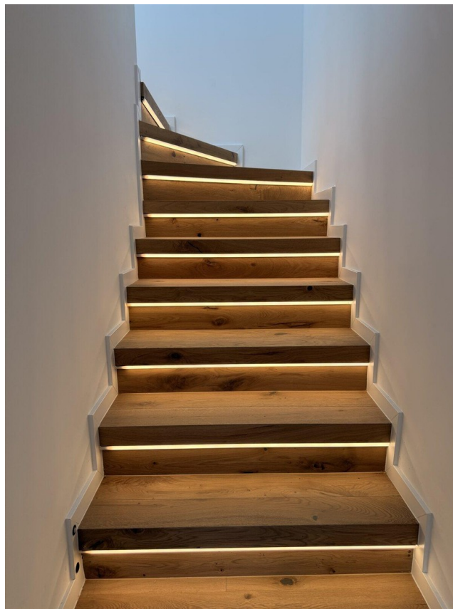
09 LED Stufe für Stufe