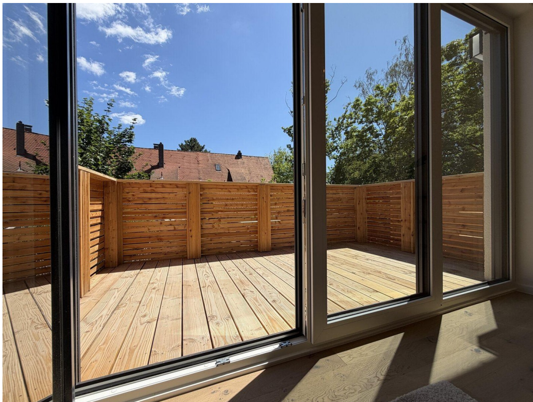
04 Ausblick Balkon