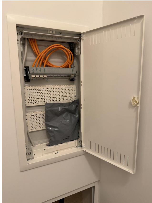
20 Multimedia Router