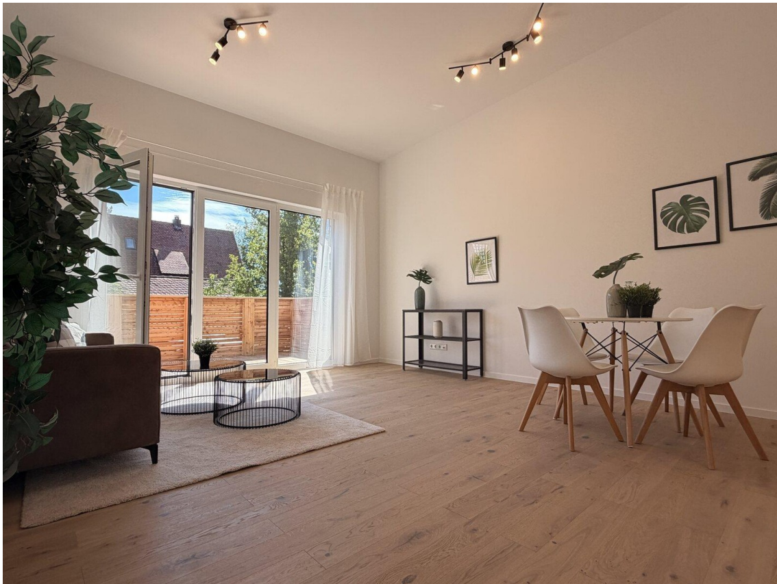
02 helles Wohnzimmer