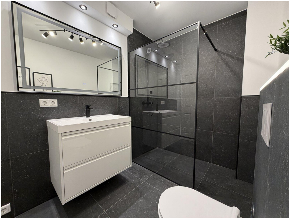
08 Waschtisch Led Spiegel Spot