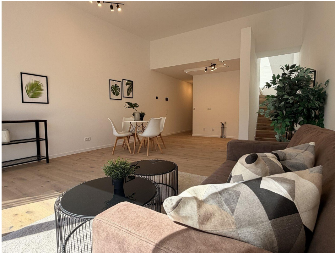
03 Wohn / Essbereich