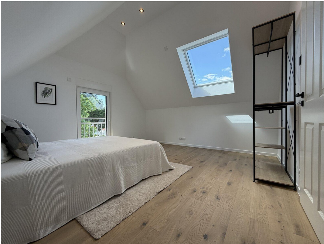
11 Schlafzimmer Klima