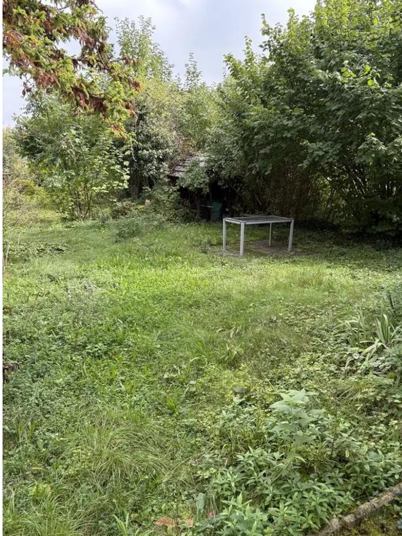
Garten an der Lauter