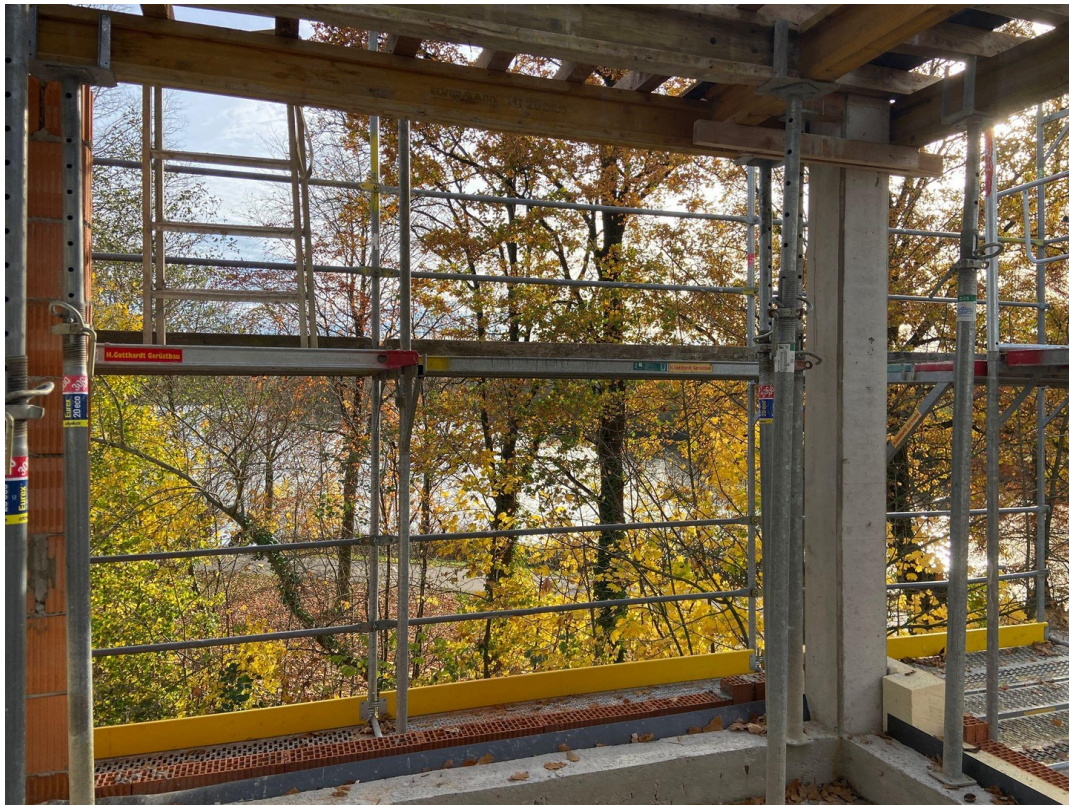
Blick auf den Aasee