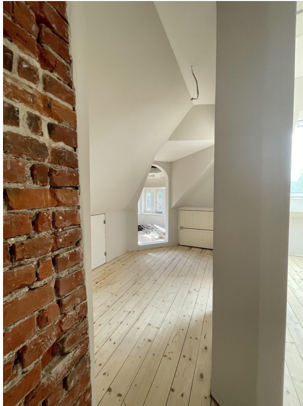
Zimmer 2 mit Turmzimmer