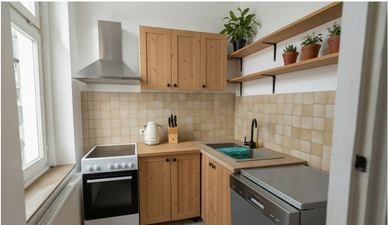
Küche aus Vergleichswohnung