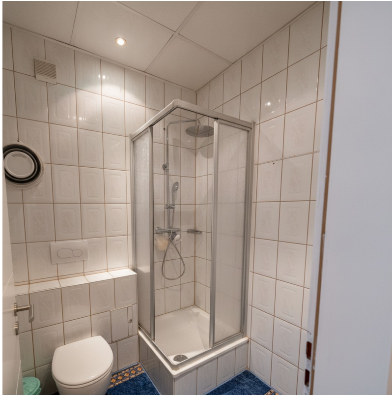
Bad mit Dusche (Beispielbild)