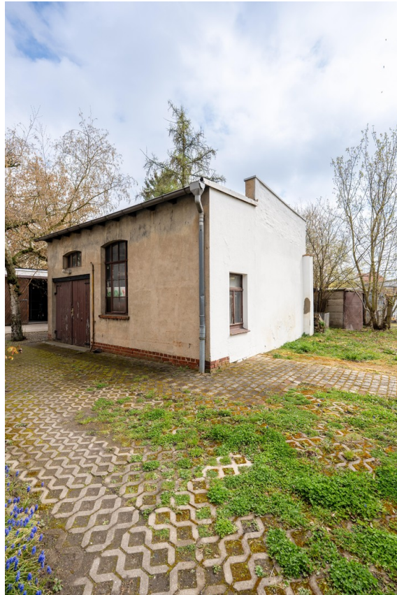
Remise, genutzt durch Mieter