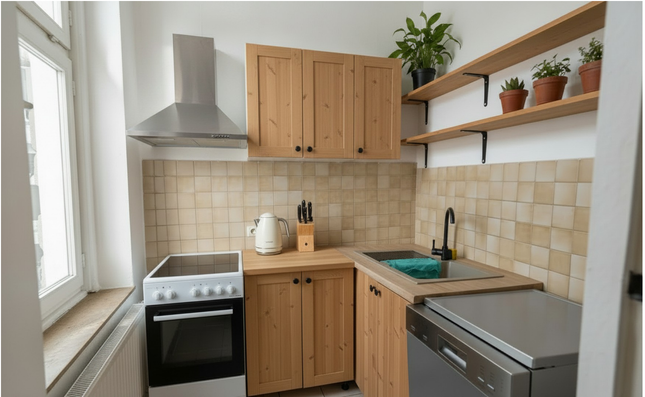
Küche aus Vergleichswohnung