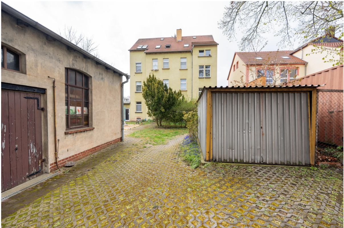
Garage für Fahrräder