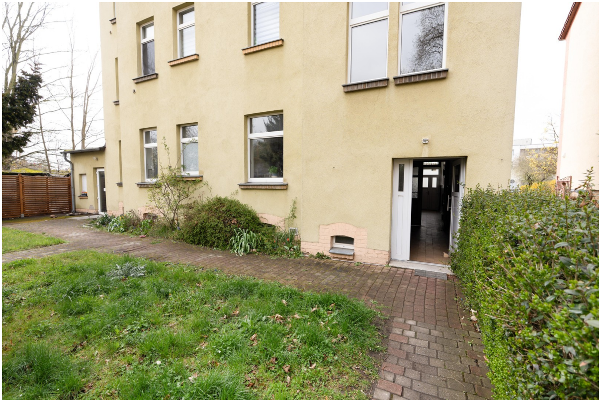
Zugang über Garten - Rückseite