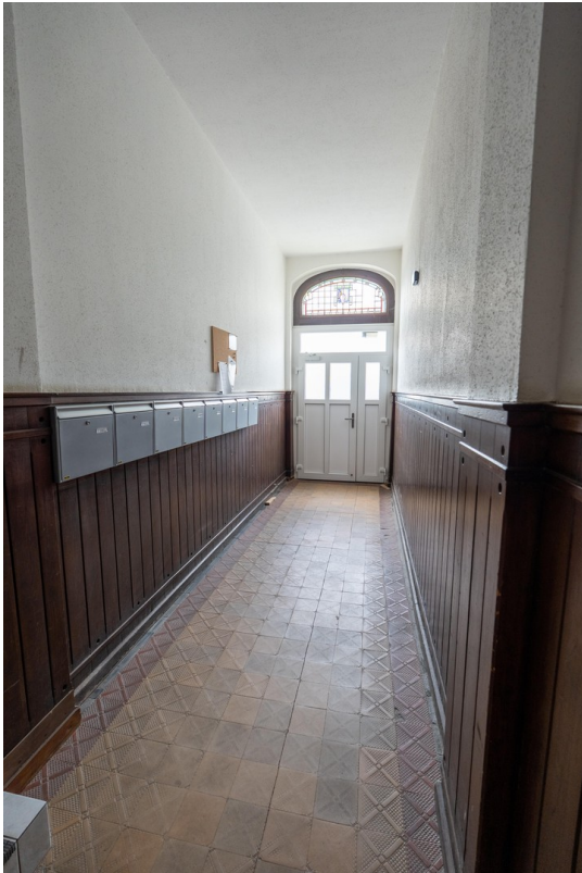
Eingangstür mit Briefkästen