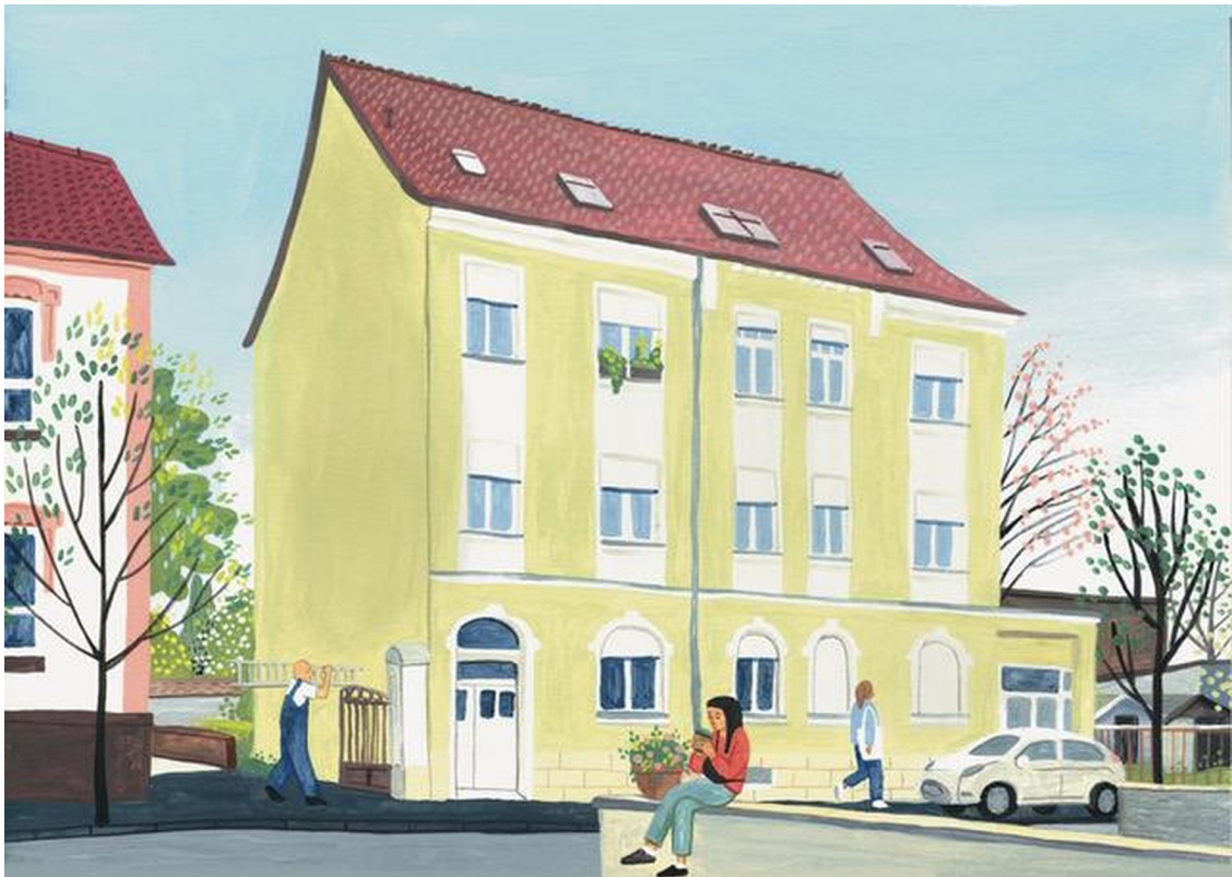
Illustration Lessingstraße 4