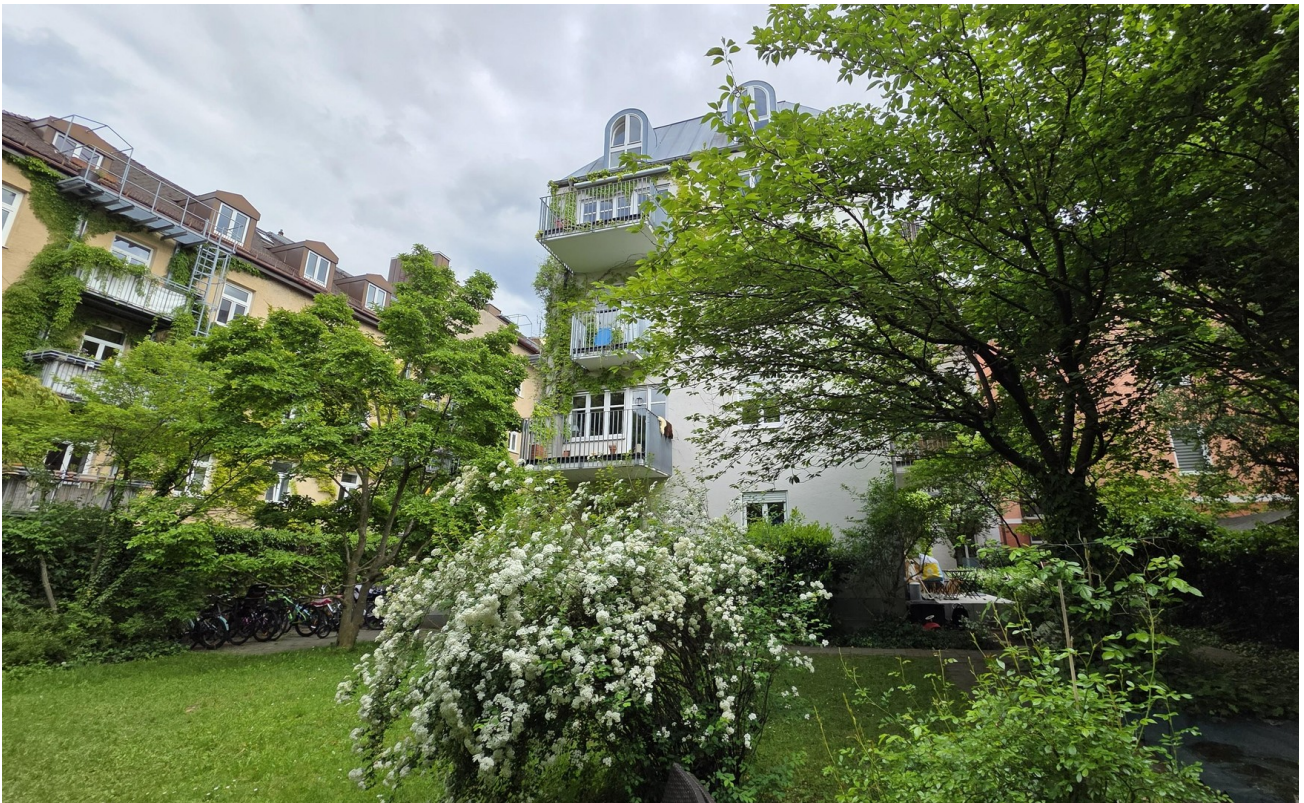
Garten und Hausrückseite