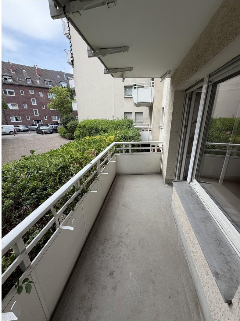
Blick vom Balkon (Zimmer 2)