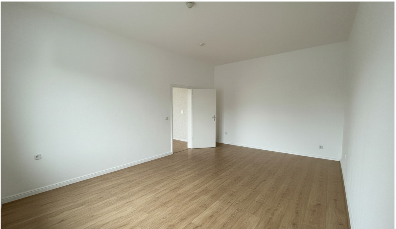
Hinteres Zimmer saniert