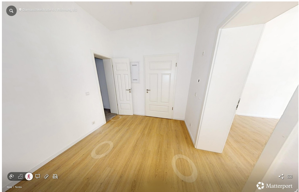
Flur (Blick zum Eingang)