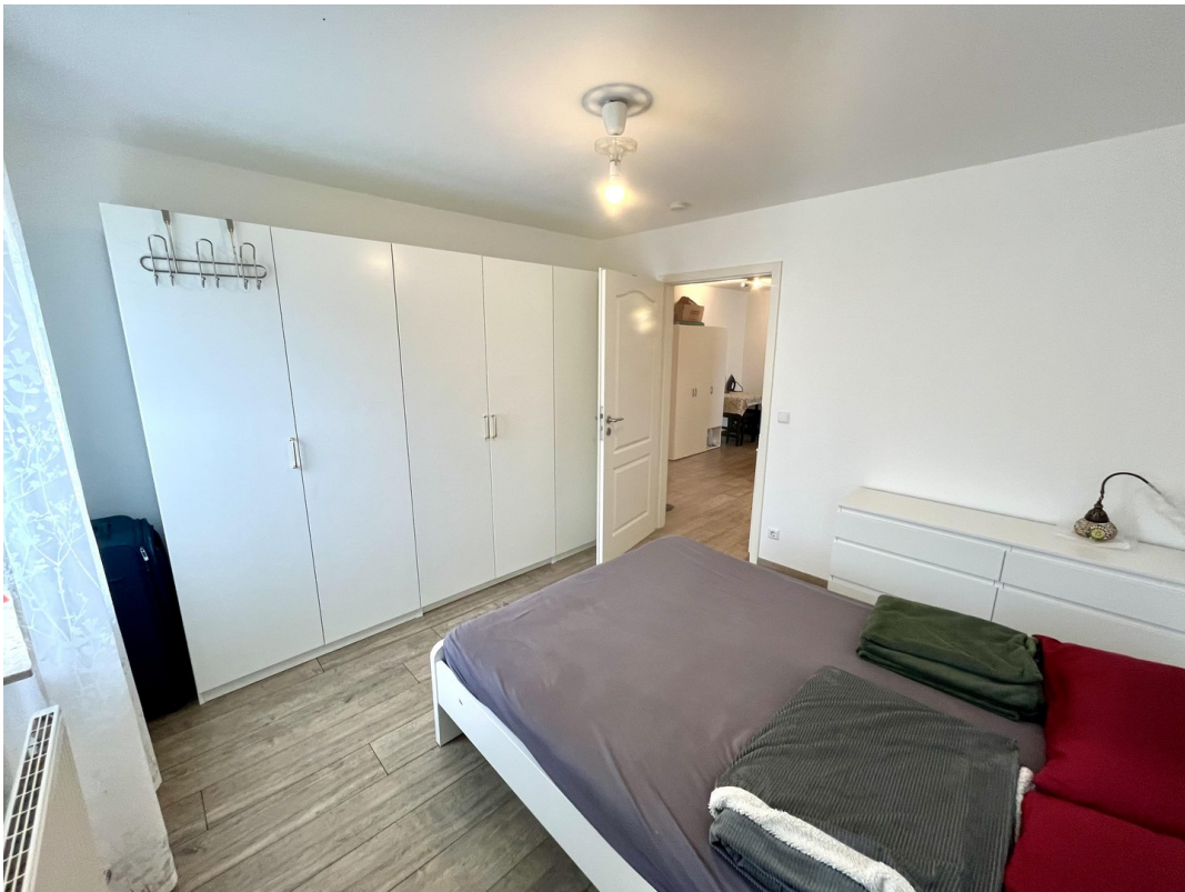
Schlafzimmer mit Schrankfront