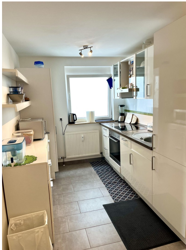
Küche mit Markengeräten