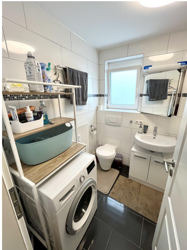
Badezimmer mit WM Anschluss