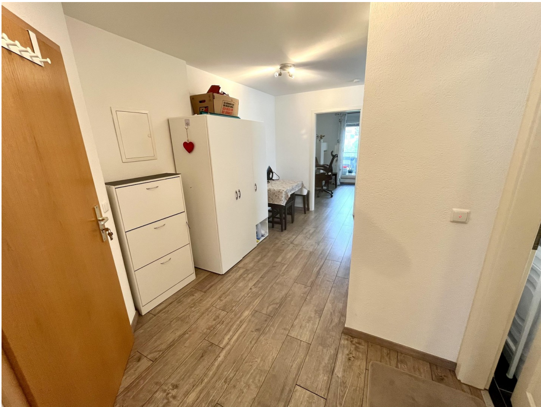
großer Flur / Eingangsbereich