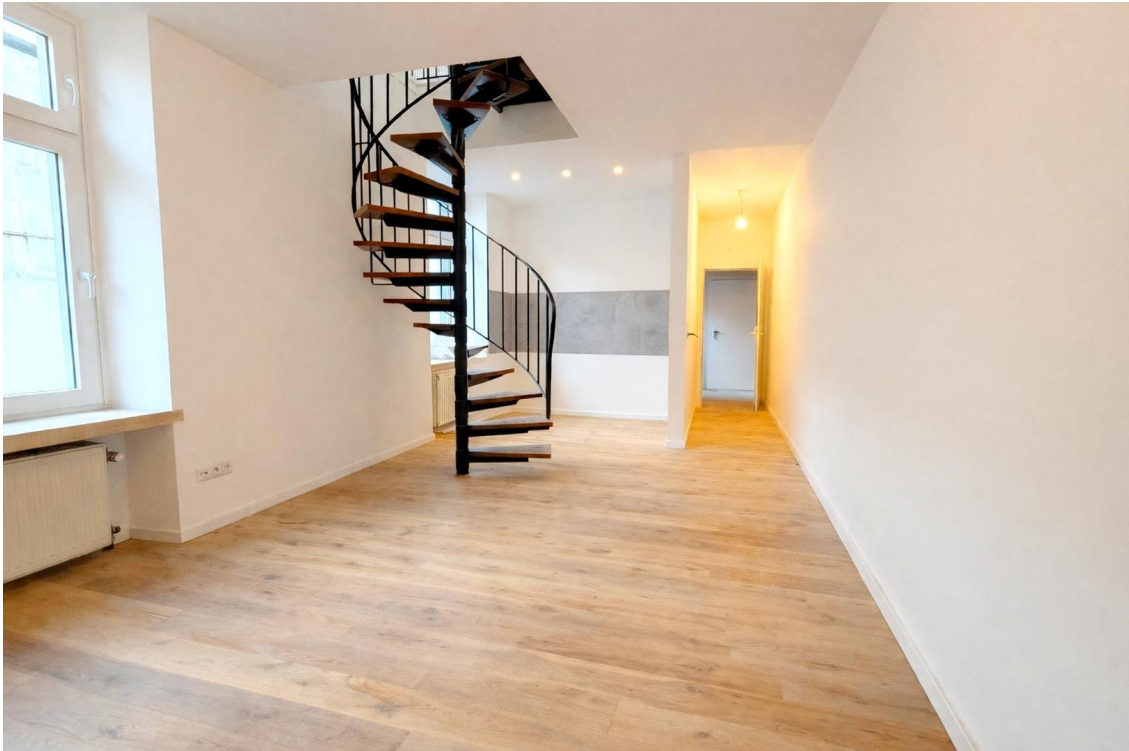
Wohnzimmer und Küche