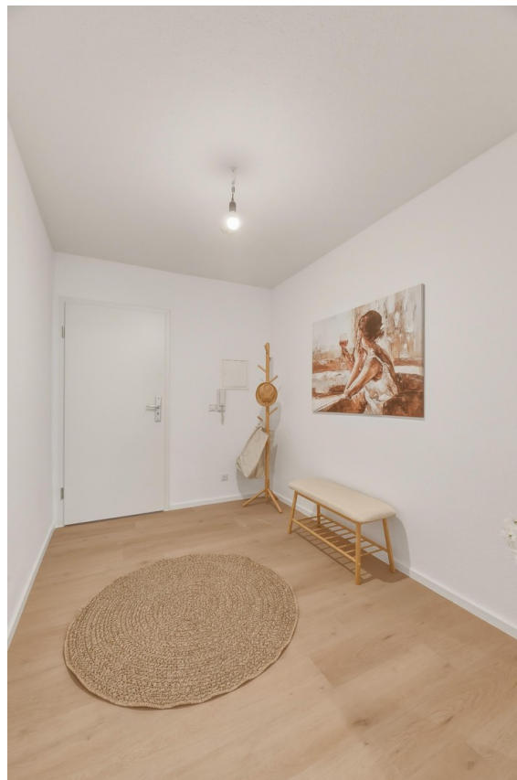
Großer Flur mit viel Platz