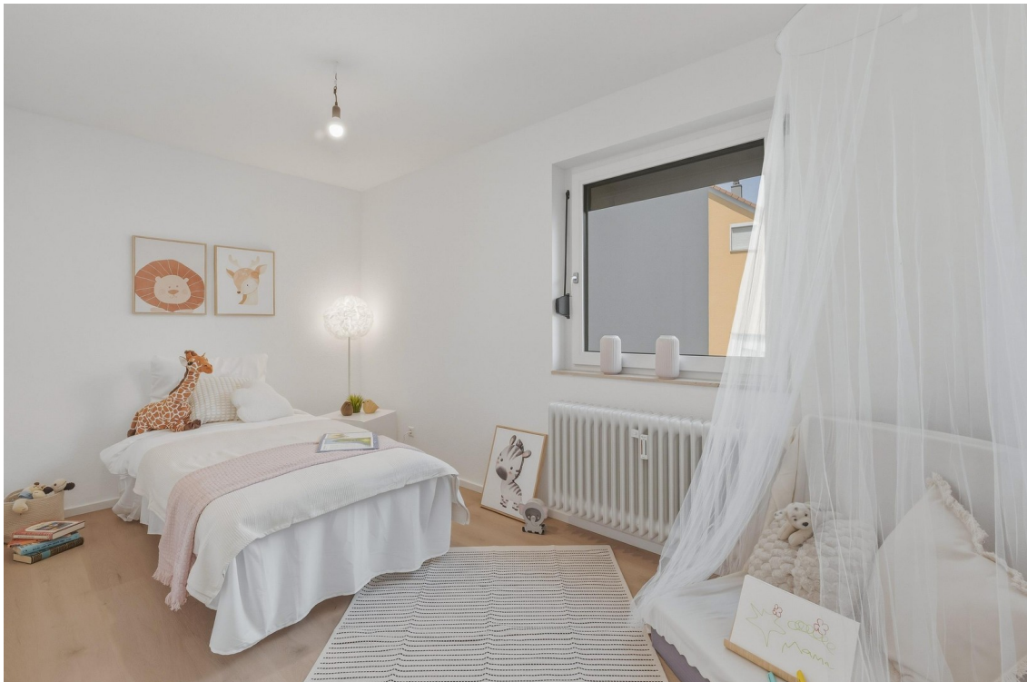
Helles, ruhiges Kinderzimmer