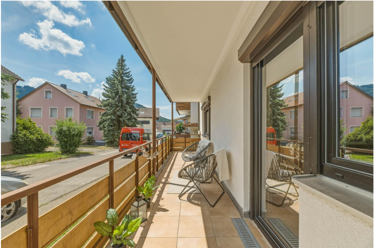
Schöner, ruhiger Sonnenbalkon