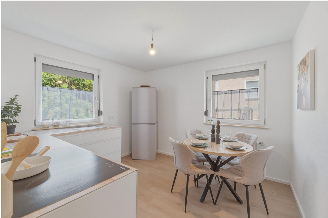
Helle Küche mit Esstisch