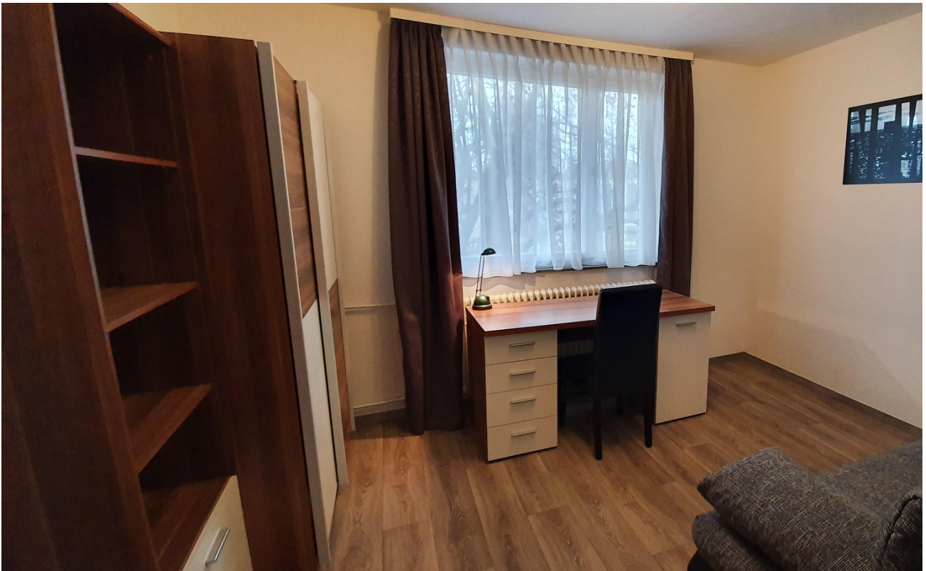
3er WG Studenten