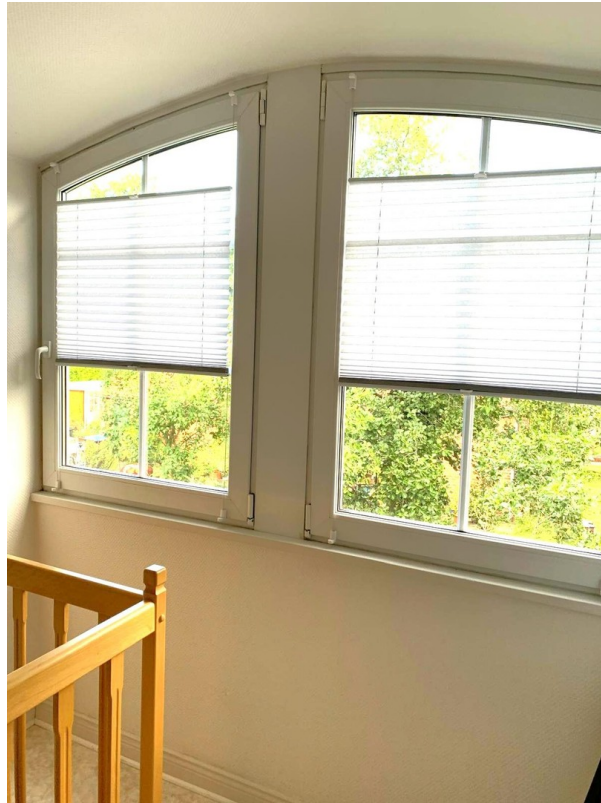
DG Flur Gaube