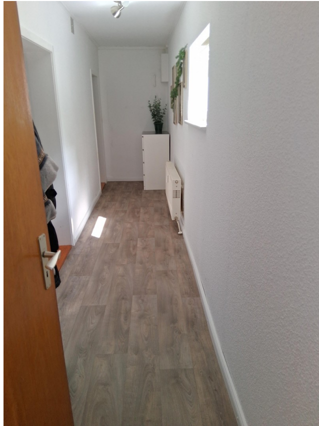
EG Flur im Anbau