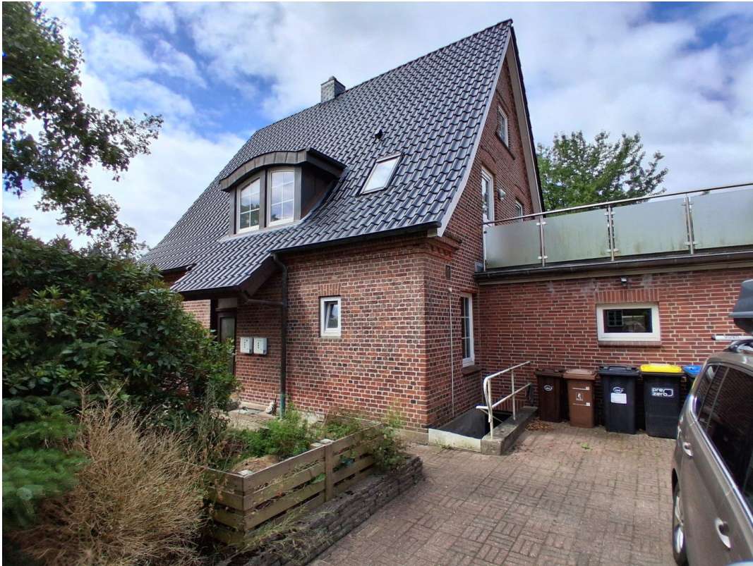
Eingang und Anbau