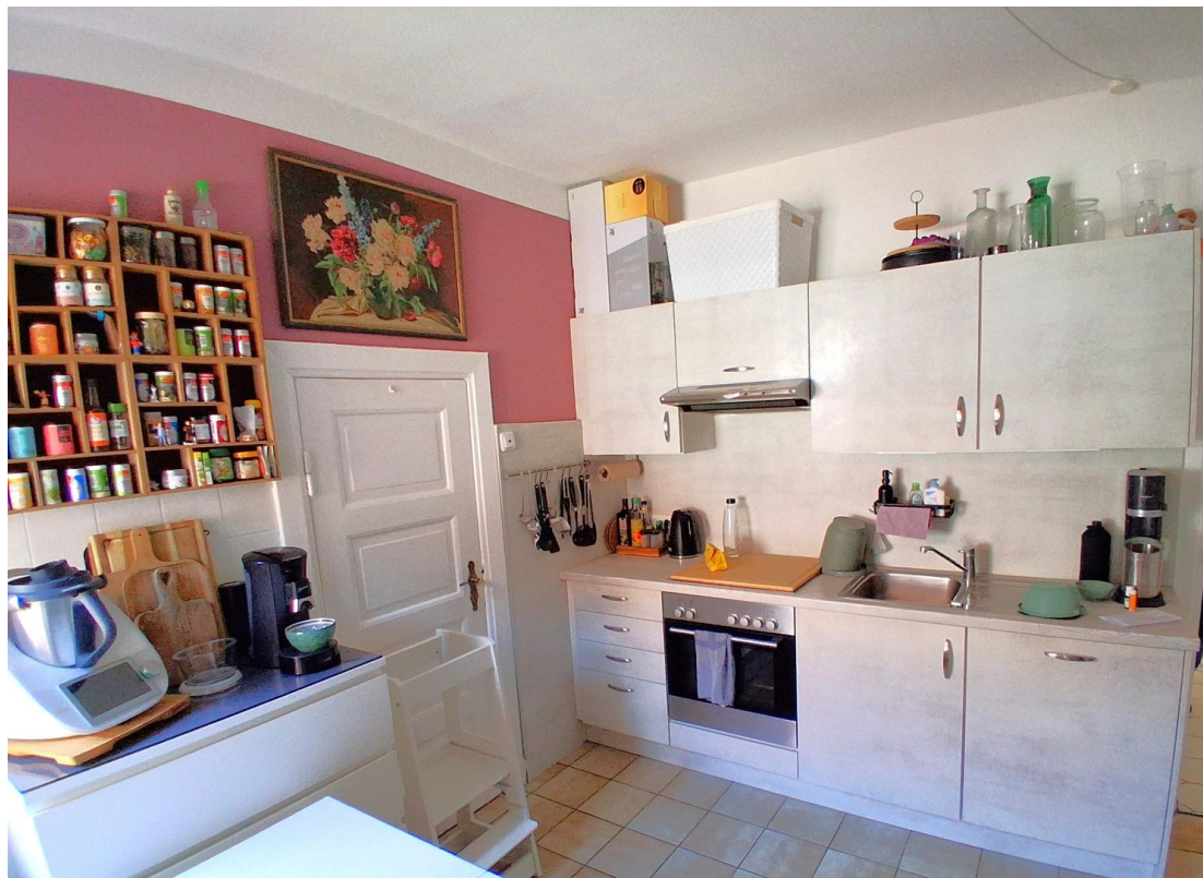
EG Küche mit Speisekammer