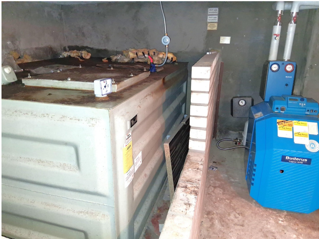
Öltank 3000 l