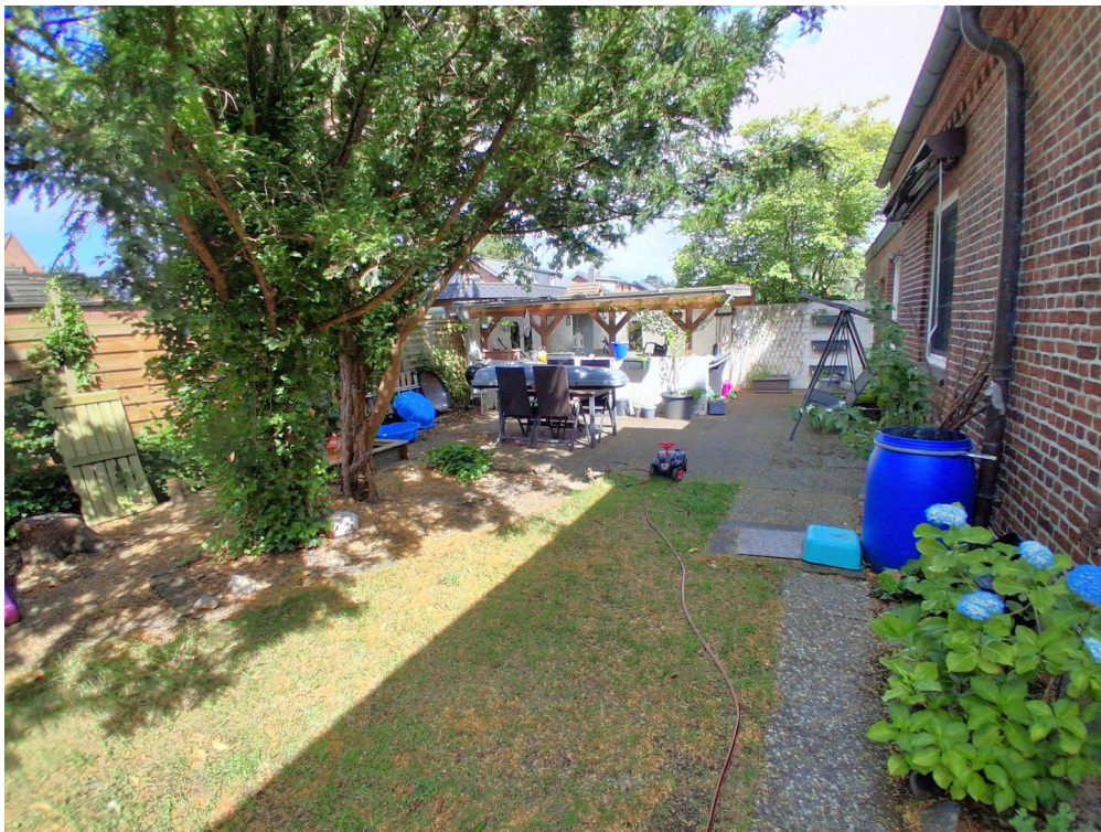
Garten mit Freisitz