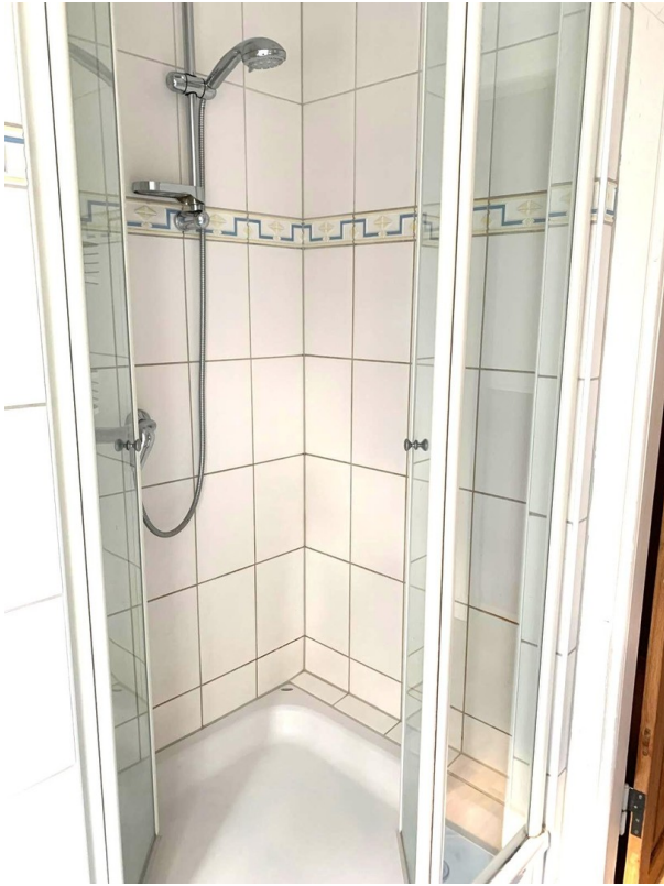
OG Bad Dusche