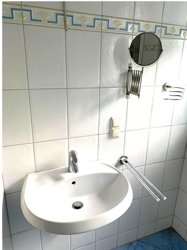
OG Bad Waschtisch