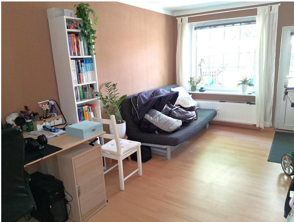
EG Gästezimmer im Anbau