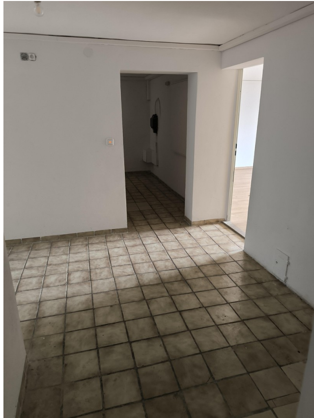
Keller - Flur