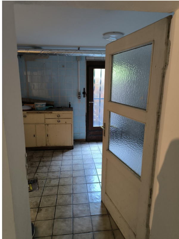
Keller - Zugang zum Garten