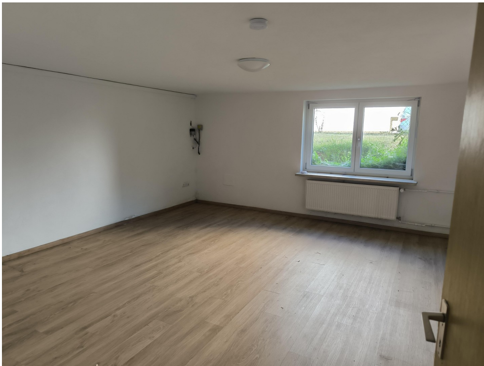
Keller - Hobbyraum 1