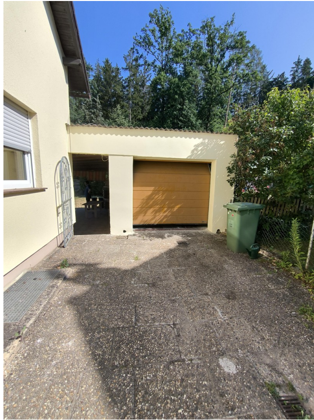
Garage/Einfahrt + Gartenzugang