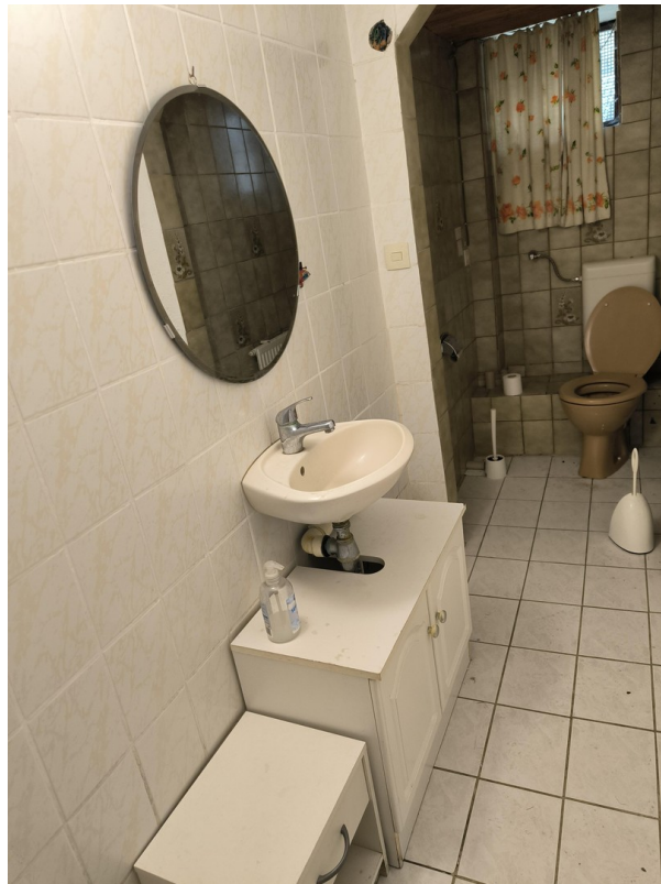
Keller - Bad