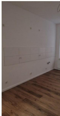
Küche mit Ausgang zur Innenhof-Terrasse