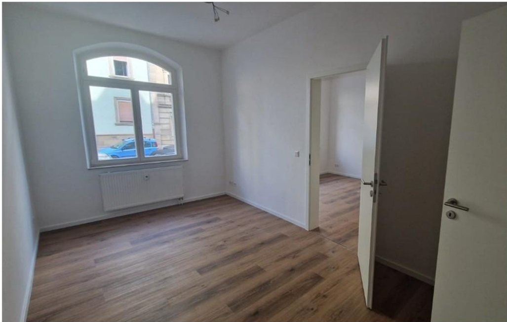
Wohnzimmer: 14,69 m 2