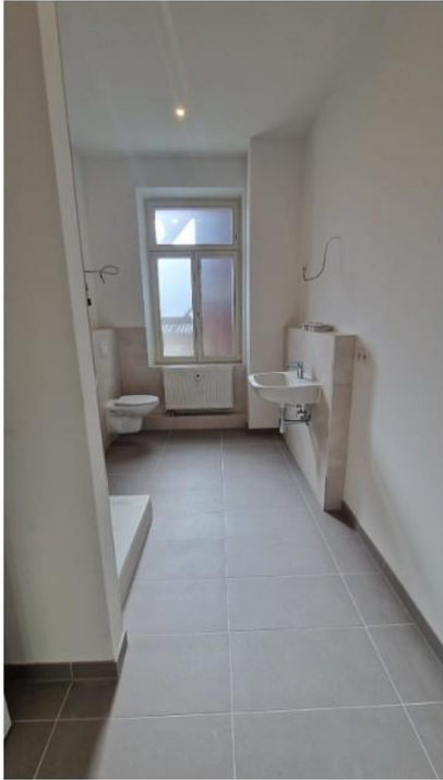
Helles Badezimmer mit Nische für Waschmaschine und Trockner: 8,26 m 2