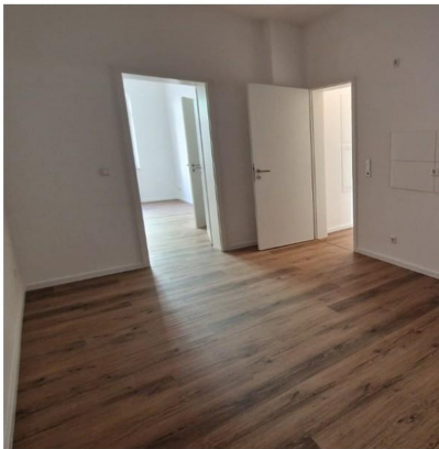
Küche: 17,13 m 2