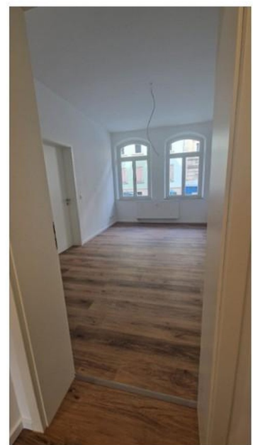
Schlafzimmer: 17,83 m 2