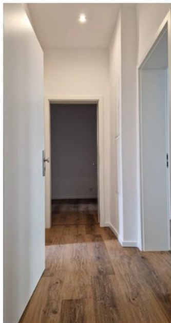
Flur mit LED Einbauleuchten: 3,10 m 2