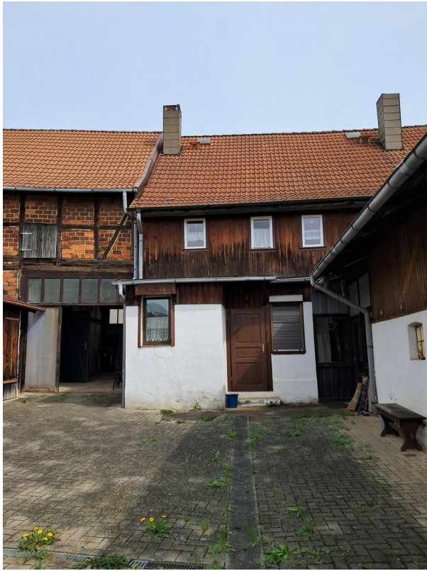
Haus von Hofseite