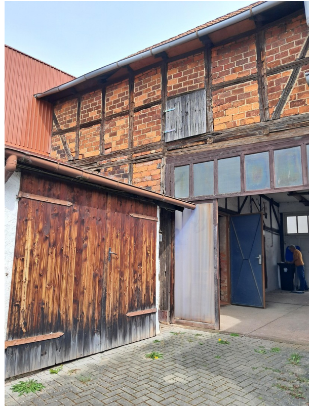
Scheune und Garage