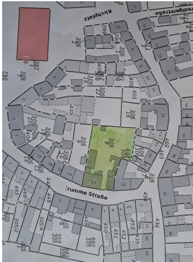
Lage im Stadtzentrum