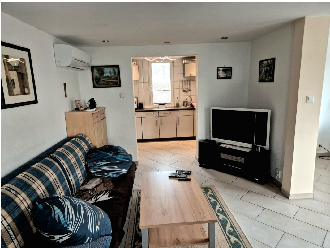
Wohnzimmer Blick in die Küche