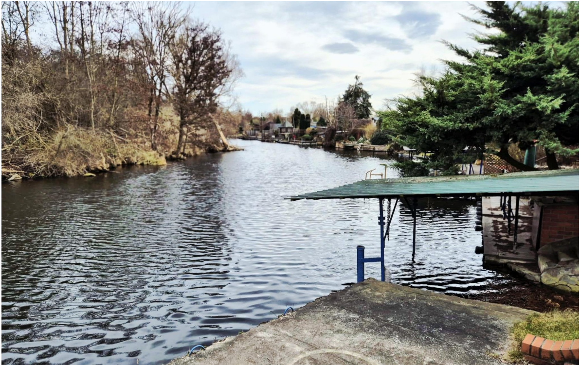
Blick vom Steg/unverbaubar