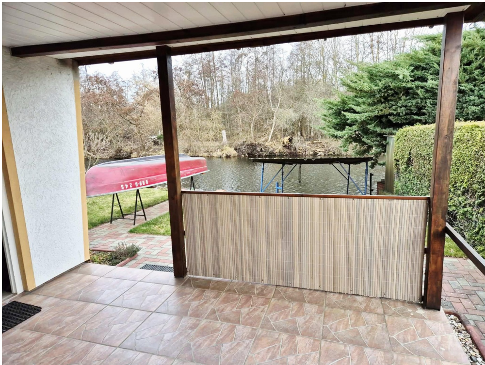
überdachte große Terrasse