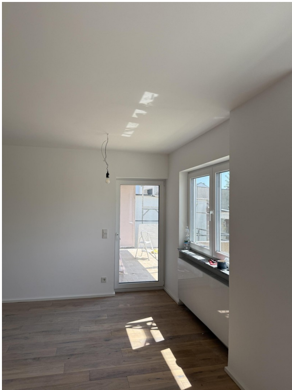
Ausgang zum Balkon