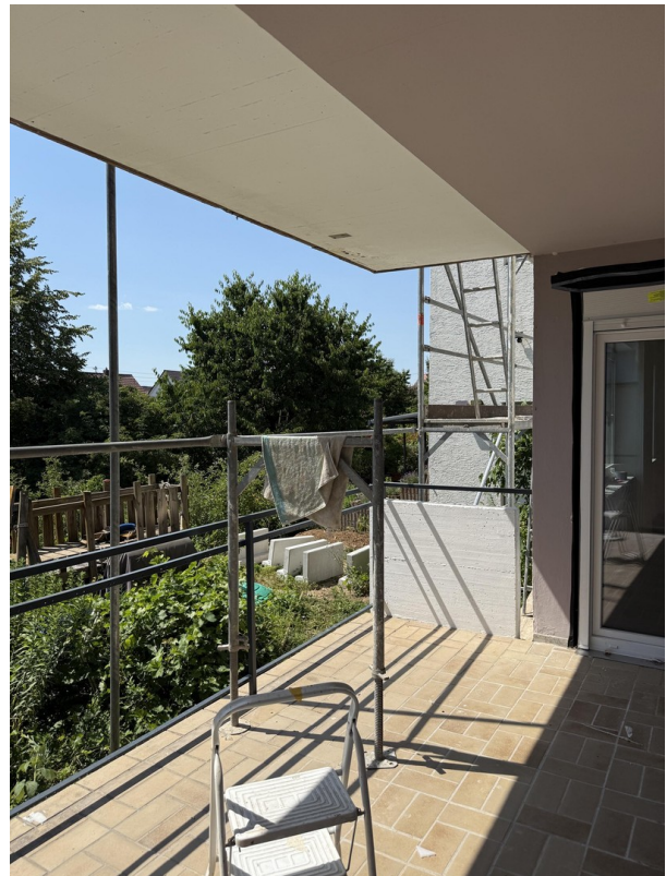
Blick vom Balkon in den Garten