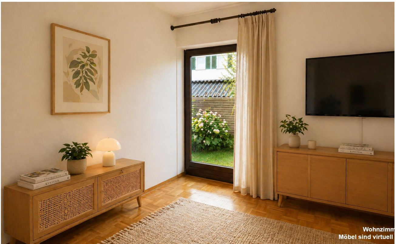
Wohnzimmer Möbel sind virtuell