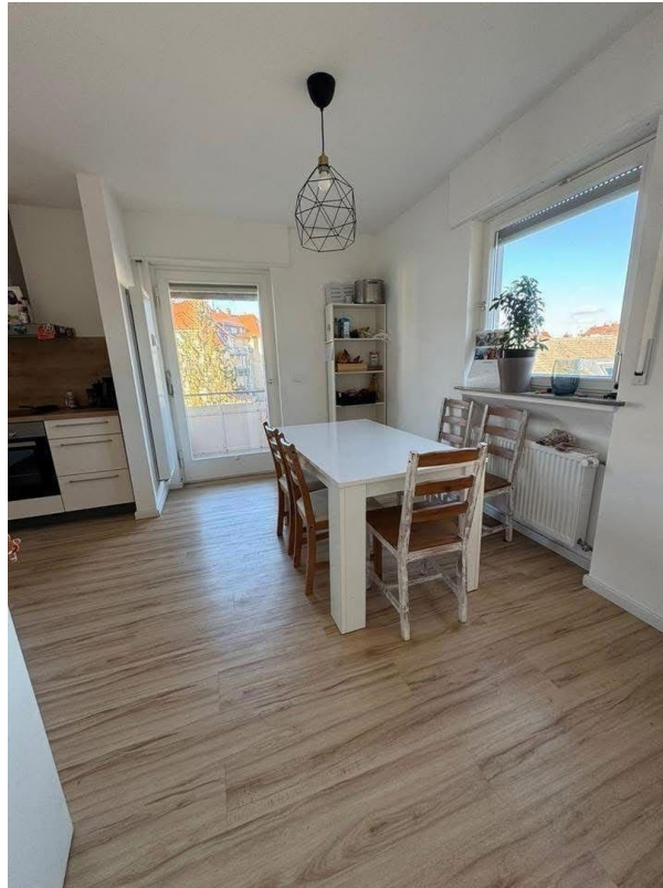
Essküche 1. OG