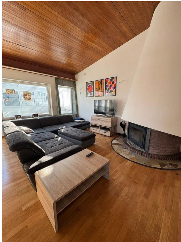
Wohnzimmer 1. OG