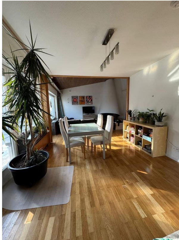
Wohnzimmer 1. OG