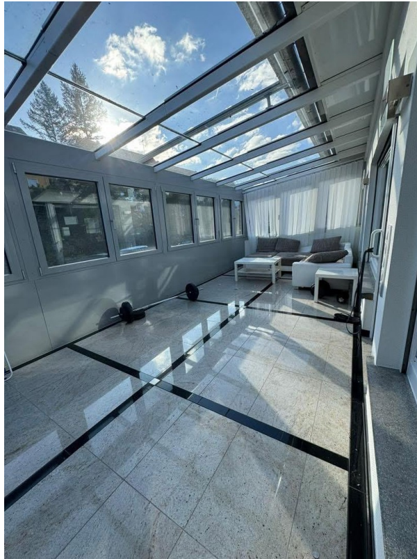
Wintergarten 1. OG