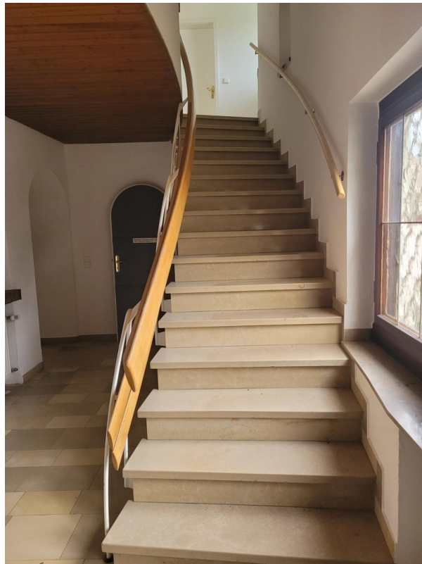
Treppenaufgang ins 1. OG