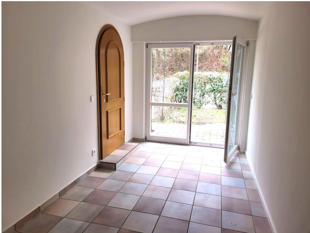
Abstellraum neben dem Eingang