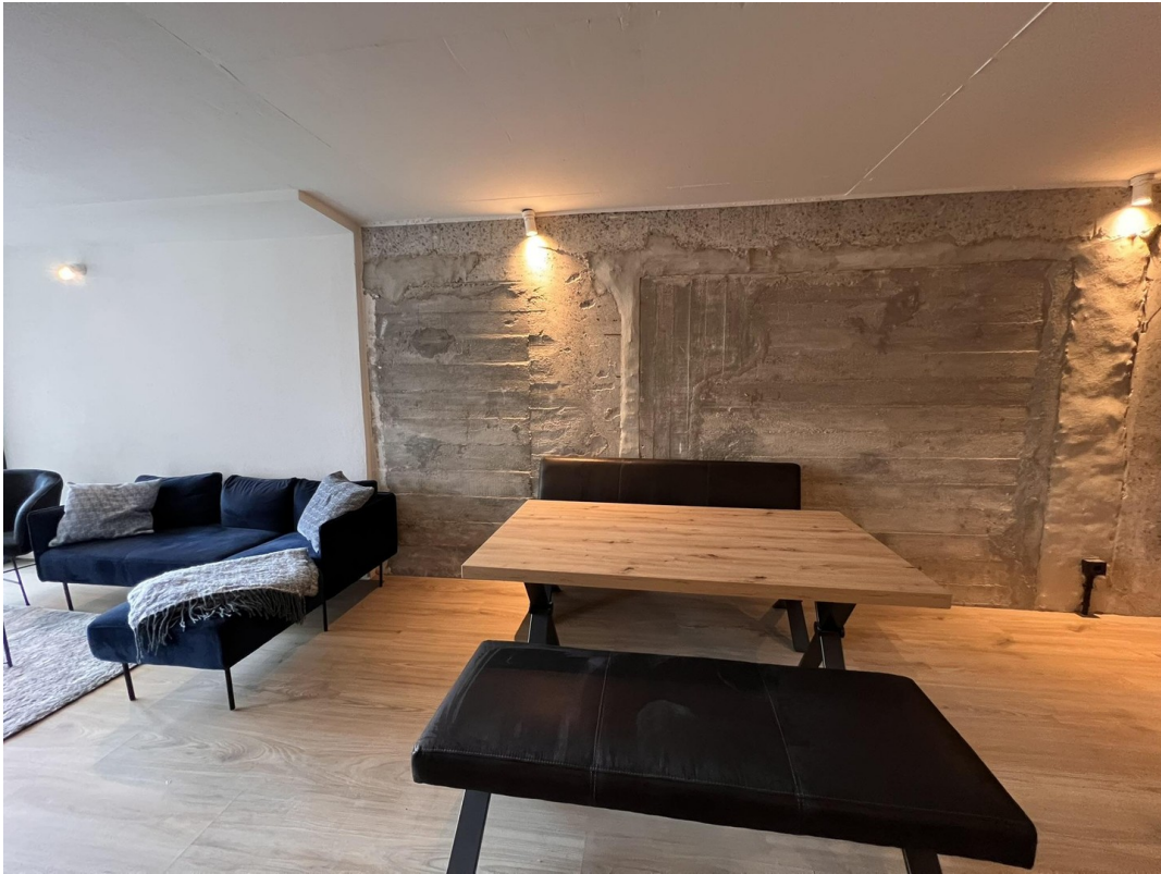
Blick vom Bett