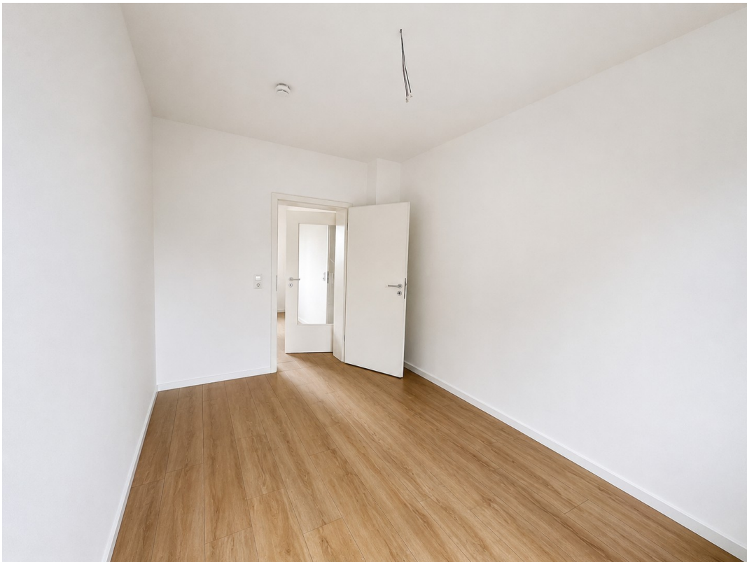
Zimmer 2 Blick zur Tür