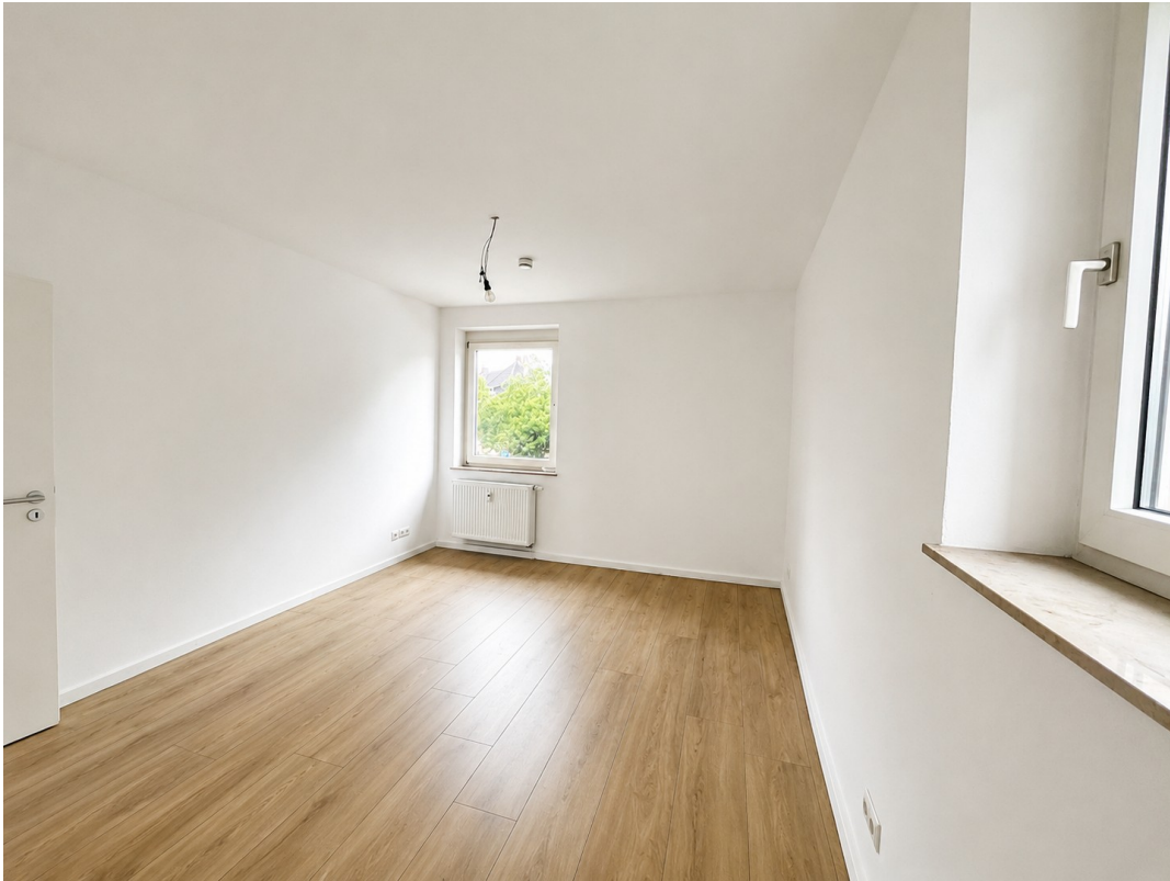
Schlafzimmer Blick zum Fenster