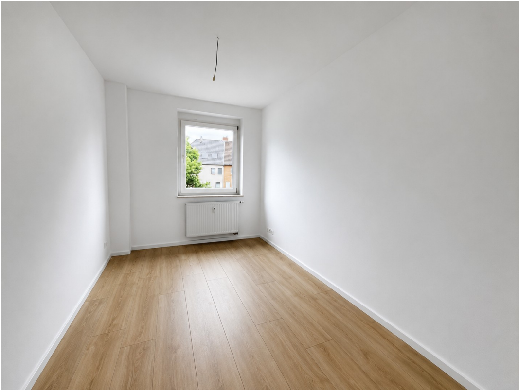
Zimmer 2 Blick zum Fenster