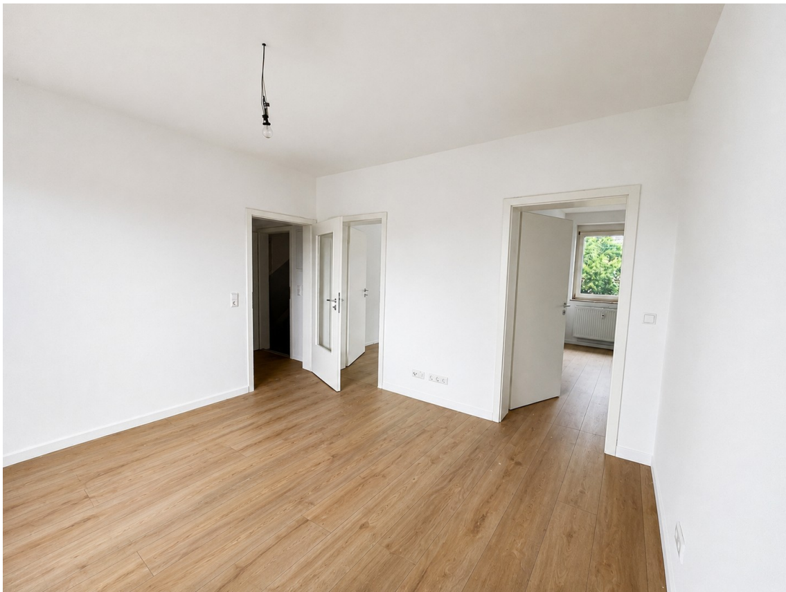
Wohnraum Blick von Küche