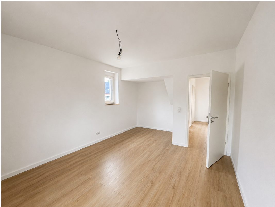
Schlafzimmer Blick zur Tür