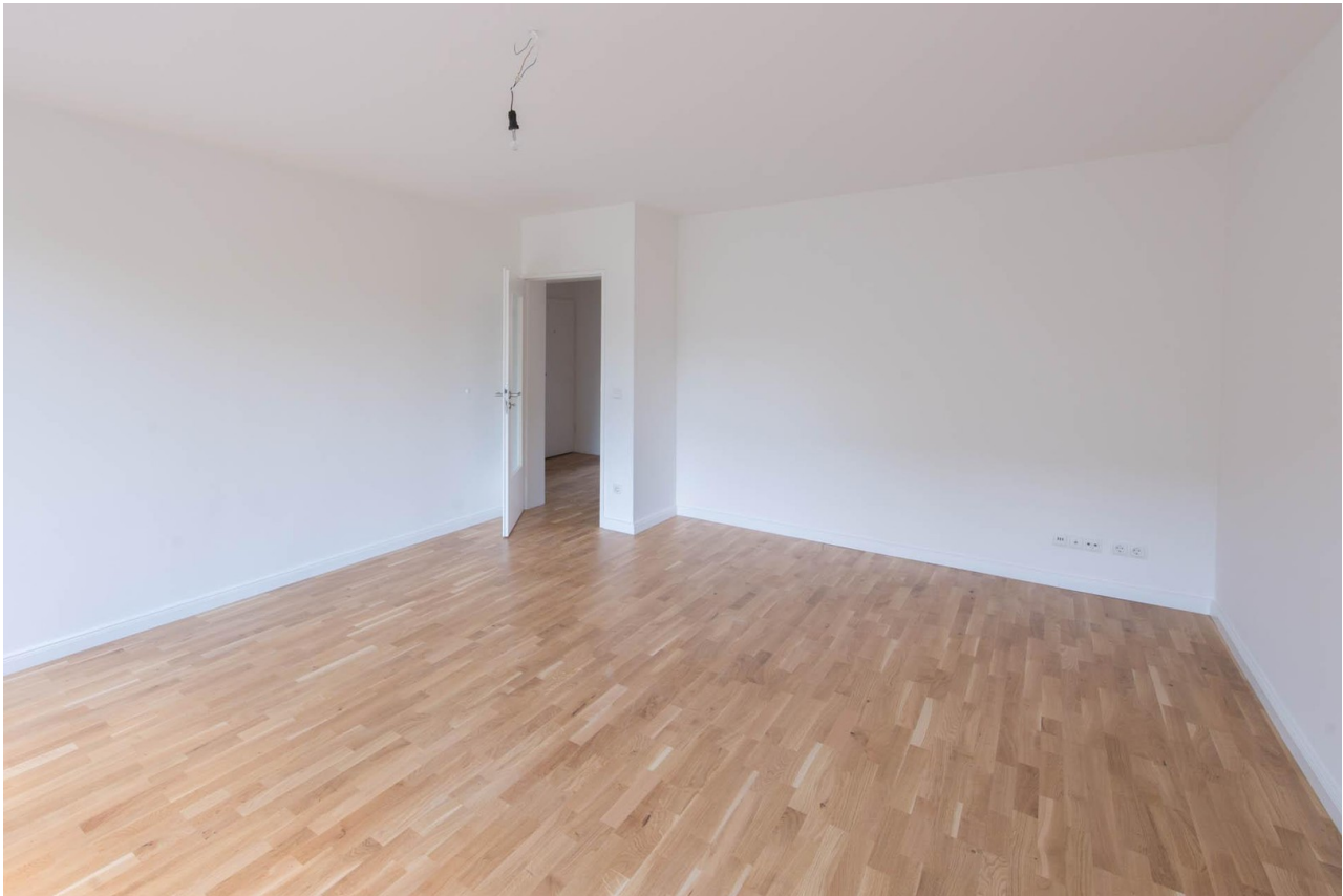
Wohnzimmer WHG 2.OG