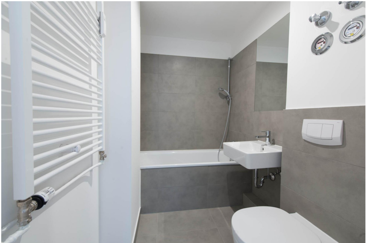
Bad WHG 2.OG