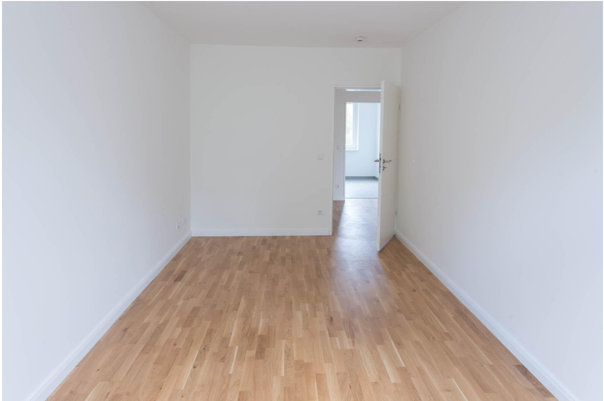
Arbeitszimmer WHG 2.OG