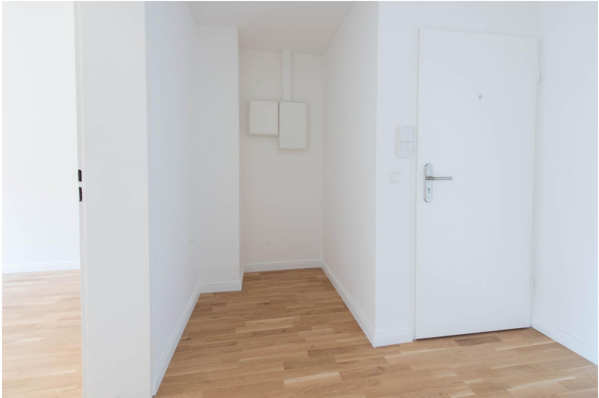
Flur WHG 2.OG