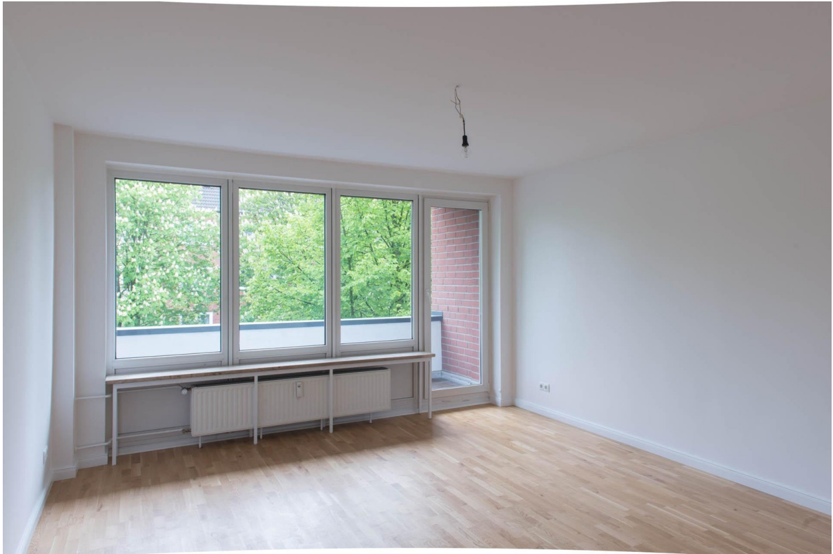
Wohnzimmer WHG 2.OG