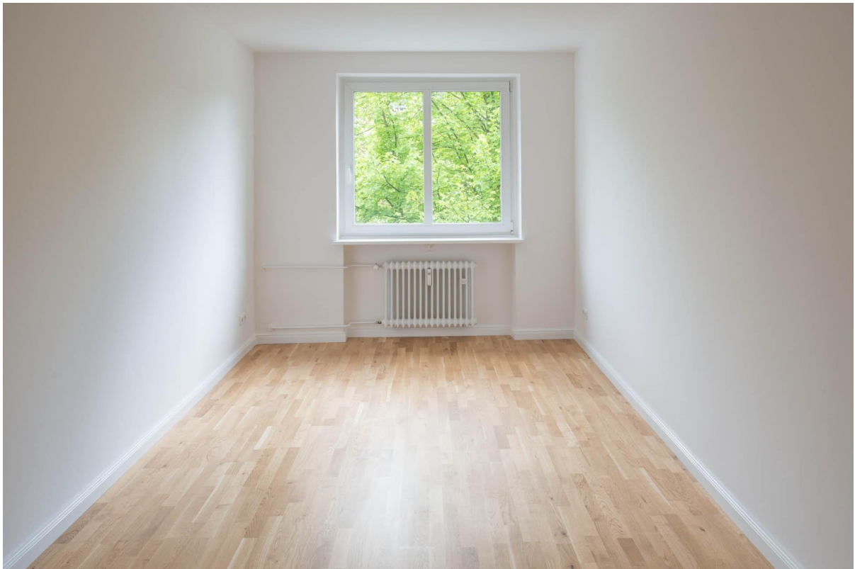
Arbeitszimmer WHG 2.OG