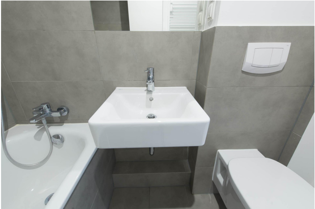
Bad WHG 2.OG