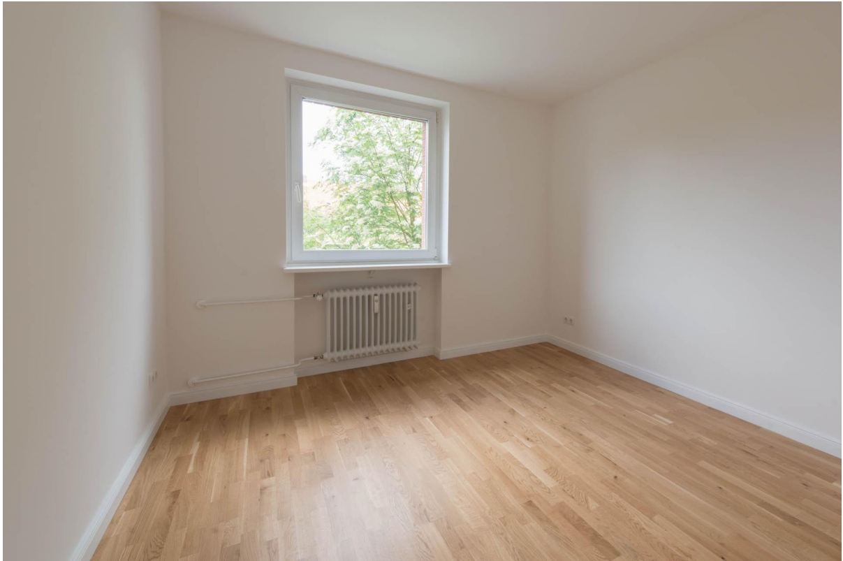
Schlafzimmer WHG 2.OG