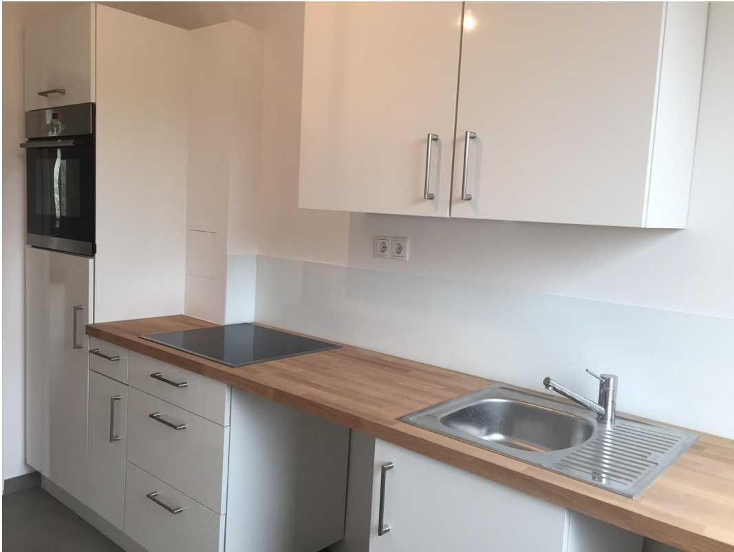
Küche WHG 2.OG