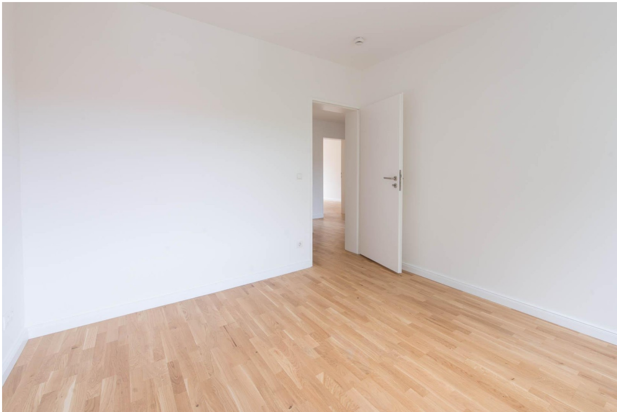
Schlafzimmer WHG 2.OG