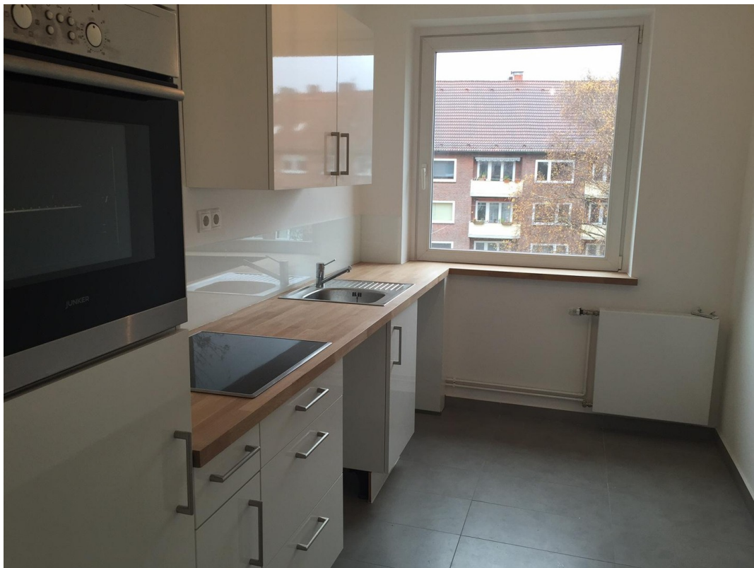
Küche WHG 2.OG