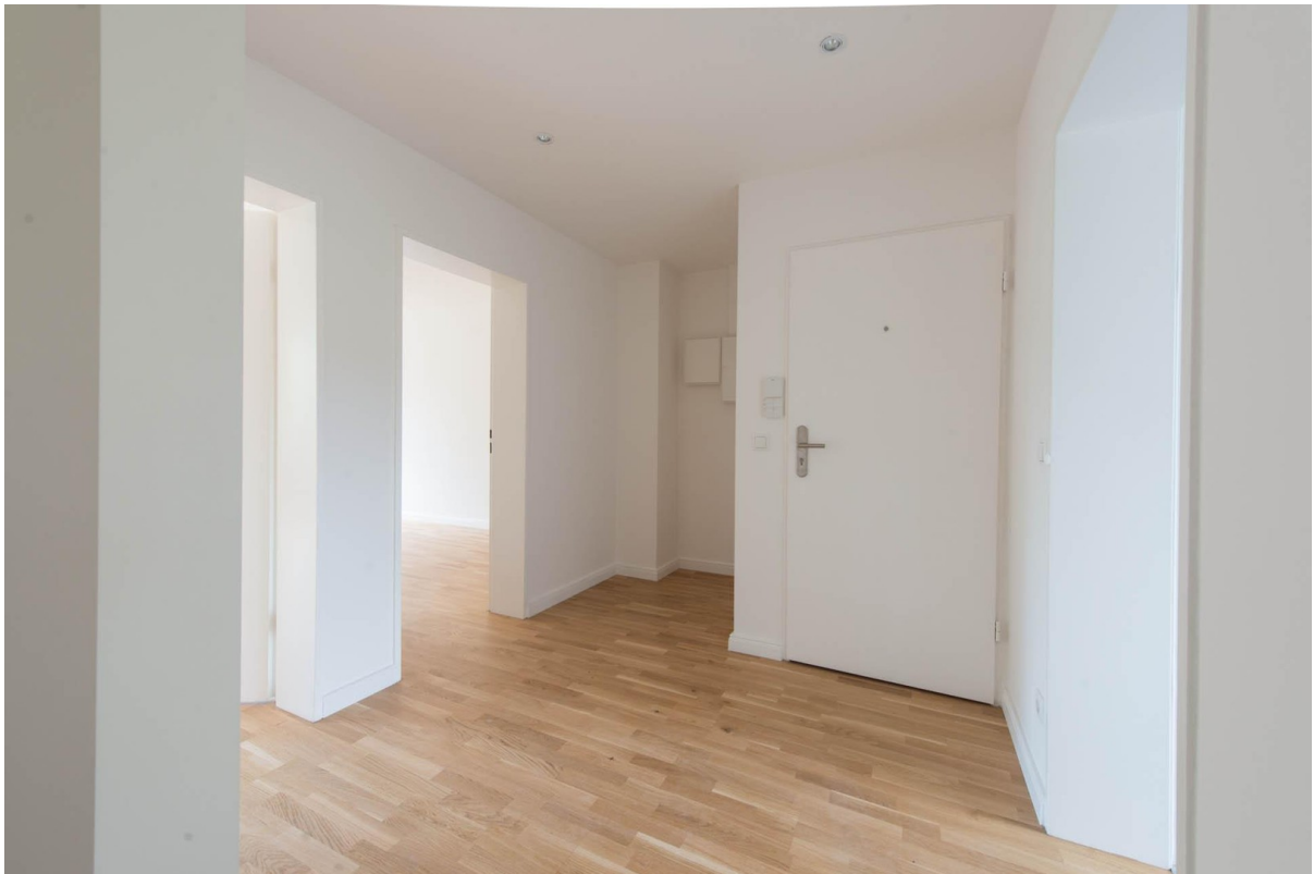
Flur WHG 2.OG