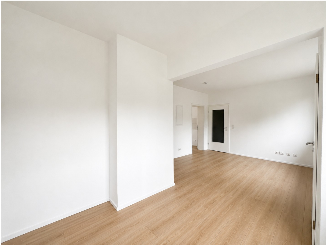
Blick von Nische in Wohnraum