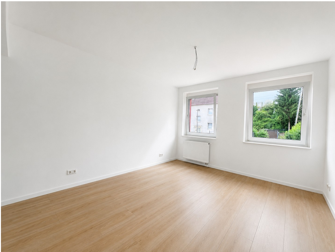
Schlafzimmer Blick zum Fenster