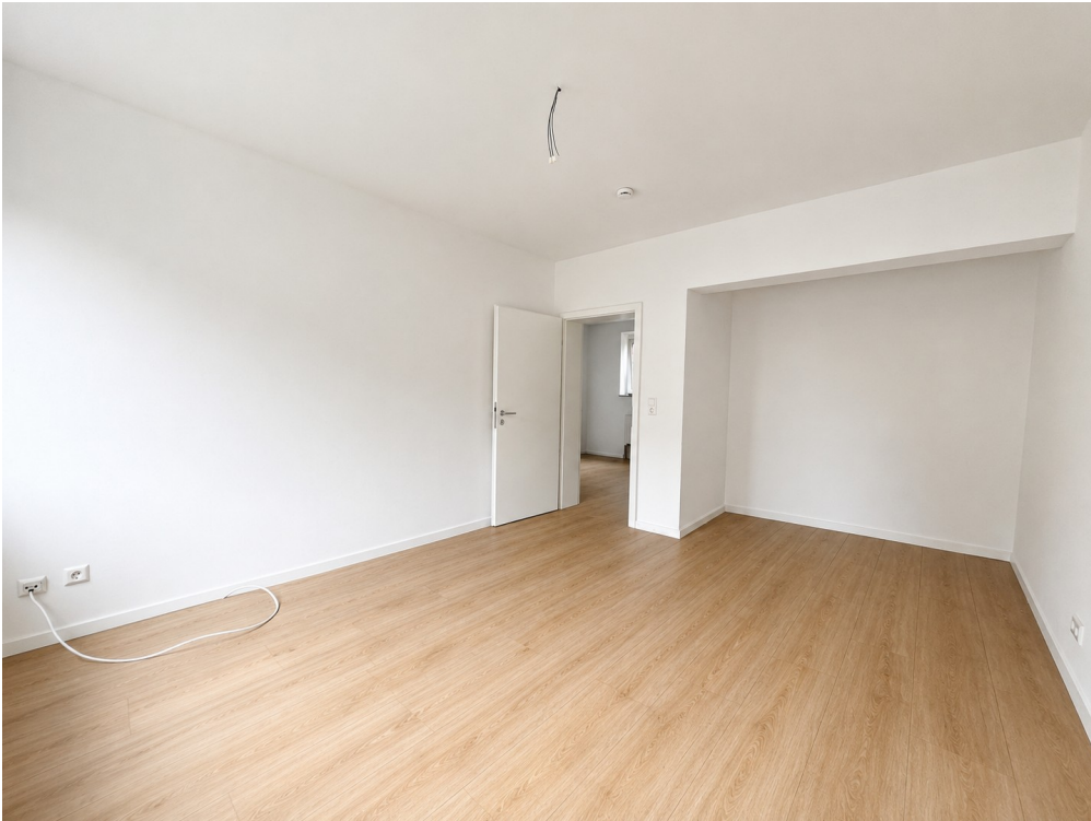
Schlafzimmer Blick zur Tür