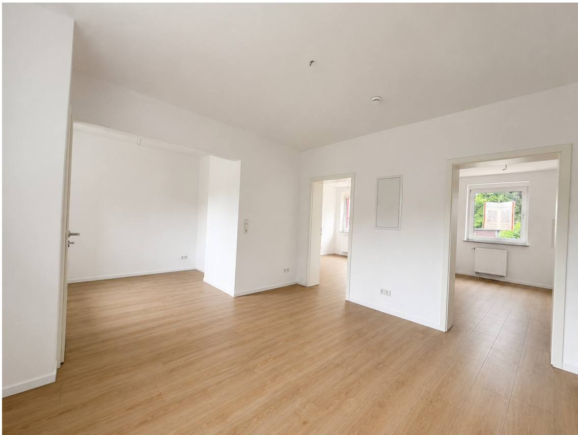
Wohnraum Blick in Zimmer