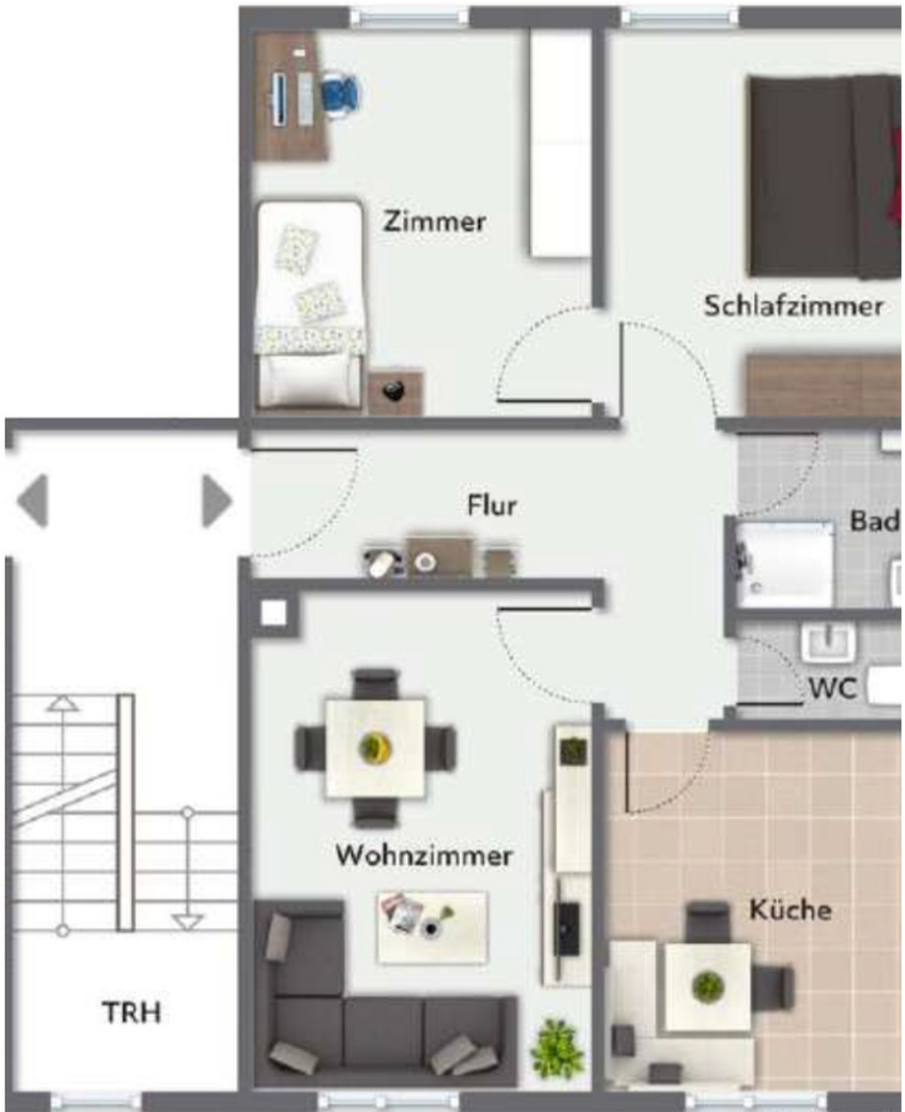
Grundriss - nicht maßstäblich