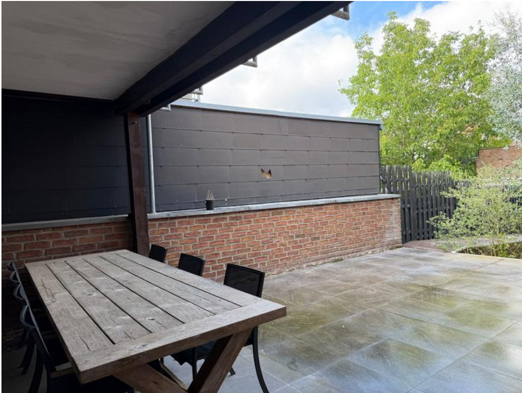
Terrasse - Blick zum Garten