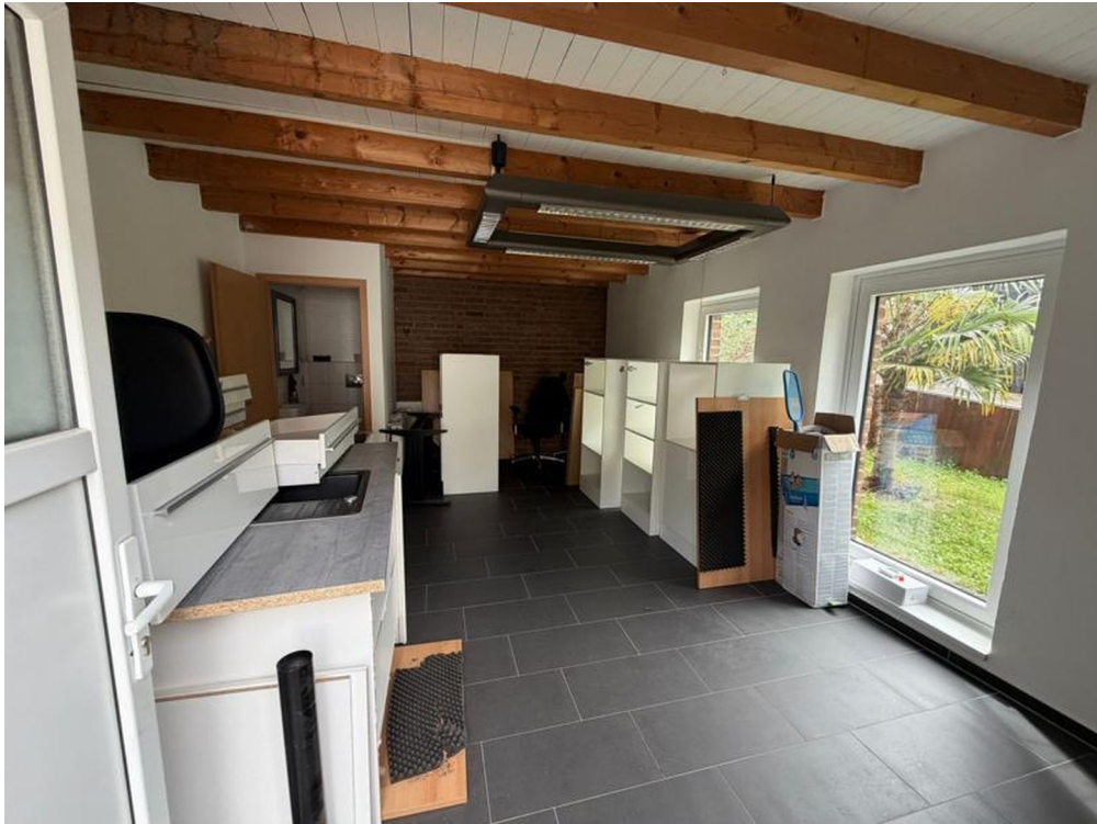
Büro - aktuell Lagerraum