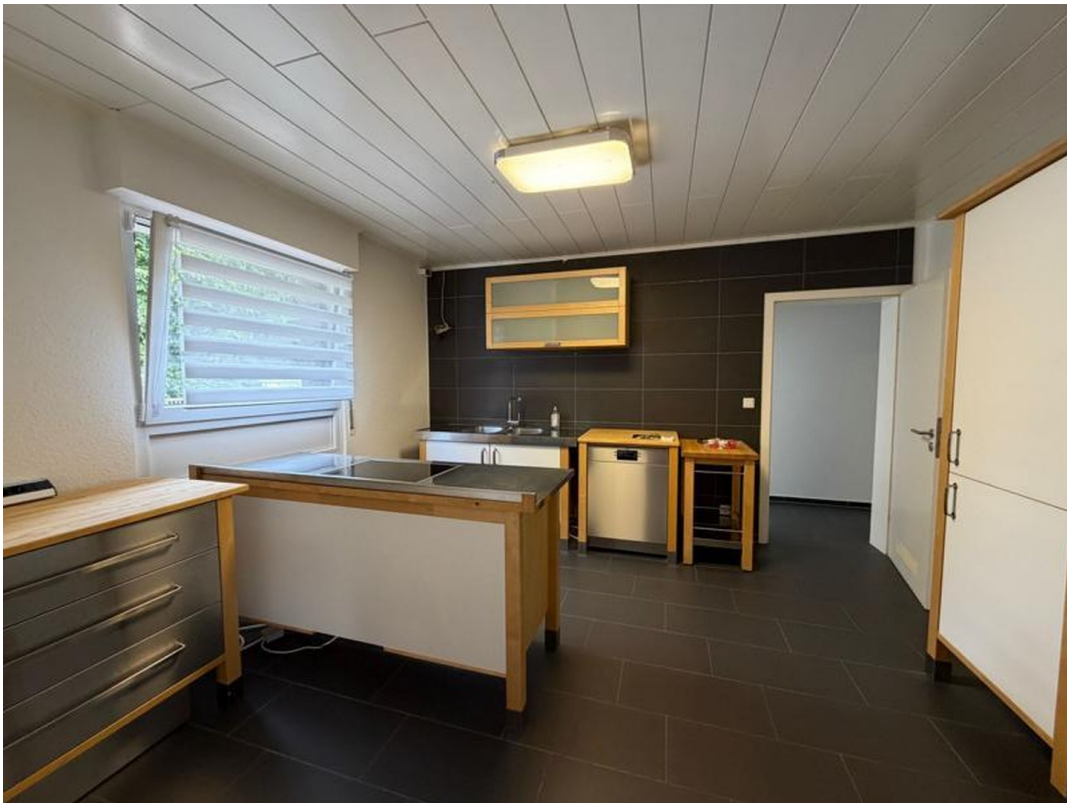
Küche - Blick vom Wohnzimmer