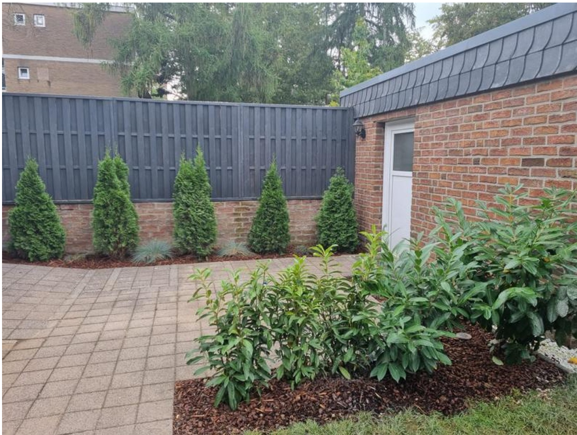
Eingang zum Büro