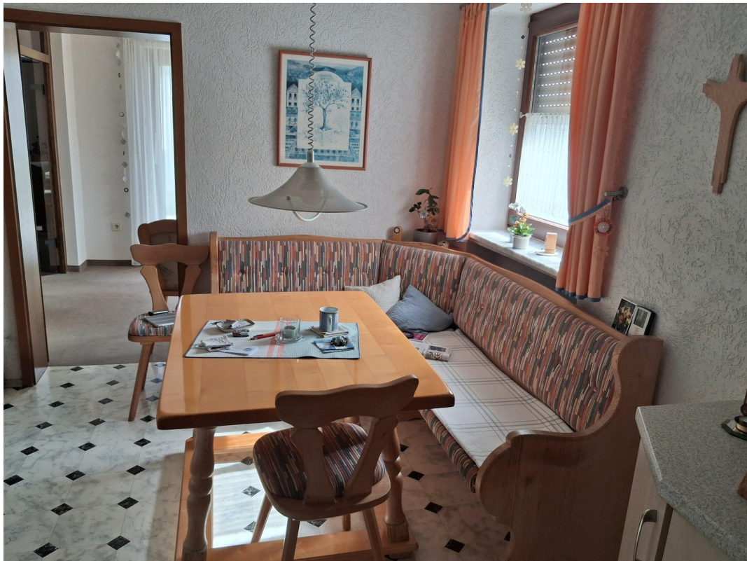
Eckbank in Küche