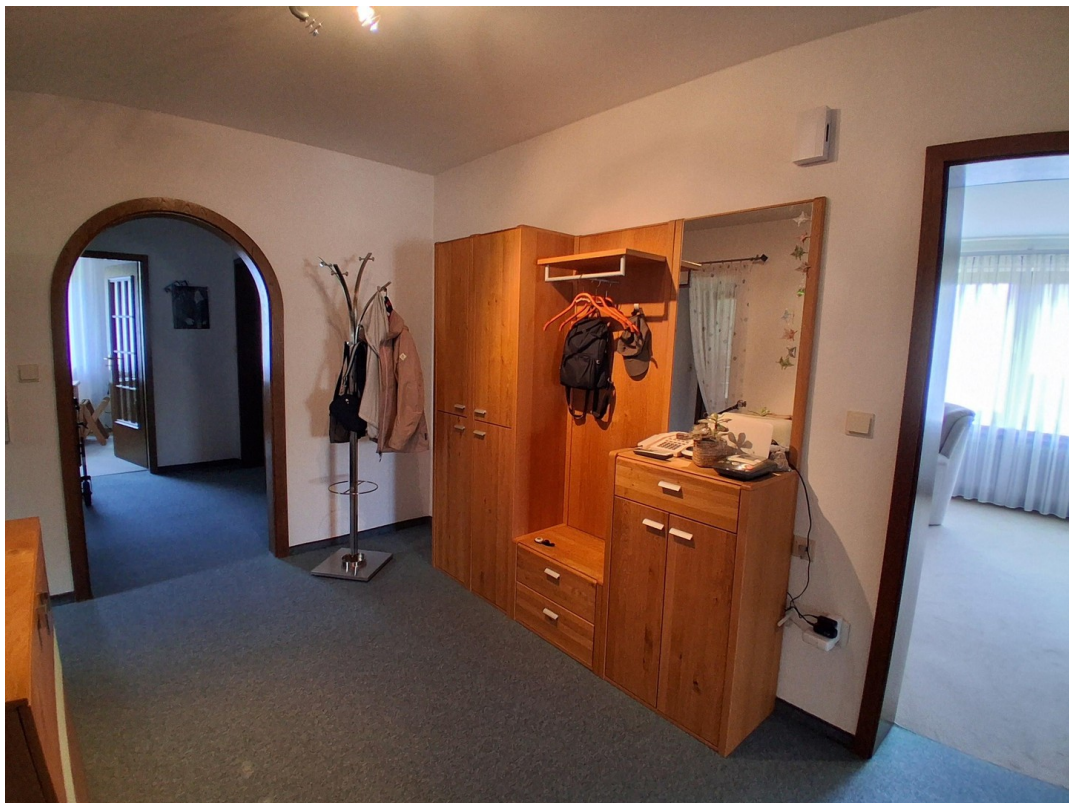
Diele mit Garderobe