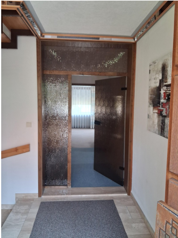
Eingangsbereich m. Treppenhaus