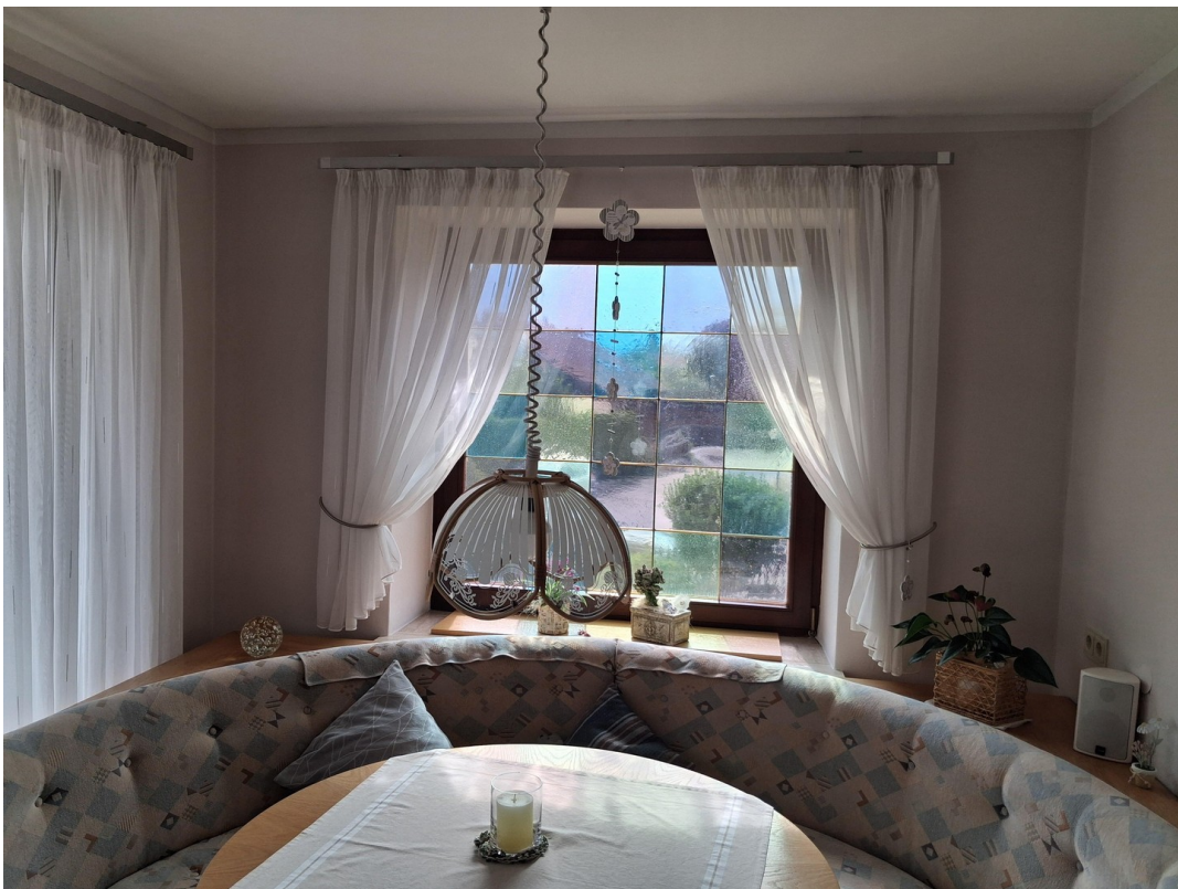
Esszimmer mit Rundbank