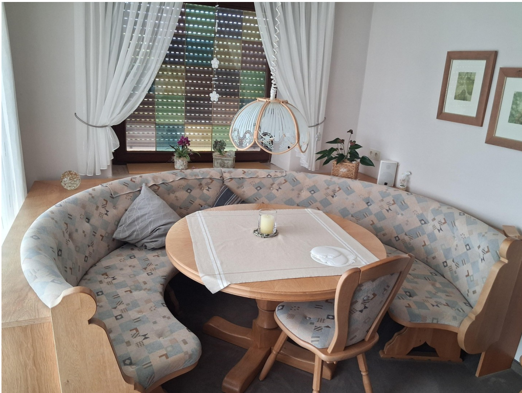
Esszimmer mit Rundbank