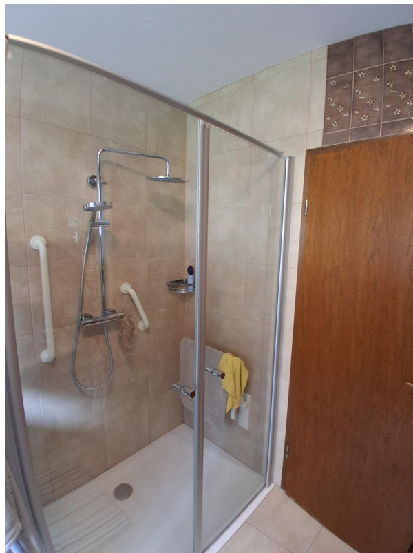
begehbare Dusche Badezimmer