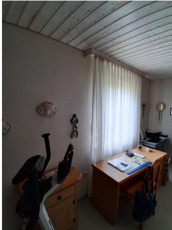
Kinderzimmer - Büro