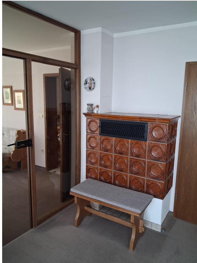
Kacheofen im Wohnzimmer