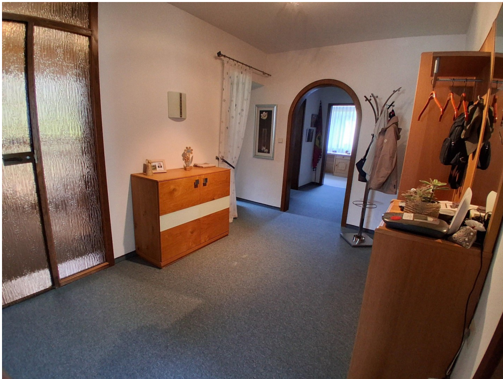
Diele mit Garderobe