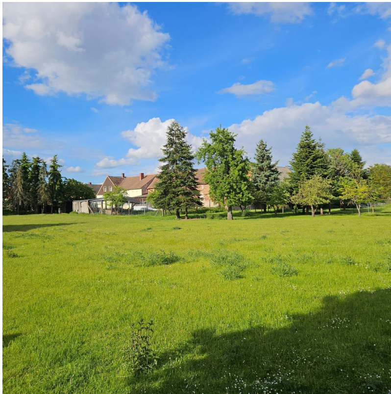
Küche mit Einbauschränken