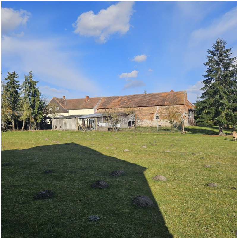
Hof mit Scheune