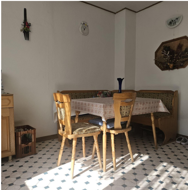
Lagerbereich im Hof