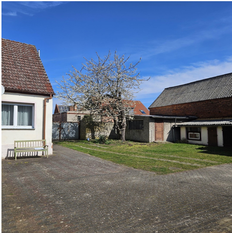
Straße mit Blütenbaum