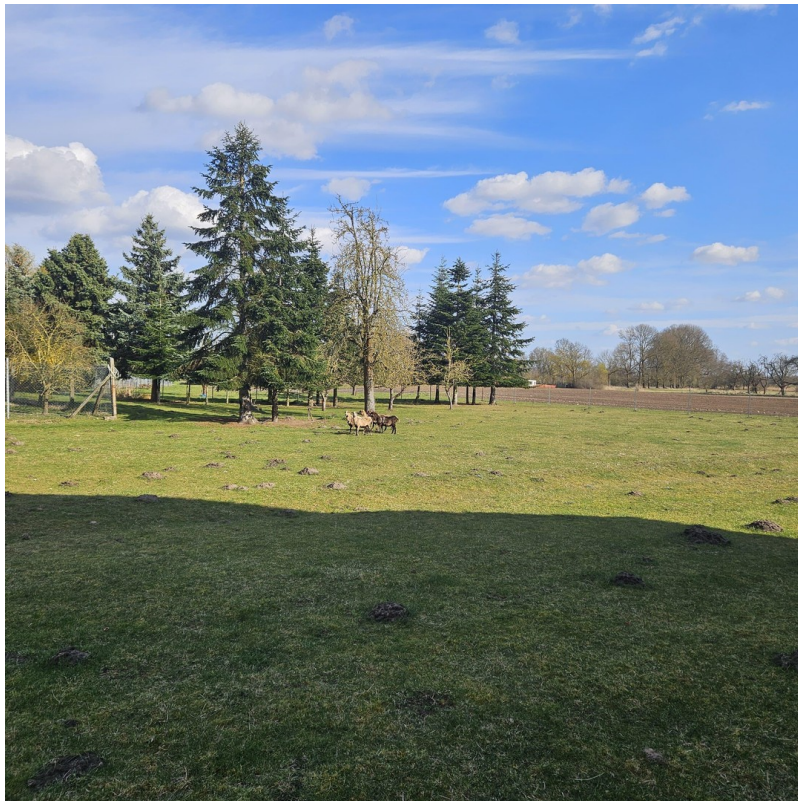
Wiese mit Nachbarhäusern