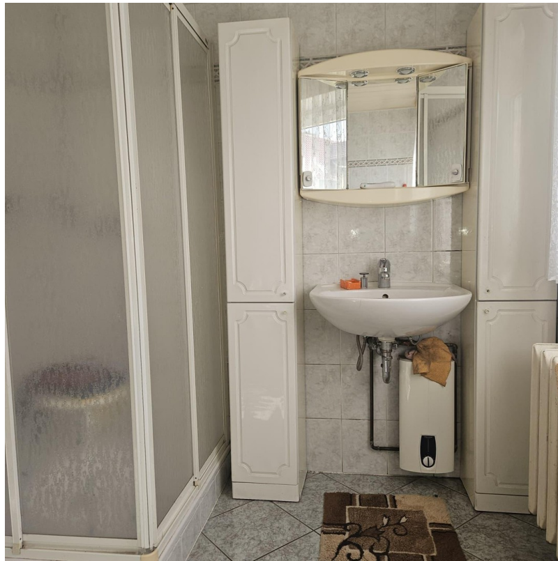
Blick über die Wiese