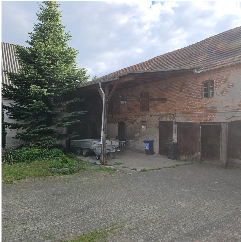
Hofeinfahrt am Nebengebäude