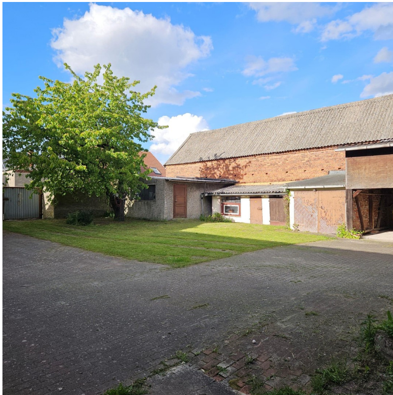
Hofansicht mit Scheune