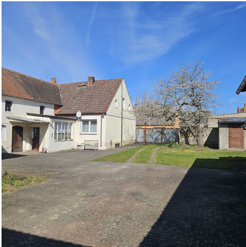
Hof mit Blütenbaum