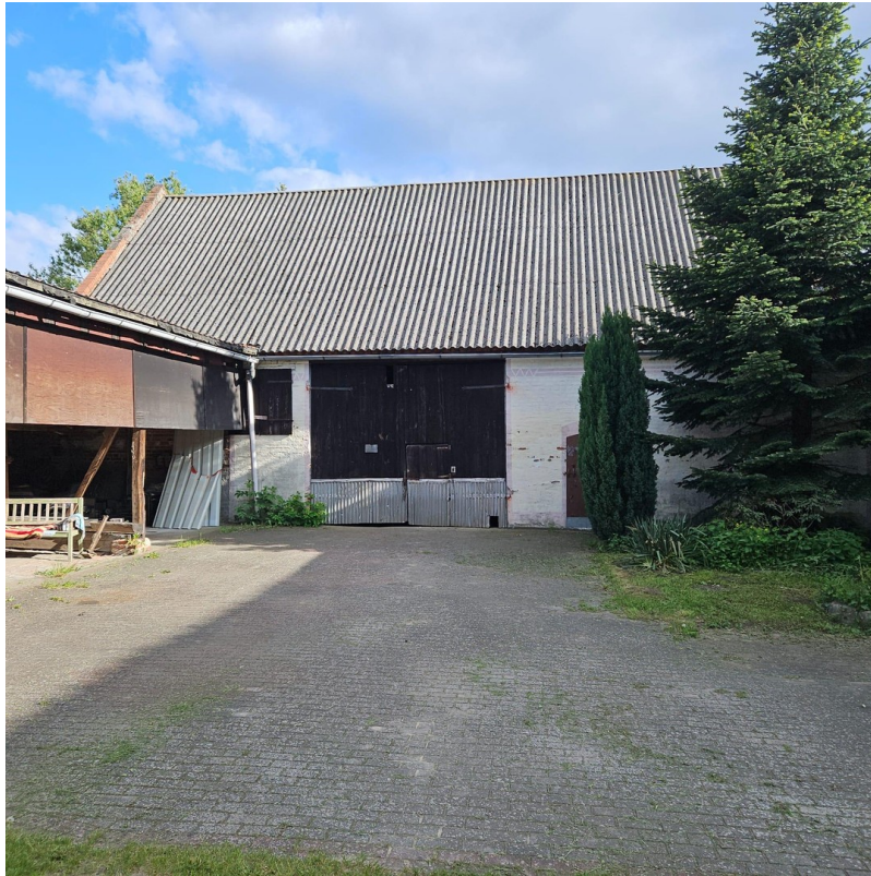
Scheune mit Einfahrtstor