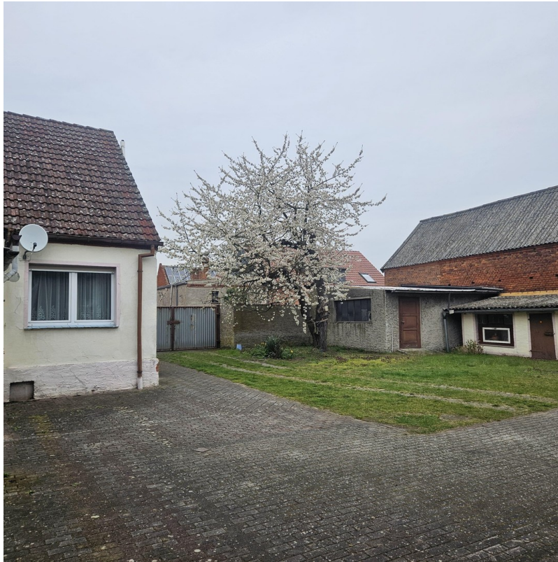
Scheune und Grünfläche