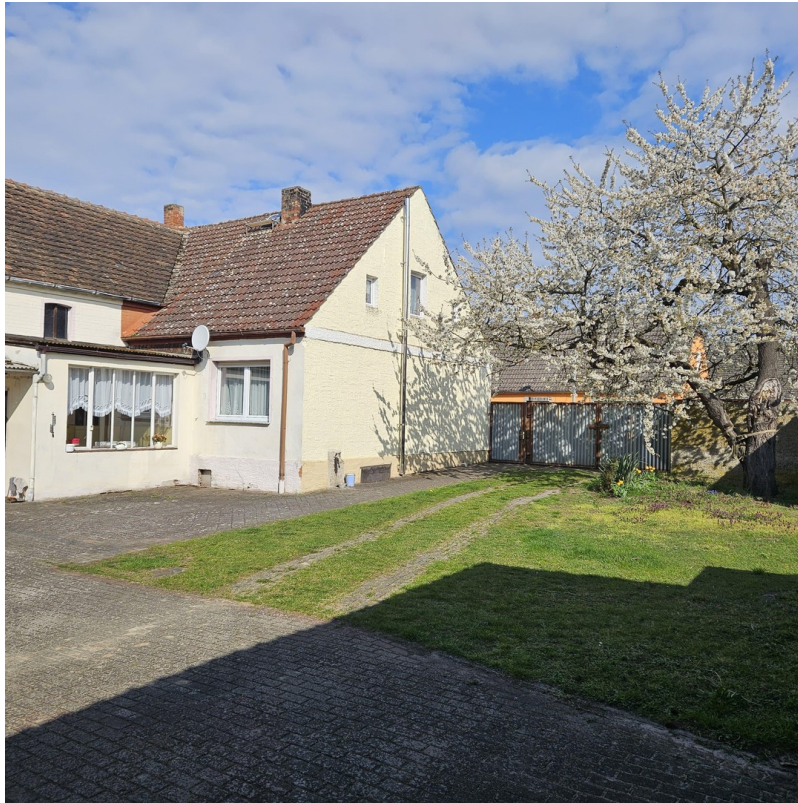
Seitenansicht des Hauses