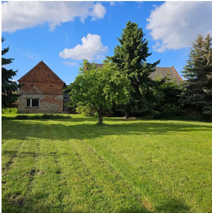
Garten mit Nebengebäude