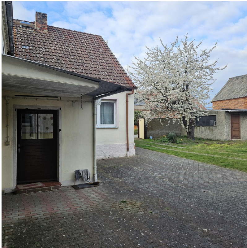
Scheune und Wiese