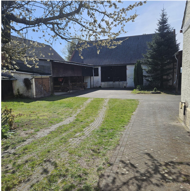
Hausansicht mit Garten