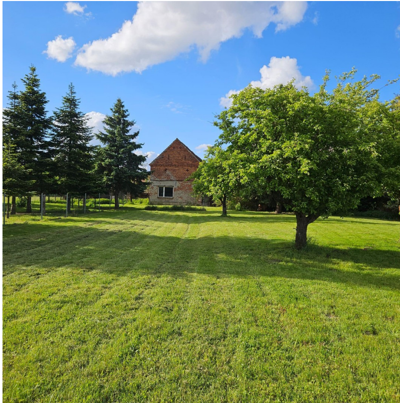
Wiese mit Scheunenblick