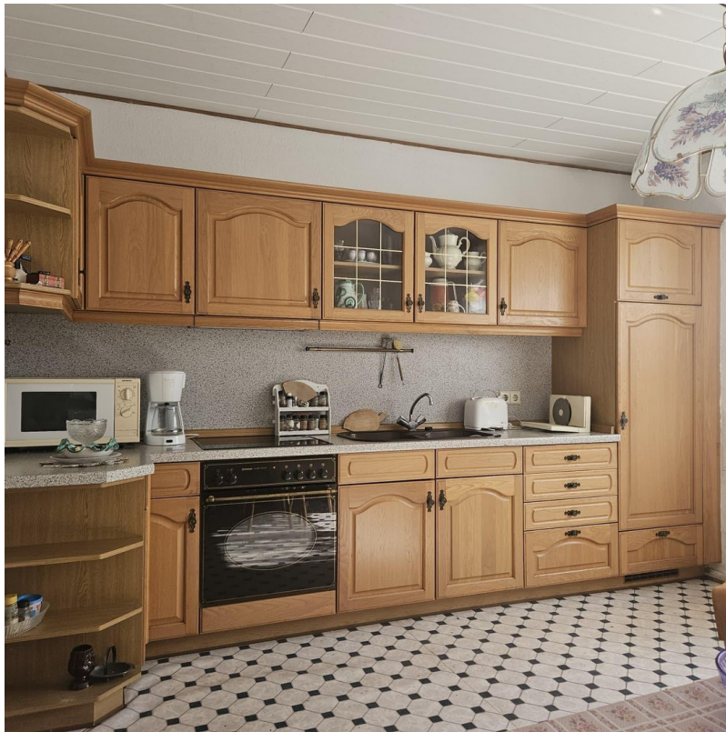
Essecke mit Holztisch