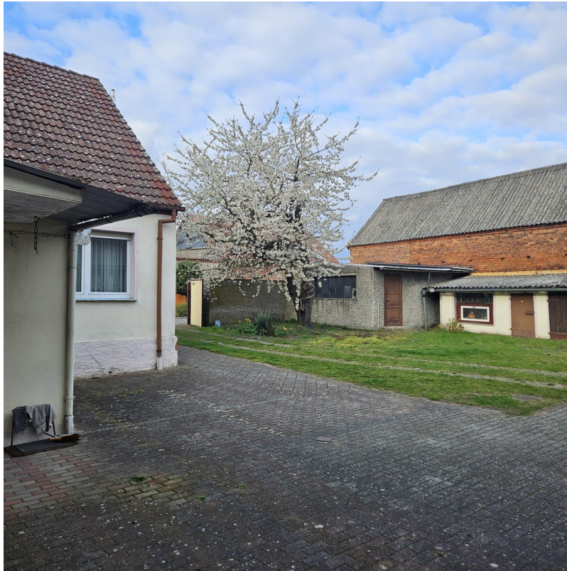
Hausansicht im Frühling