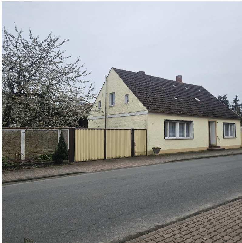
Hauseingang mit Vordach