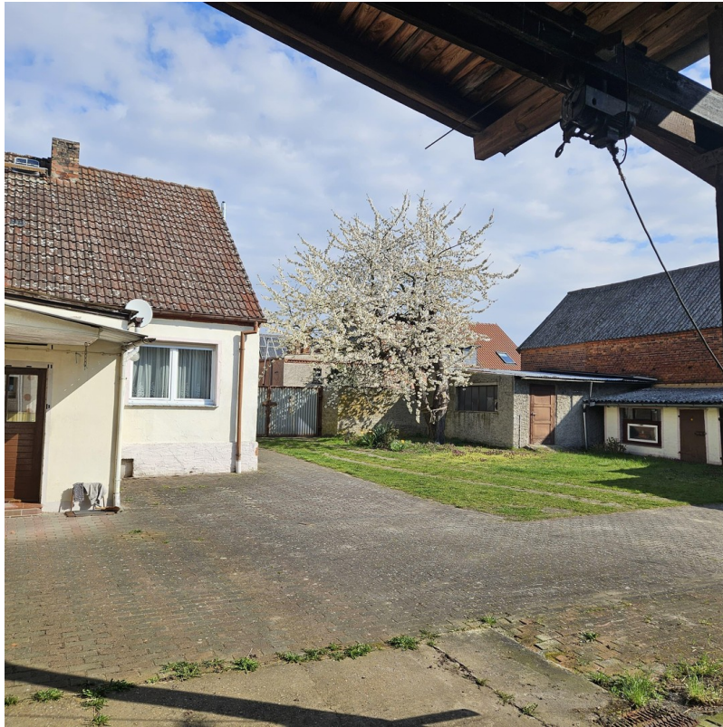
Bad mit Eckbadewanne