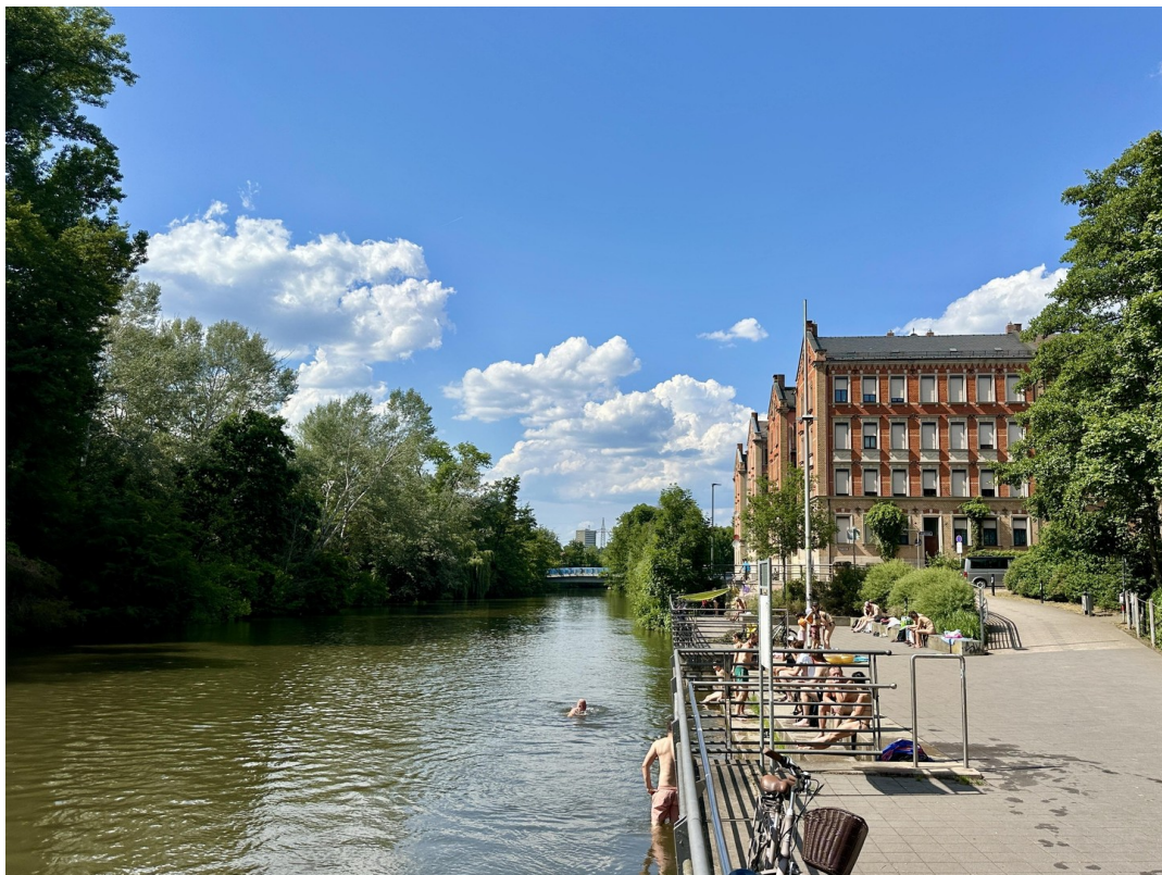
Uferpromenade Café Badehaus