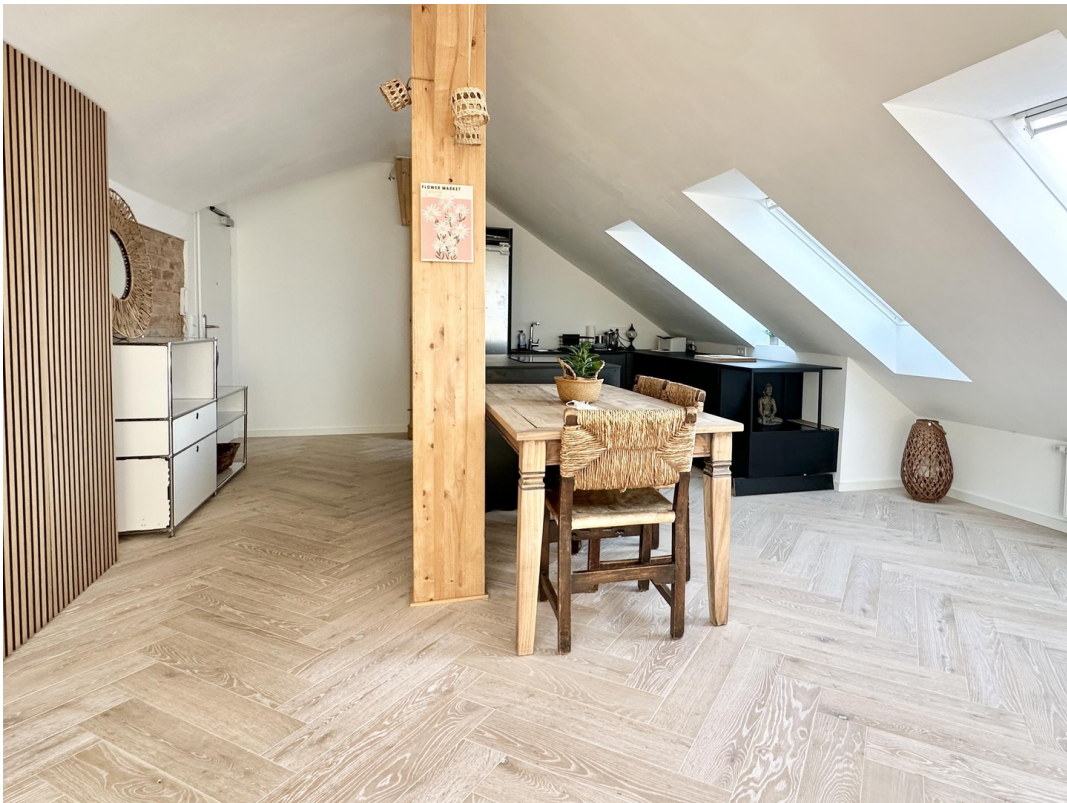
Wohnloft zur Küche