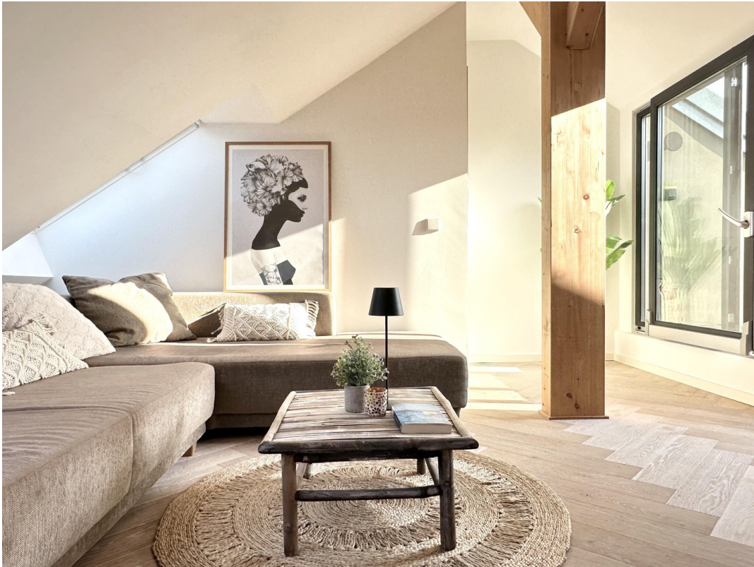
Coach und Dachterrasse